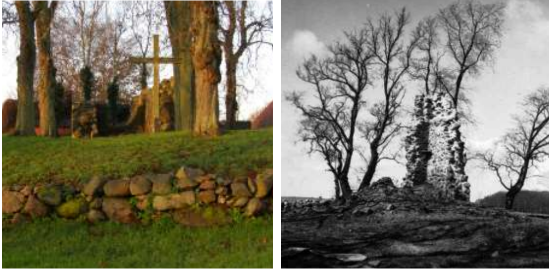
T.v. Ruinen efter Börninge gamla kyrka belägen i Norra Börninge, strax norr om Börningekloster. T.h. Lemmeströ kyrkoruin.