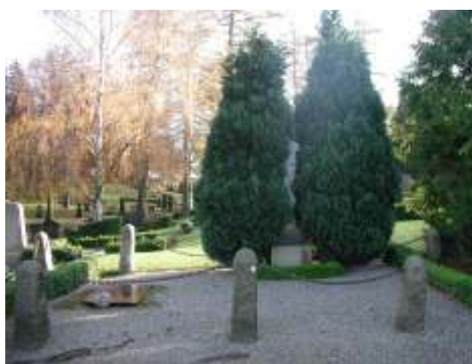
Överst t.v. En familjegravplats i kvarter C med tidstypiska gravvårdar i svart granit med uppåt avsmalnande liv och vinkelat krön. Gravplatsen omgärdas av buxbomshäck. Överst t.h. Gravplats med omgärdning av stenram samt plantering av svängda buxbomspartier avsedda för plantering av blommor. Nederst t.v. En av kyrkogårdens två gravplatser omgärdade av kalkstensmur i terrassparti i kvarter O. Nederst t.h. Gravplats i kvarter K omgärdad av stenpollare med kedjor samt plantering av högresta tujor.