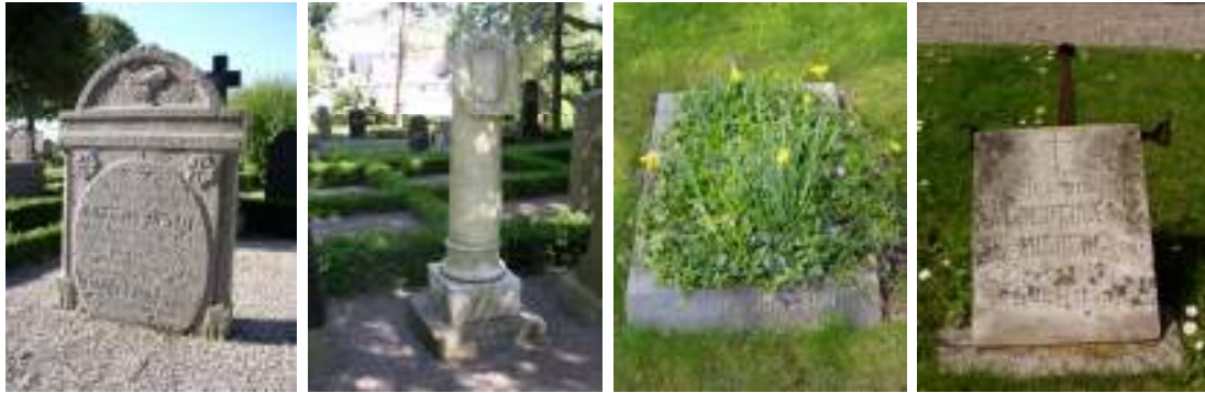
Längst t.v. Karakteristisk och tidstypisk skånsk kalkstensvård i kvarter B. T.v. Gravvård i form av en bruten kolonn försedd med lagerkrans utförd i marmor, typisk för det sena 1800-talet/tidigt 1900-tal. T.b. Gravvård i form av planteringsram i polerad svart granit. Längst t.h. Ett av de, för Böringe kyrkogård, unika smideskorsen vars korsarmar är försedda med händer uppbärandes inskriptionsplatta i marmor.

De gravplatser som saknar omgärdning har såtts igen med gräs och ligger företrädesvis insprängda i kvarteren. I kvarter O finns ett större område som är igenlagt med gräs och endast ett fåtal spridda gravplatser. En viss inkonsekvens kan anas vid återlämnande av gravplatser. I vissa fall har buxbomsomgärdningarna och singeltäckningen bibehållts medan gravvården/gravvårdarna tagits bort. I andra fall har gravvården fått stå kvar men dess omgärdning har avlägsnats och gravplatsen har såtts igen med gräs.