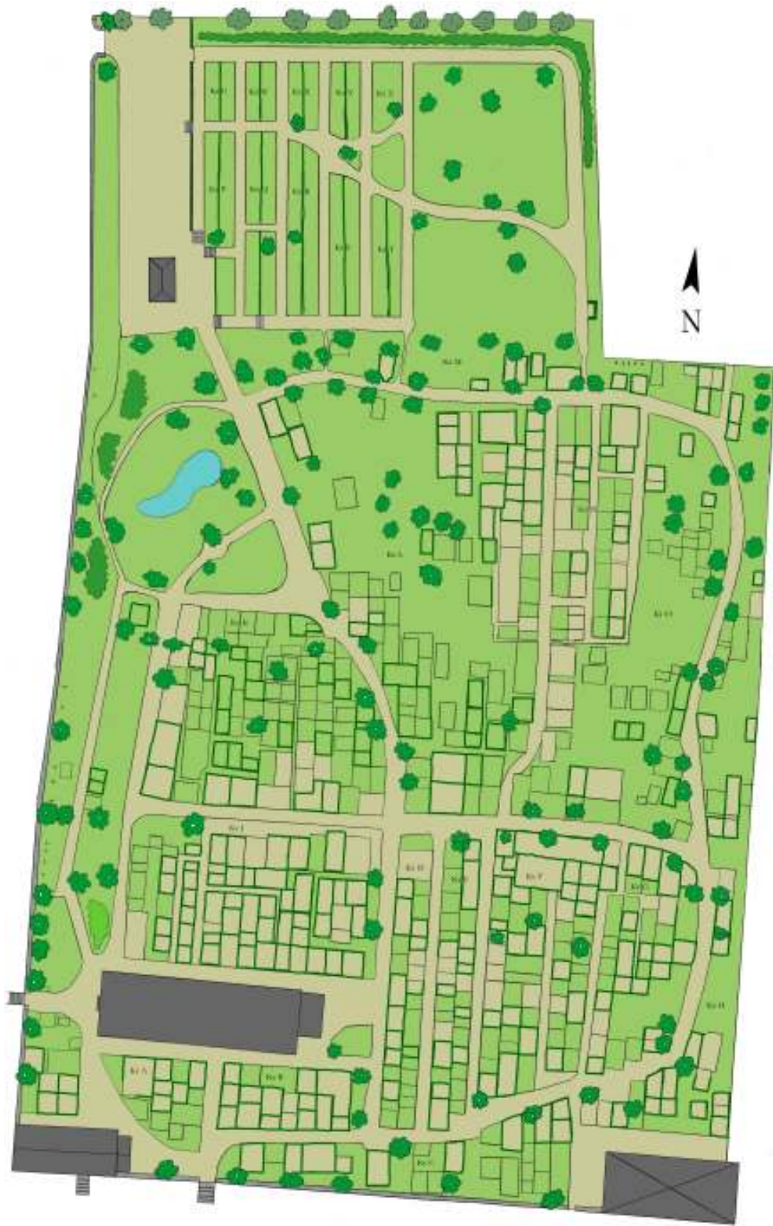
Omarbetad gravkarta med kulturhistoriskt värdefull vegetation och växtlighet markerad i mörkare grönt.