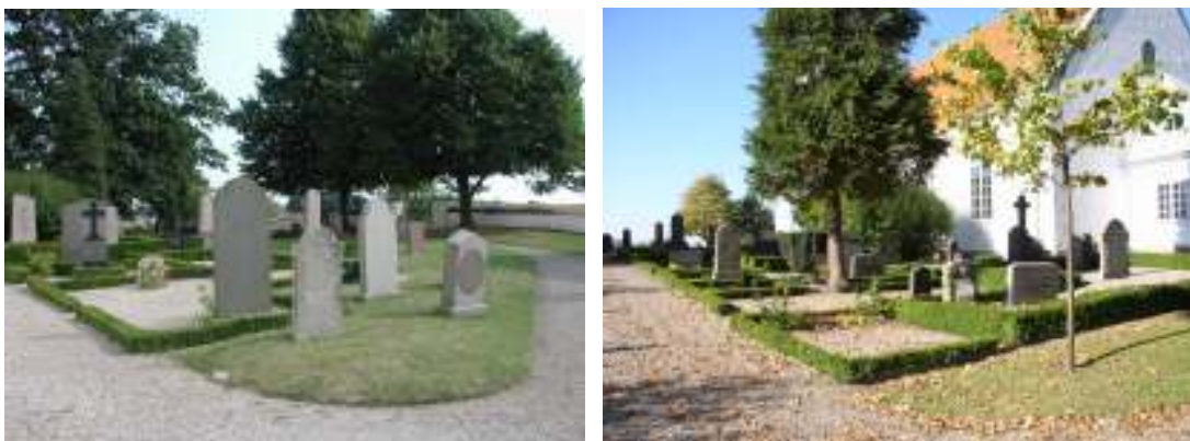
T.v. Äldre kalkstensvårdar i kvarter A. T.h. Kvarter B med buxbomsomgärdade gravplatser strax sydost om kyrkan.