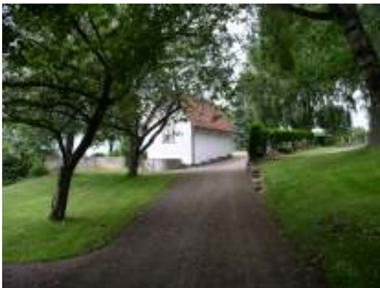
Överst t.v. Sockenstugan är införlivad i kyrkogårdsmurens sydvästra hörn och är uppförd samtidigt som kyrkan.