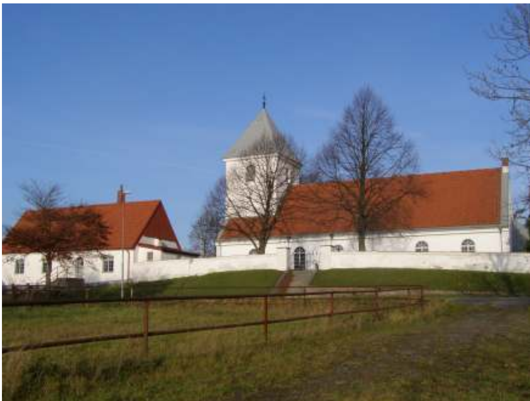
Böringe kyrka sedd söderifrån. Sockenstugan till höger i bild införlivades i kyrkmurens sydvästra hörn och är troligtvis samtida med kyrkan.