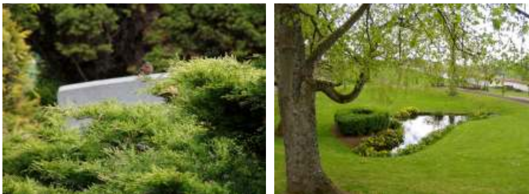
T.v. Fåglar sitter mer än gärna på de varma gravvårdarna och spanar efter föda samtidigt som de bidrar till en härlig och stämningsfull ljudbild på kyrkogården. T.h. Dammen i minneslunden är boplatz åt vattensalamander och skraddare samt utgör dammen fönd till en rofylld och vilsam plats på kyrkogården med sin vackra hängpil och kabbelekan och svärdslijorna som kantar dammen.