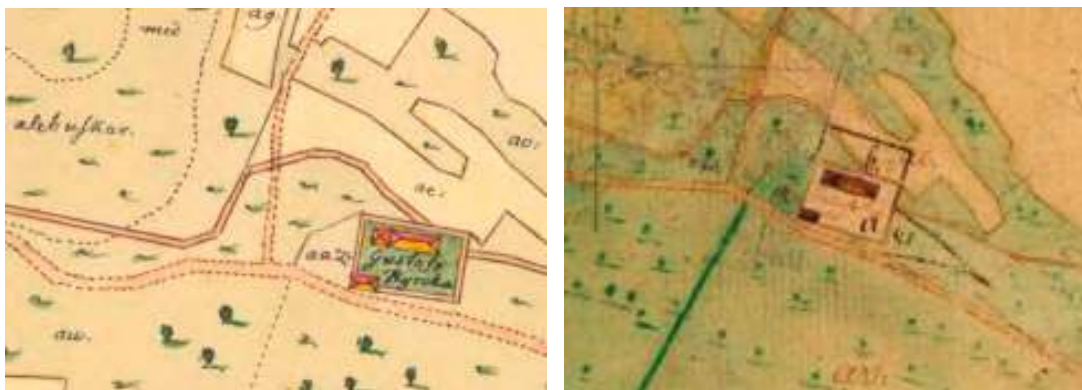
T.v. Gustafs kyrka med kyrkogård 1792. T.h. Tio år senare, 1802, hade ett område norr om kyrkan införlivats med kyrkogården. Området utgör idag kvarter J på kyrkogården.

I ett protokoll från en prostvisitation 1844 står det att läsa: