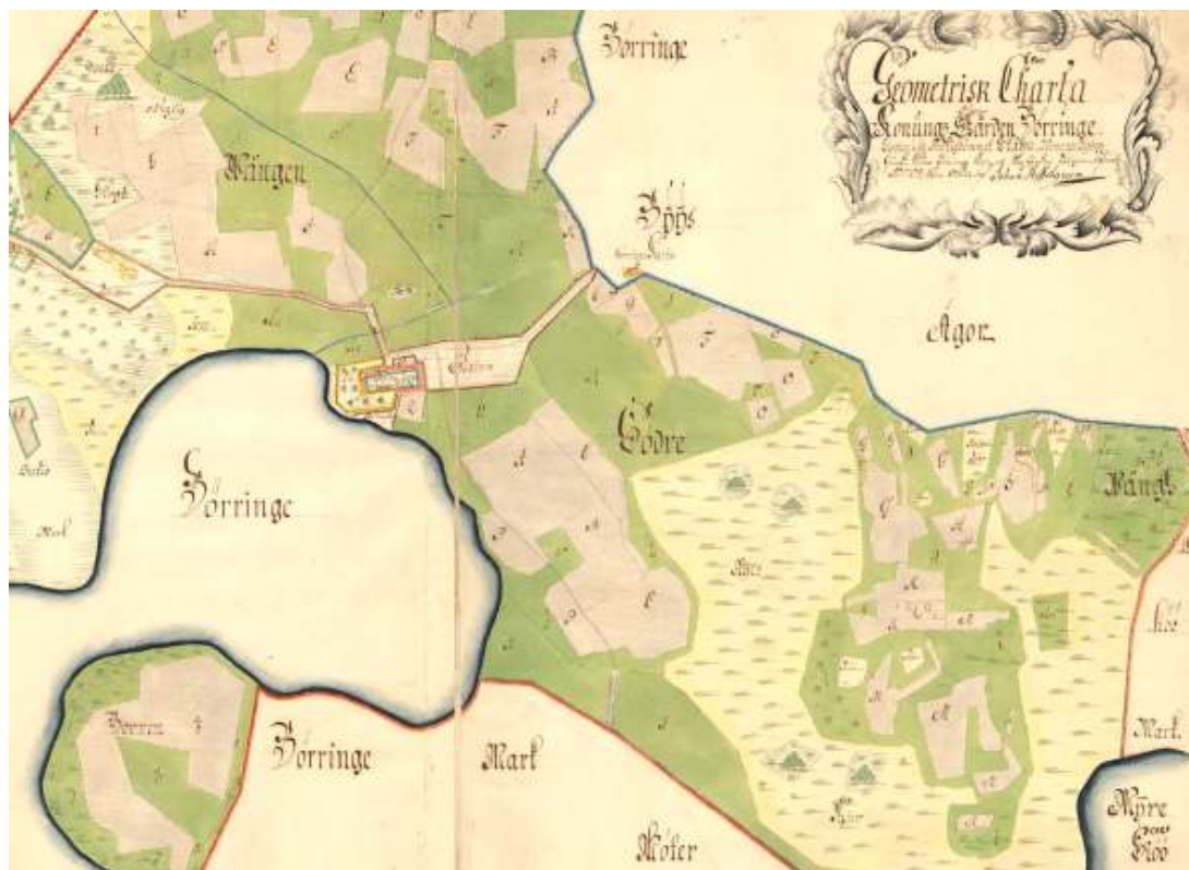
Geometrisk karta över kungsgården Böringe-kloster 1709. Här ser man Böringe-kloster beläget vid Böringesjöns nordöstra strand samt vägen som leder upp till dåvarande Böringe kyrkby, som omnämns Norra Böringe by på äldre kartor. Längst till höger i bild finns Nötesjöns marker, norr om Myresjön, dit nuvarande Böringe kyrka förlades efter sammanläggningen av de båda kyrkorna i Norra Böringe och Lemmeströ.