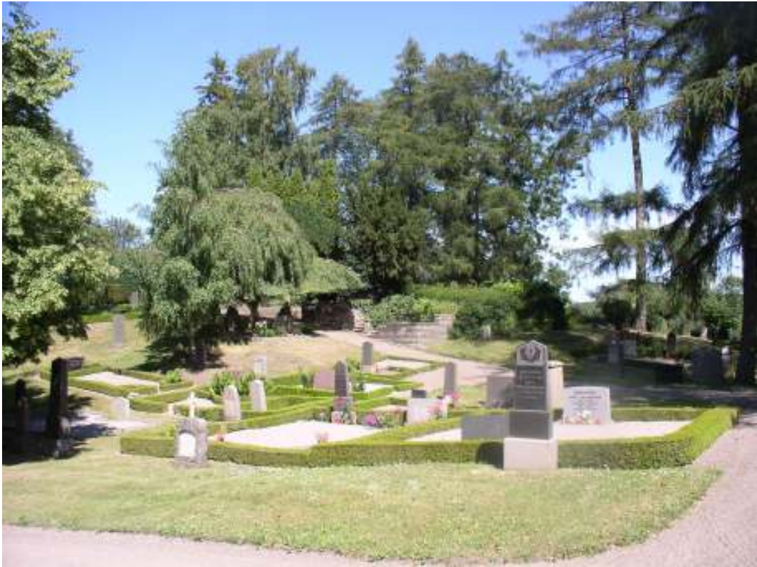
Kvarter L, N och O sedda från sydväst. Kvarteren utgör kyrkogårdens högsta punkt och området är kuiperat.