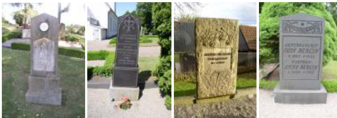
Längst t.v. Stående vård i gjuten cement från 1870-talet med infälld inskriptionsplatta i marmor samt biscuitmedaljong med motiv "Natten" av Bertel Thorvaldsen. T.v. Stående gravvård i polerad svart granit, typisk för det sena 1800-talet/ tidiga 1900-talet med blåstrad dekor i form av latinskt kors omgivet av brutna sädesax, mycket vanligt förekommande på Börringe kyrkogård. T.h. Stående gravvård i grå grovbuggen granit med vackert huggen dekor i form av rosor och ormbunkar, jugendstil. Längst t.h. Låg stående gravvård i svart granit/ diabas typisk för tiden 1920-40-tal

platta i marmor. På kyrkogården har flera av dessa inskriptionsplattor hittats uppställda mot andra gravvårdar, varför det troligtvis har funnits fler smideskors av denna variant tidigare.