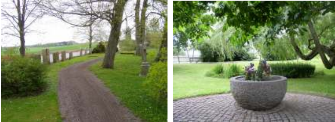
T.v. Paradstigen i den Beckfriiska gravstaden löper genom hela kvarteret. T.h. Kärl för placering av snittblommor i minneslundan med utsikt över dammen.