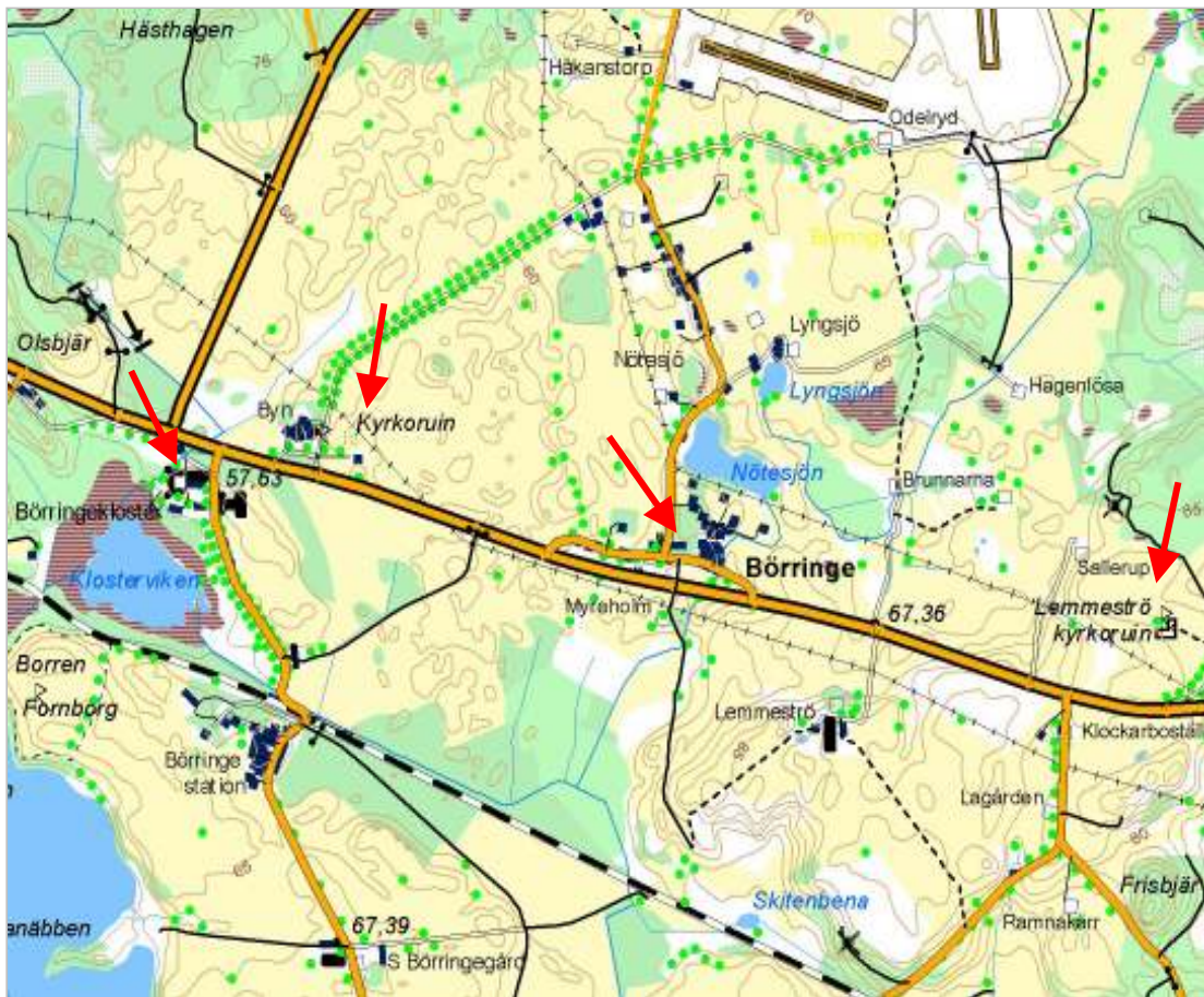
Böringe med stationsambället, Böringekloster, Böringe gamla kyrkas ruin, Böringe nya kyrka samt Lemmeströ kyrkoruin markerade