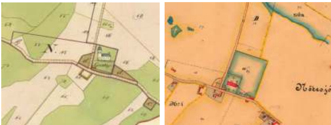
T.v. Böringe kyrkogård 1831. T.h. Böringe kyrkogård efter ansevärd utvidgning 1899.

I ett protokoll från en prostvisitation 1885 står det att läsa: