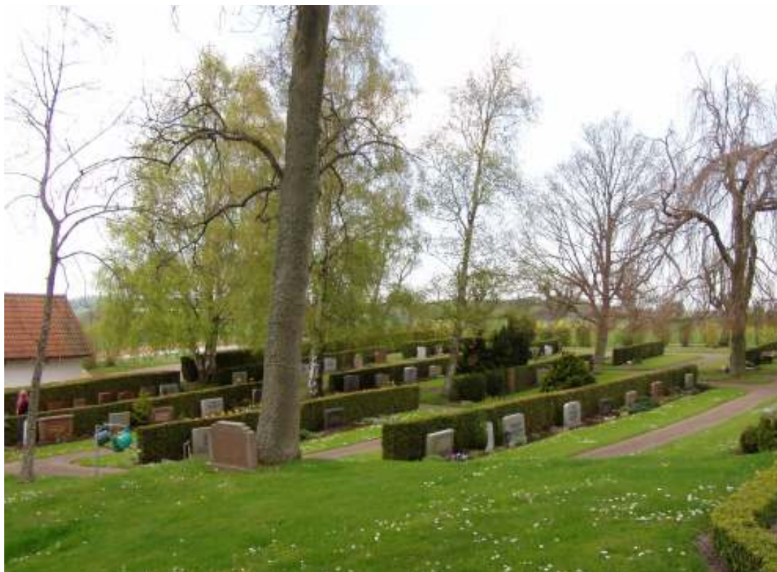
T.n. Kvarter P-Z sedda från kyrkogården i söder. Låga gravvårdar i samma storlek är här placerade mot rygghäckar.