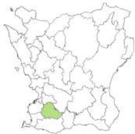
Skånekartan med Svedala kommun markerad.