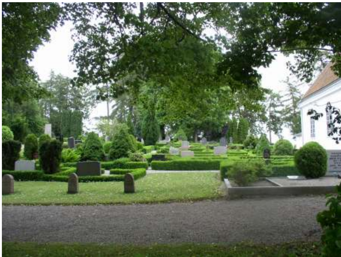
Kvarter J sett från väster. Gravplatserna är omgärdade av buxbomshäckar och har plantering av formklippta parställda städsegröna växter.