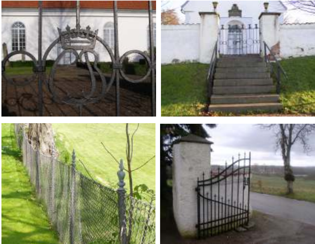
Överst t.v. Dubbelgrinden i det södra murpartiet är försedd med monogram. T.h. Från parkeringsplatsen i sydväst leder en trappa upp till det västra entrépartiet, vilket är försedd med en dubbelgrind i samma stil som den i söder. Nederst t.v. Kyrkogårdens norra och östra sträckning avgränsas av ett gunnabostängsel med stolpar krönta av franska liljor. T.h. Längst upp i kyrkogårdens nordvästra hörn finns en bred dubbelgrind med svängt överparti som leder in till en körväg i anslutning till kyrkogårdens nyaste del.