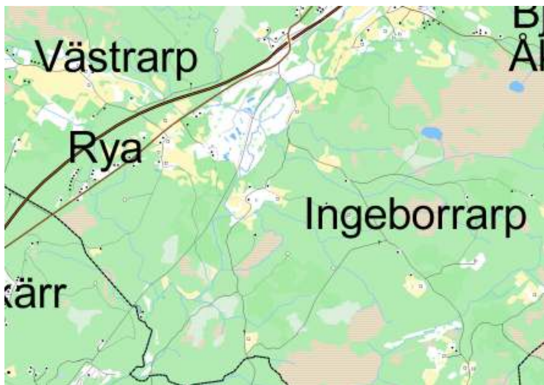
Ingeborrharpsgården ligger strax öster om E4:an i höjd med Rya.