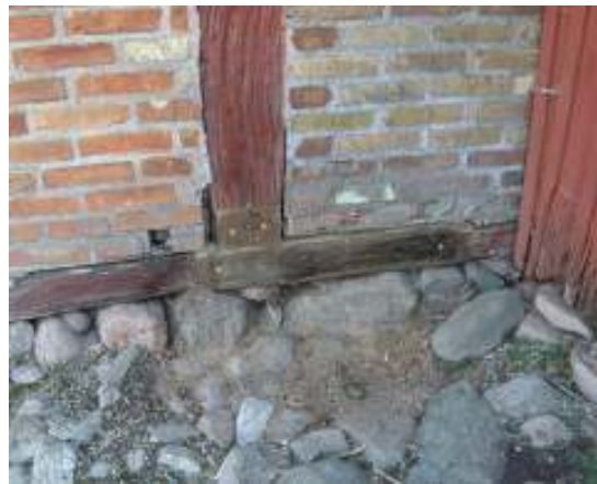
Vänster bild: Rötskadad syll och stolpe på loglängan. Höger bild: Syll och stolpe efter lagning men innan fogning.