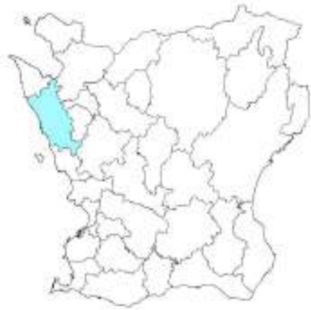
Jöns Jonsgården ligger i Helsingborgs kommun.