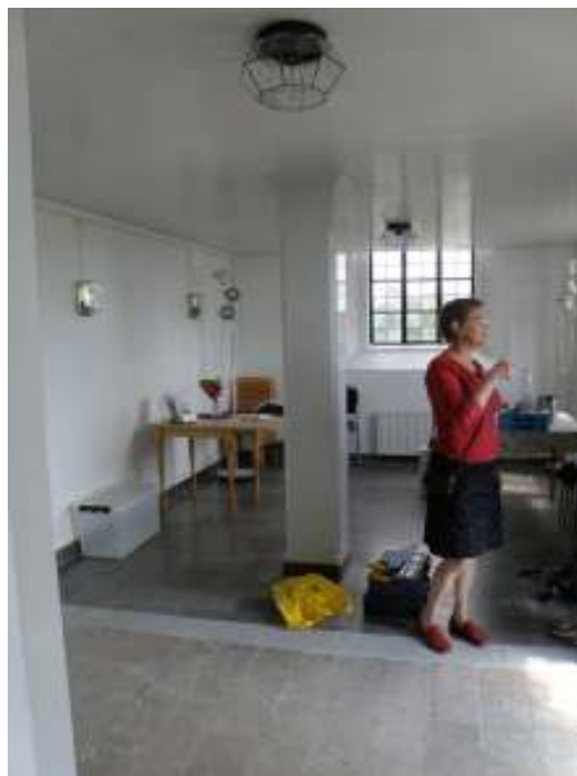
För att få ett mer verksamhetsanpassat entrérum med möjlighet till enklare servering skapades en öppen planlösning genom att riva en vägg och ett par skåpsinbyggnader.