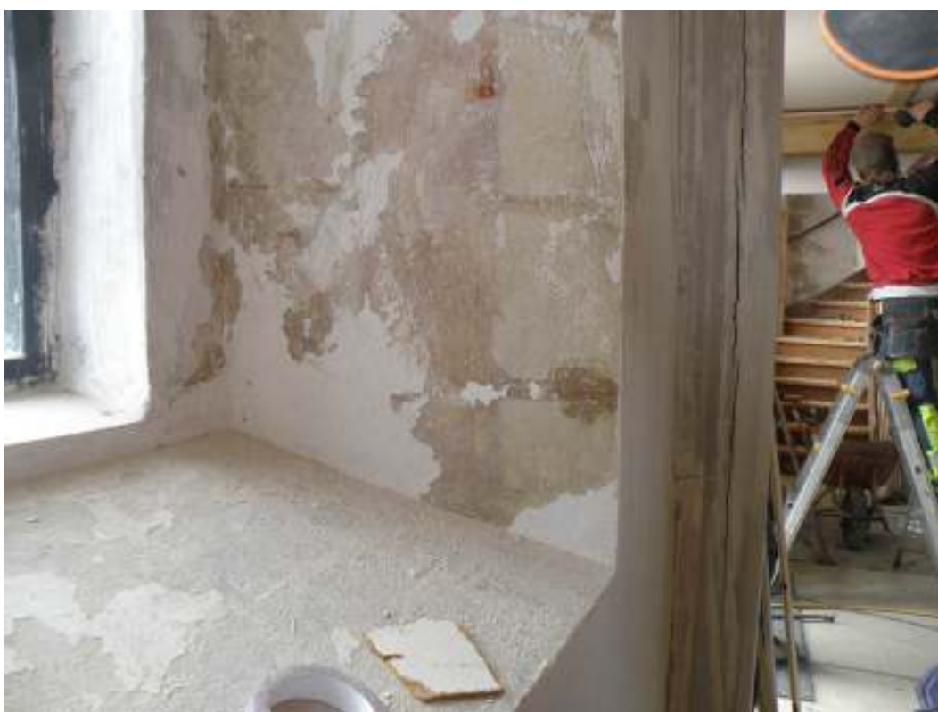
Kvadermålning i fönstervalv i fd sakristian.