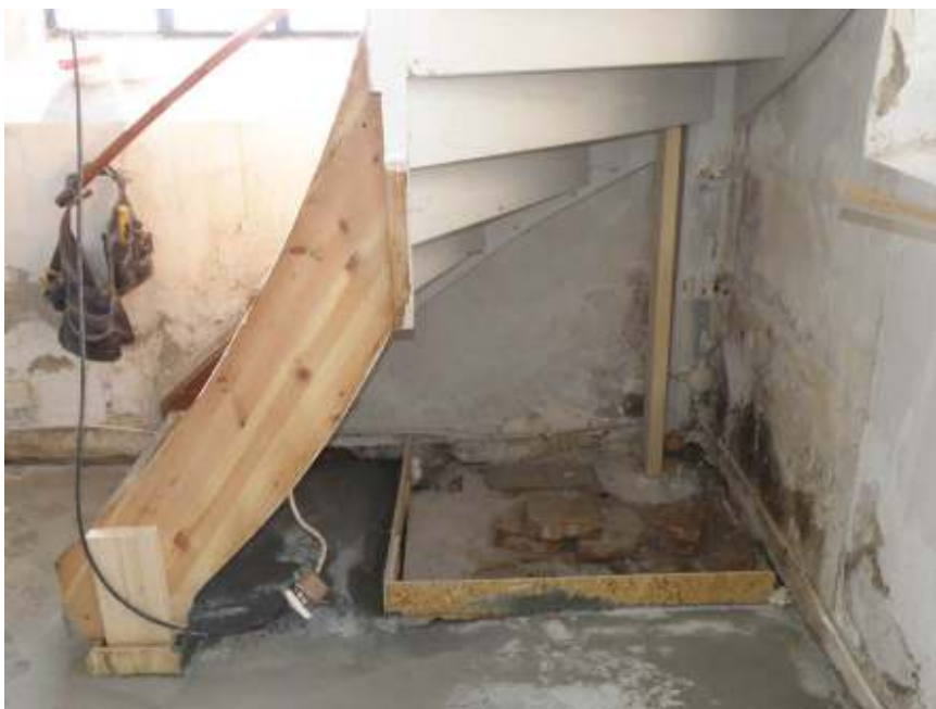
Ett parti med tegelgolv lämnades synligt under trappan till läktaren.