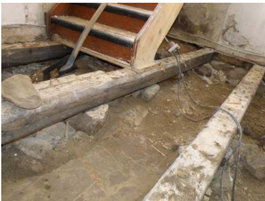
Rester av ett äldre golv ligger bevarat under golvbjälklaget i utrymmet för den nya wc:n.

Under trappan fanns ca 1m 2 bevarat av äldre tegelgolv som bedömdes vara det kanske ursprungliga i korsarmen. Golvet bestod av vanligt handslaget rött murtegel med format ca 6 x 12 x 21 cm. Teglet låg i sand utan fogbruk. Denna tegelrest var å andra sidan att räkna inom ursprungligt bänkkvarteretsgolv. Som fundament till läktarpelare låg i golvytan en större gråsten.