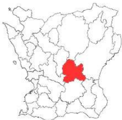
Skånekarta med Hörby kommun färgmarkerad