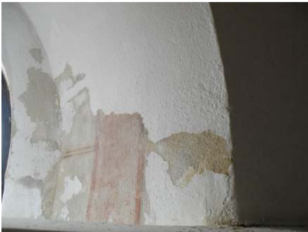
Kvadermålning från slutet av 1800-talet finns bevarat under putsen i fönstervalven. Bilden visar ett parti i fönstervalv vid trappan upp till läktaren.