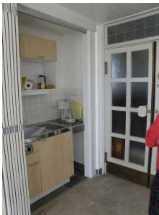
Ett nytt stolförråd placerades diskret bakom en skjutdörr och ett pentry bakom en platsbyggd vikedörr. Kyrkoherde Eva-Karin Lindgren var bygglédare för ombyggnaden.