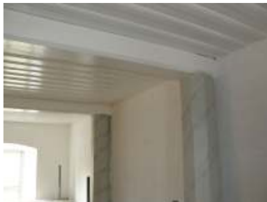
Bild nedan: Taket i entrén skrapades rent och målades med vit linoljefärg.