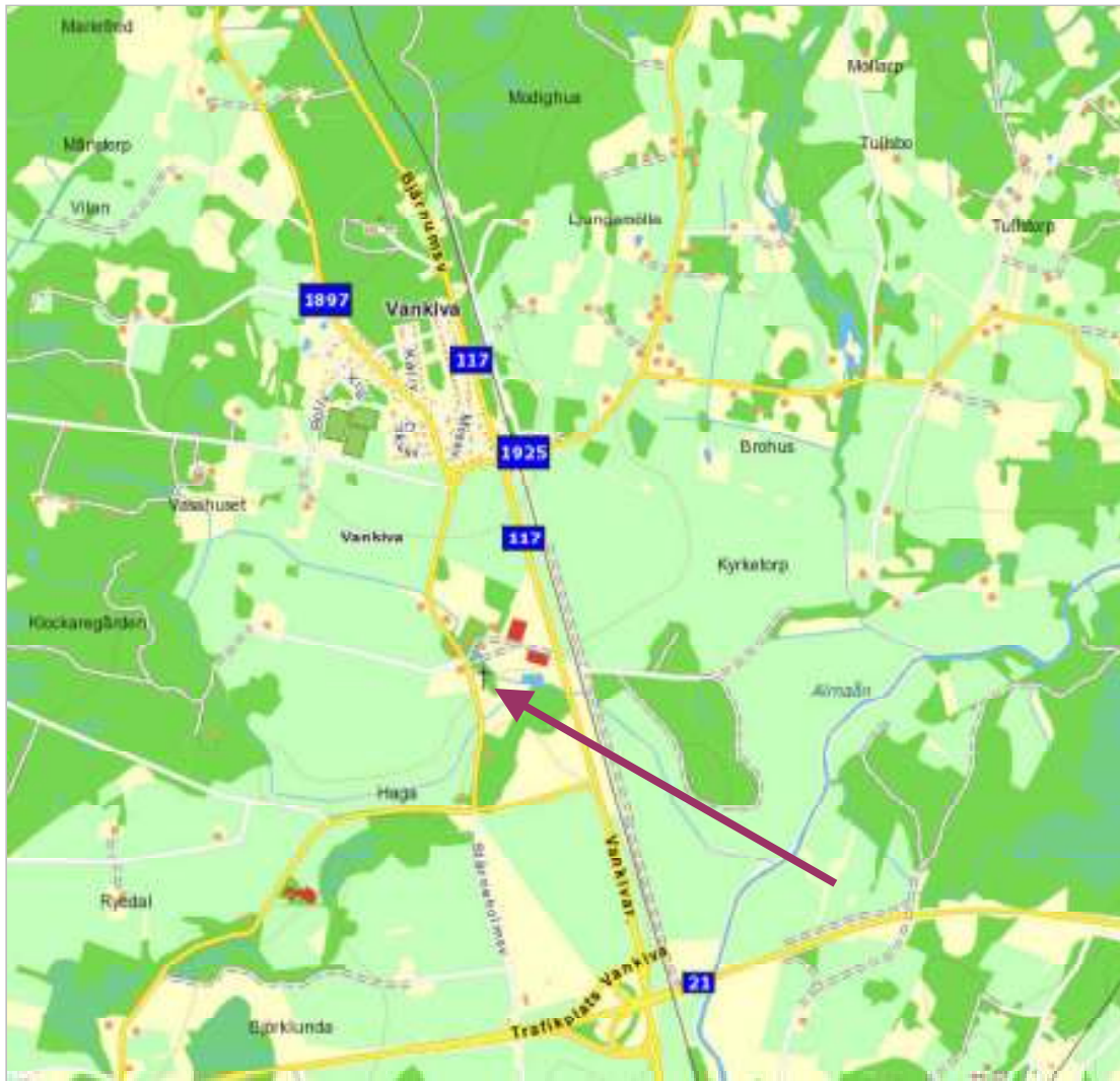
Vankiva socken med Vankiva kyrka markerad.