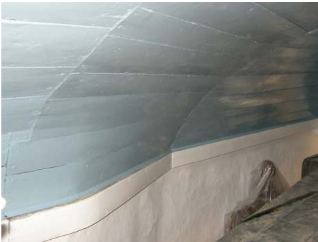
Bild ovan: Det nymålade taket i, närmast nog, "våblinblå" kulör. Hammarbanden nedanför paneltaket målades med linoljefärg och väggarna omkalkades.

Förhoppningen är att skrapning, dammsugning och partiell kittning av skarvarna skulle hindra framtida nedsläppning av damm och sågspån. Vid denna restaurering av taket kunde man inte rengöra takets ovansida där taket och det isolerande sågspånet täcks av tilläggsisolering. Det är dock sannolikt att taket efter något/några år kommer att kräva upprepade åtgärder och underhåll då skarvarna fortsätter att röra sig och partiklarna även i fortsättningen kommer att vandra genom de spåntade brädkanterna.