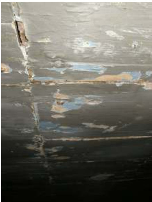
Bild till vänster: Tidigare färgspår i taket över långhuset och sidoskeppet. Den ”wählinblå” färgen underst, en senare mörkgrå färgnyans överst.