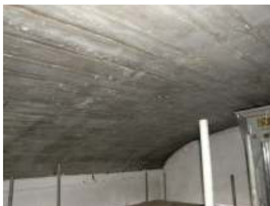
Bild nedan: Taket över sidoskeppet efter borttagning av tretexskivor och papp.