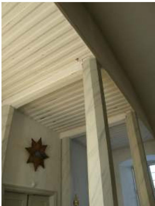
Bild till vänster: Taket ovanför entrén i väst, i nykyrkan, innan restaurering.

Kapprummet, vänster om entrén, målades – den sekundära, trärena panelen vitlaserades. Detta godkändes av antikvarien då den aktuella panelen från 1984 saknar antikvariska eller kulturhistoriska värden.