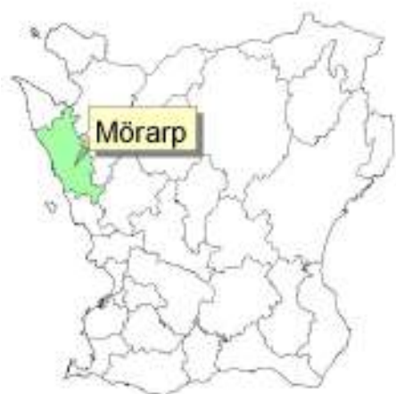
Skånekartan med Helsingborgs kommun och Mörarp markerade.