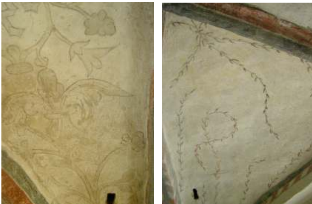
Bild 4 t.v.: Målning i långhusets östligaste valv efter avslutad rengöring. Äldre retuscheringar framträder som mörka fläckar i den omålade ytan. Bild 5 t.h.: På kalkade ytor mellan de sirliga bladslingorna i såväl det östligaste som det mellersta långhusvalvet framträdde efter rengöring gulaktiga partier. Troligen är dessa spår efter de förstärkningar med kasein som utfördes i samband med målningarnas framtagande på 1930-talet.