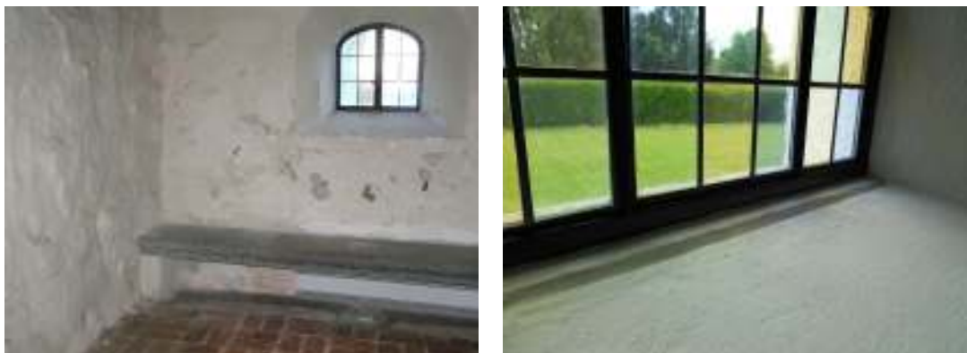
Bild 2 t.v.: På vapenhusets norra vägg fanns hälsovådliga röda alger innan arbetena påbörjades. Väggen har noggrant tvättats och sedan putsats och avfärgats. Bild 3 t.h.: På insidan av samtliga fönster i långhus och kor har rännor byggts ner i putsen för att samla upp det kondensvatten som bildas på fönstrens insida. Tidigare har fula rinningar uppstått i fönstersmygarnas underkant.