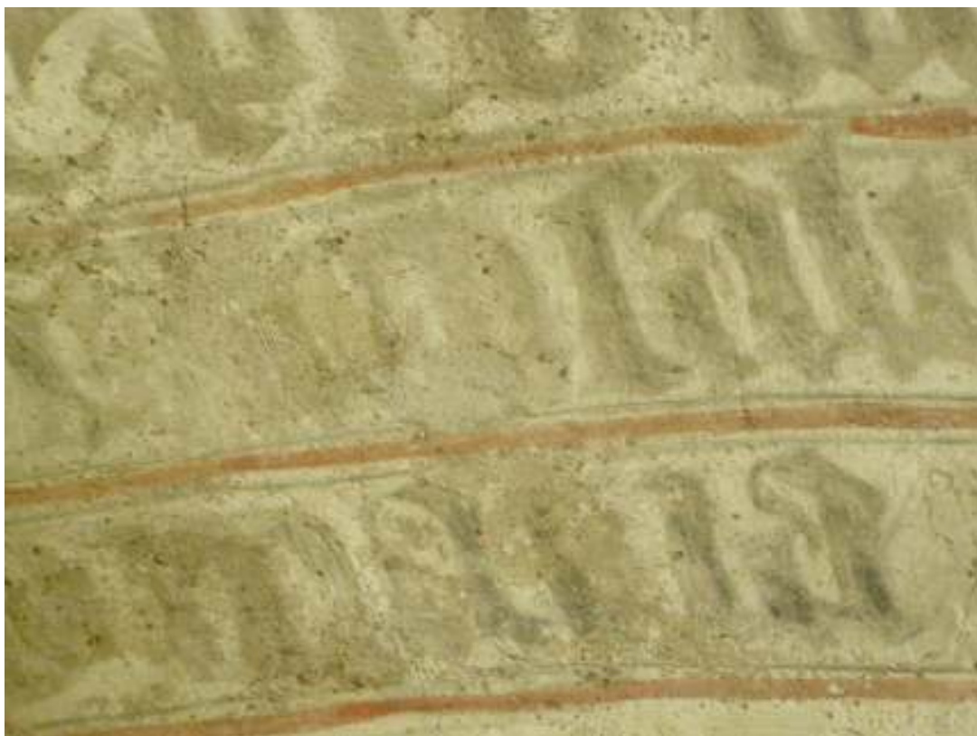
Bild 6: Östra långhusvalvets inskription efter rengöring. Ytor mellan inskriptionens bemålning har retuscherats för att få en tydligare helhetsbild av inskriptionen och öka läsbarheten.

överensstämmer väl med kalkmåleriets gråa kulörer vilket innebär att järnet inte stör intrycket av målningarna på samma sätt som tidigare.