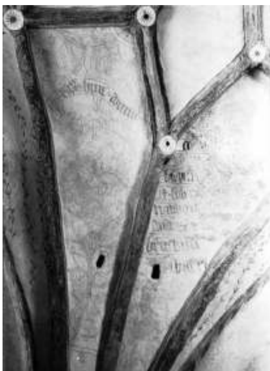
Bild 7 överst t.v: Ett av hålen i skärningspunkten mellan valvriibborna i östra långhusvalvet. Bild 8 ovan t.h: En annan skärningspunkt i samma valv som föregående bild försedd med trätapp med bemälad ände. Bild 9 t.v: Äldre fotografi i ATA tagen i samband med kalkmålningarnas framtagande på 1930-talet. Även på denna bild framträder skärningspunkterna mellan stjärnvalvens valvriibbor med hål, en del av dem försedda med tapper, bland annat skärningspunkten längs till böger på bilden.

Vid rengöring av långhusets bemålade valv iaktogs att i det östligaste valvet hade retuscheringar från framtagandet av målningarna år 1931 även skraffering i putsytan. Liknande skrafferingar förekom inte i långhusvalv nummer två från öster eller korvalvet. Skraffering av nytillkomna/retuscherade ytor var en modell som bland annat riksantikvarie Sigurd Curman rekommenderade vid restaureringar av kulturhistoriskt intressanta byggnader under 1900-talets första decennier. Anledningen till att skrafferingar endast förekommer i ett valv kan vara att det är olika konservatorer som utfört arbetena i de olika valven. Fredrika Mellander Rönn och Hélenè Svahn har i sitt examensarbete Konservator Alfred Nilsons kyrkorestaureringar 1925-47 studerat ett tiotal kyrkor där Alfred Nilson och hans verkstad varit verksamma. Resultatet av deras studie överensstämmer mycket väl med de äldre konserveringstekniska iakttagelserna i Mörrarps kyrka.