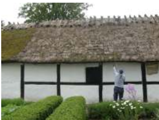
Norra längan innan arbetet.