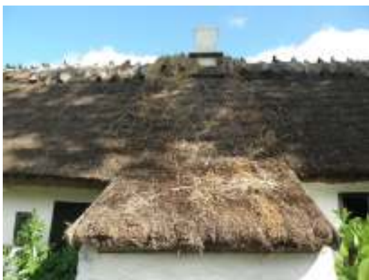
Boningshuset, platsen för lagningsarbeten.

Åtgärden att laga mindre partier på Boningshusets södra takfall ingick inte inom ramen för årets arbete, men då det visade sig efter kontrollräkning att ett par kvm stråttäckning – enligt offererad åtgärdsbeskrivning – kvarstod efter att Norra längans sti blivit omtäckt, beslöts att dessa skulle nyttjas på detta sätt. Åtgärden är godkänd av antikvariskt medverkande.