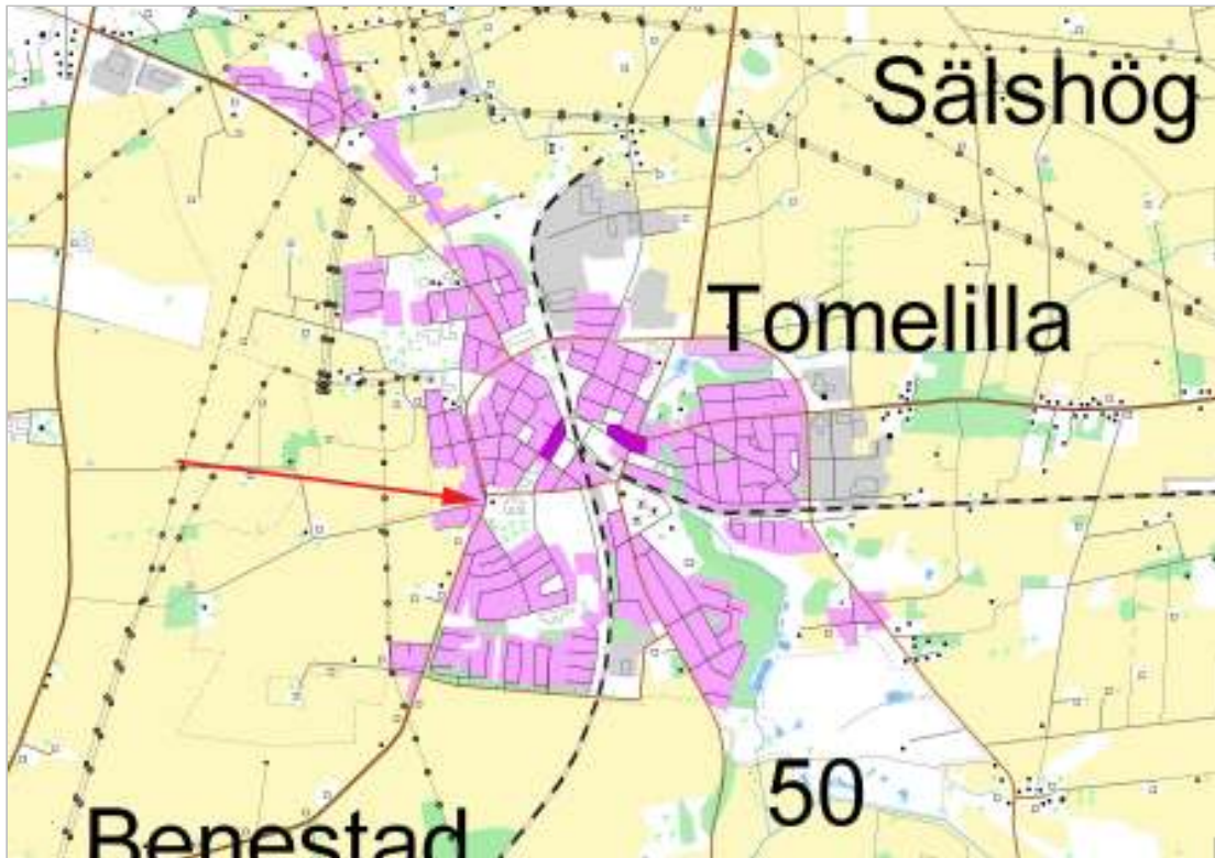
Tomelilla, Byagården markerad