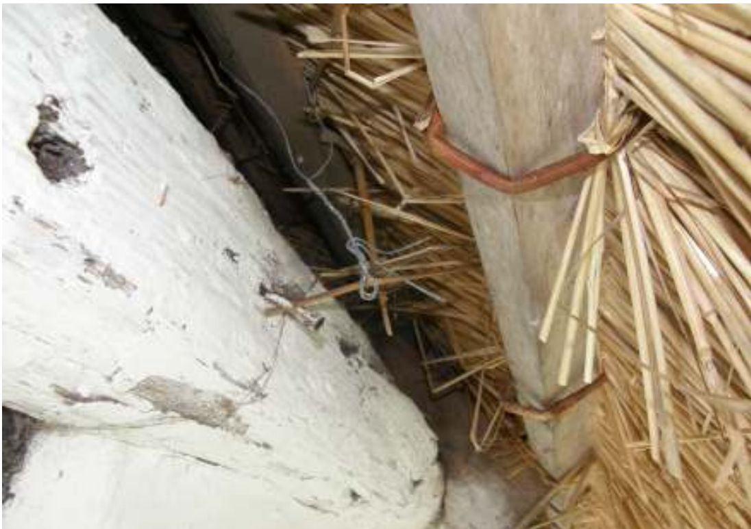
Västra längans västra takfall, vidjebindning vid takfoten. Notera den kvarstående äldre bindningstråden av järn.