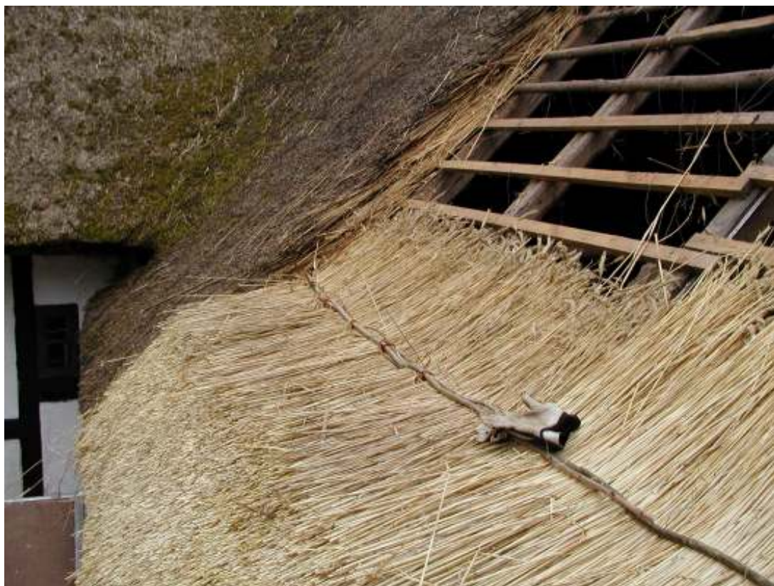
Västra längans östra sti, täckning med hasselrafter och pilvidjor.