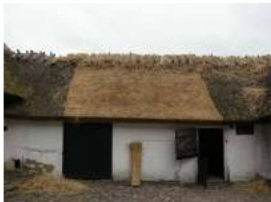
Samma parti efter omtäckning.