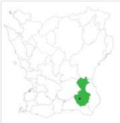
Tomelilla kommun, Tomelilla markerat