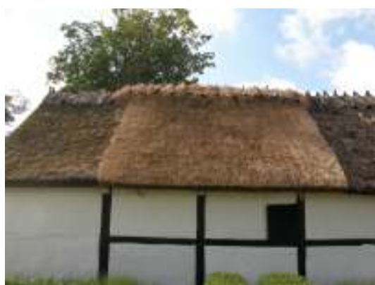
Norra längan efter arbetet.