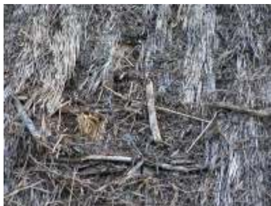
Äldre förbrukade rafter.