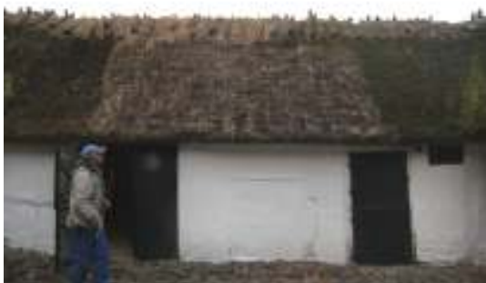
Västra längans västra takfall innan arbetet.

Sammanlagt har fyra stin omtäckt, fördelat på Västra längans västra takfall (två sammanslagna stin), Västra längans östra takfall (ett sti) och Norra längans norra takfall (ett sti). Till samtliga stin har använts av föreningen egenodlad råghalm, vilken skördades på gården Trydeholm i augusti 2009. Tröskning av halmen utfördes i september samma år hos taktäckare Eje Arén i Slimminge. Bindning är i de fall undertaket är synligt utförd med pilvidjor (inköpta från Danmark). I övriga fall har 0,7 mm rostfri ståltråd använts. Till nya rafter har använts oskalade hasselkäppar. Vid Västra längans västra takfall förstärktes en knäckt läkt genom påsalning av ny likt befintlig. På gårdssidans sti kompletterades läkterna med tre stycken nya i stiets fulla bredd (fyrkantssågade, 1 x 2”). Ryggning är utförd med löspressad råghalm. Tio nya ryggträpar av kvartskluven ek, ca 1,20 m långa, tillfogades taket samtidigt som fem par förbrukade ryggträn togs bort. Detta innebär att ryggträna förtätades med fem par. Åtgärden var nödvändig för att säkerställa ryggningens livslängd. På Boningshusets södra takfall, i anslutning till bakugnen, gjordes mindre ilagningar och vid skorstenen förbättrades ryggningen.