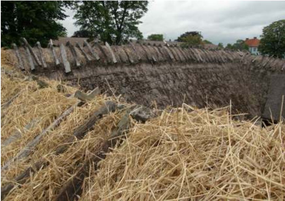
Ny ryggning påförs Västra längan.