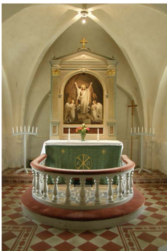
Det nya textilskåpet är placerat bakom altaruppsättningen. Skåpet är väl anpassat i färg och form och är inte synligt från övriga kyrkorummet.