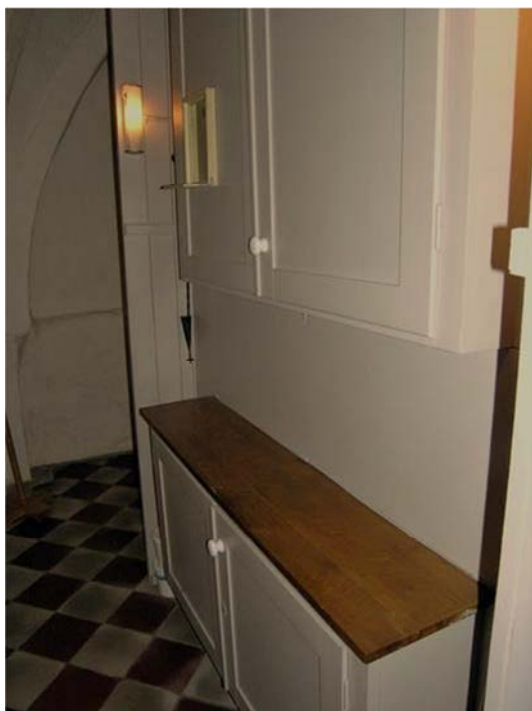
Skåpen bakom altaruppsatsen före uppförandet av den nya textilförvaringen.