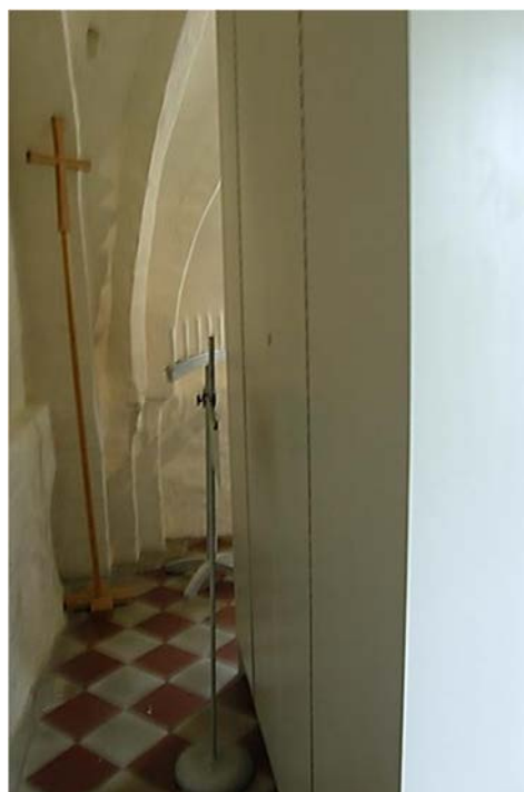
Det nya skåpet för textilförvaring.