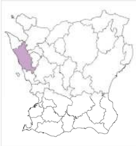
Skånekartan med Helsingborgs kommun markerad.