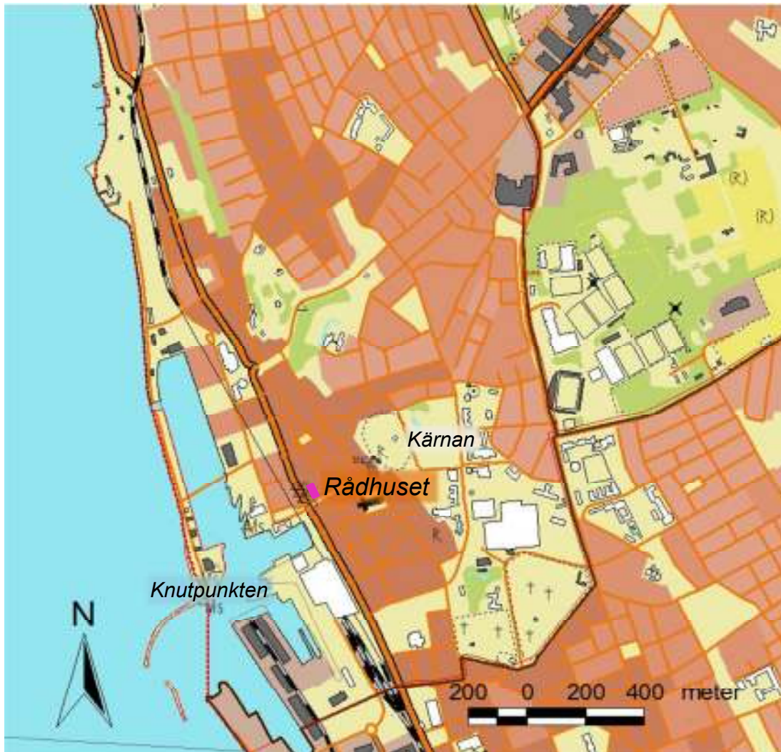
Helsingborgs rådhus ligger vid Stortorget mitt i centrala Helsingborg.