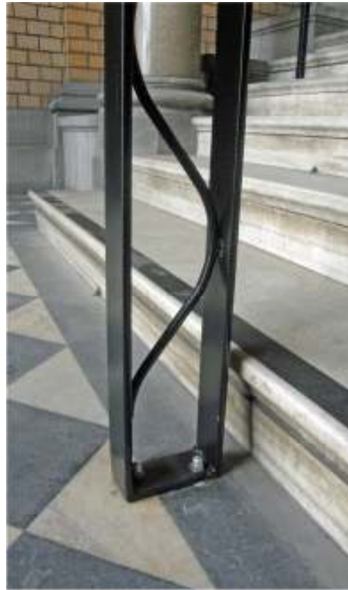
Nedre delen av trappan i västra trapphallen, före (ovan) och efter (nedan t v) montering av räcke. Nedan tb detalj av nedre delen av räcketts stolpar. Stolparna är fästa med bultar i hål i golvet och i trappstegen. Bultarna är numera svartmålade liksom stolparna i övrigt.