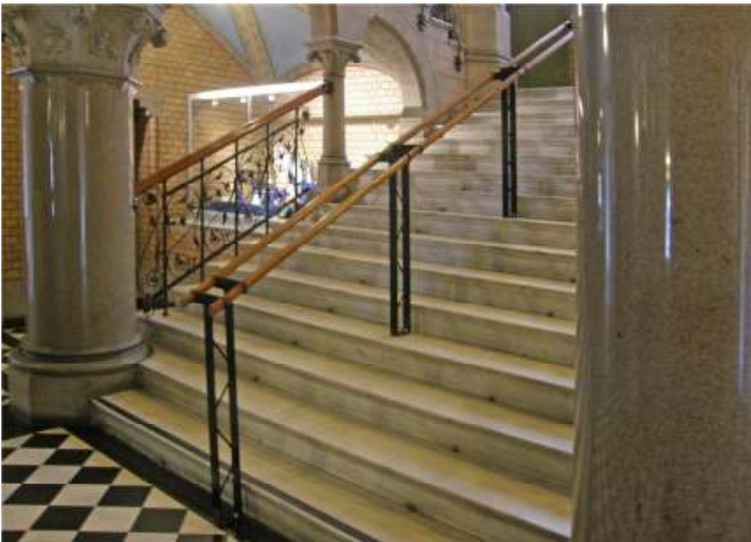
Del av trappa i västra trapphallen före (ovan) och efter (nedan) montering av handledare.