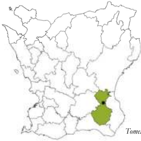
Tomelilla Kommun, Bondrumsgården ungefärligt markerad.