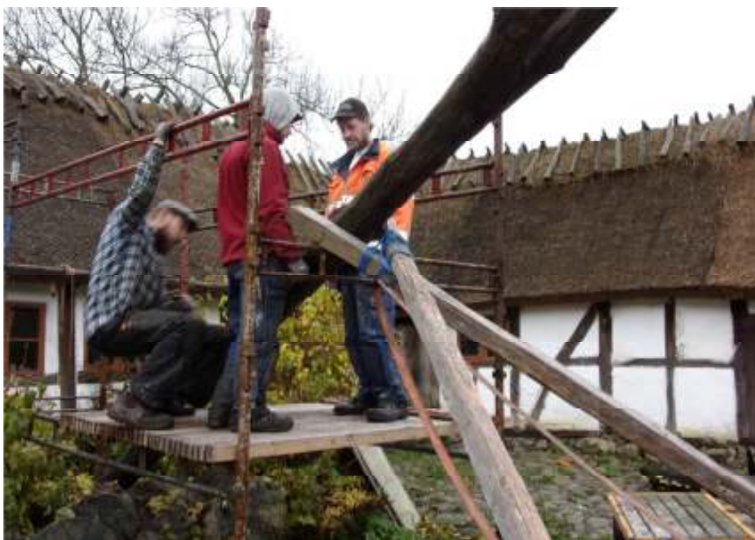
Fig. 7. Brönnljongens stolpe under uppresning.