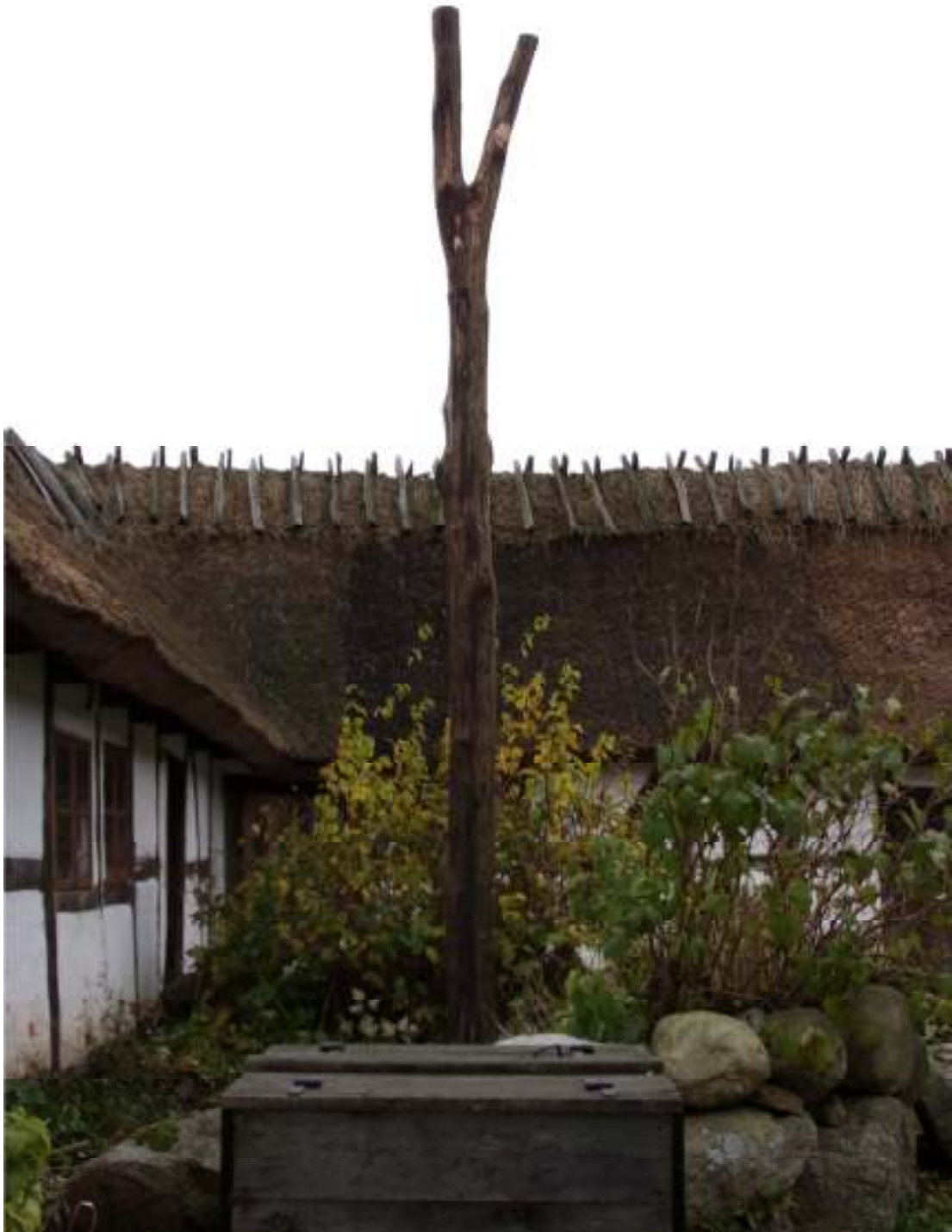
Fig. 8. Brännljongens stolpe på plats.