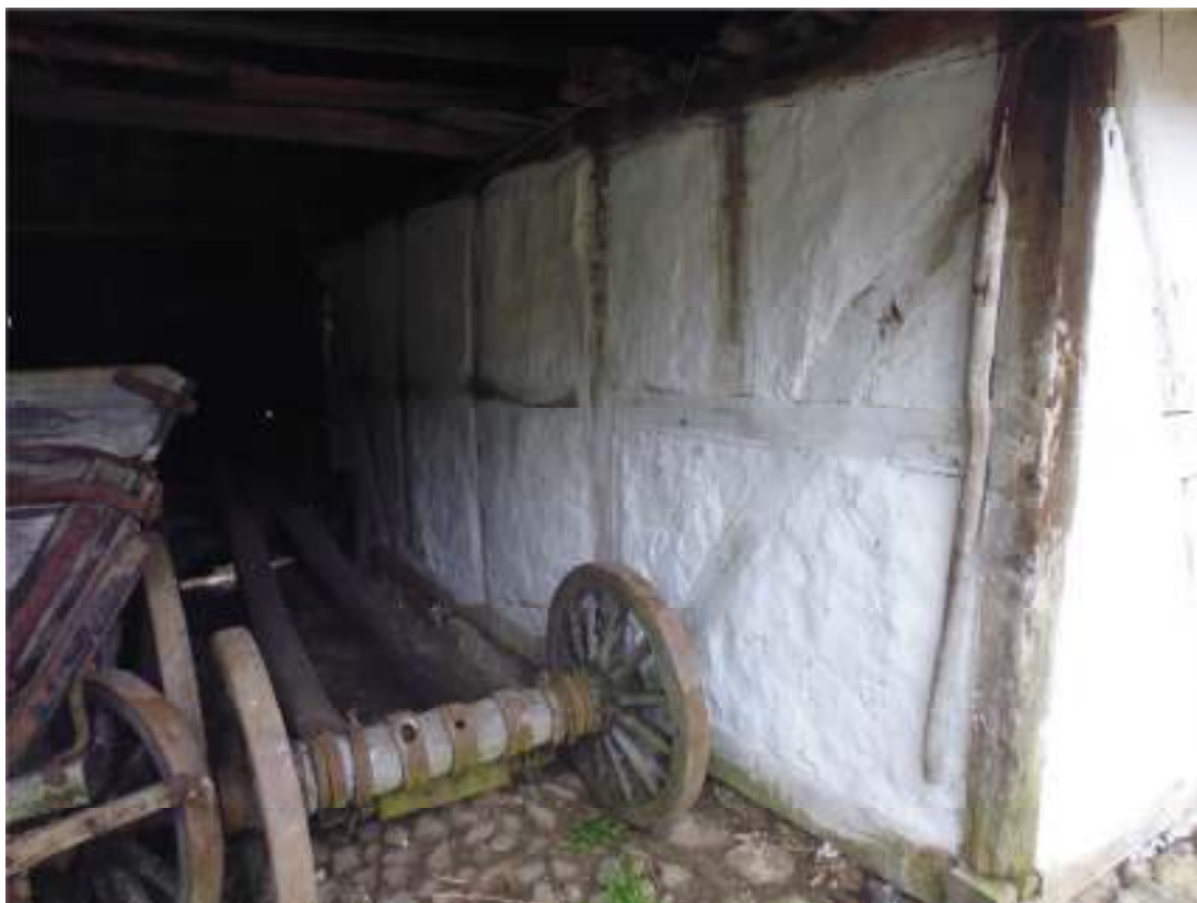
Fig. 1. Södra längans port, fackfyllningarna efter arbetet.