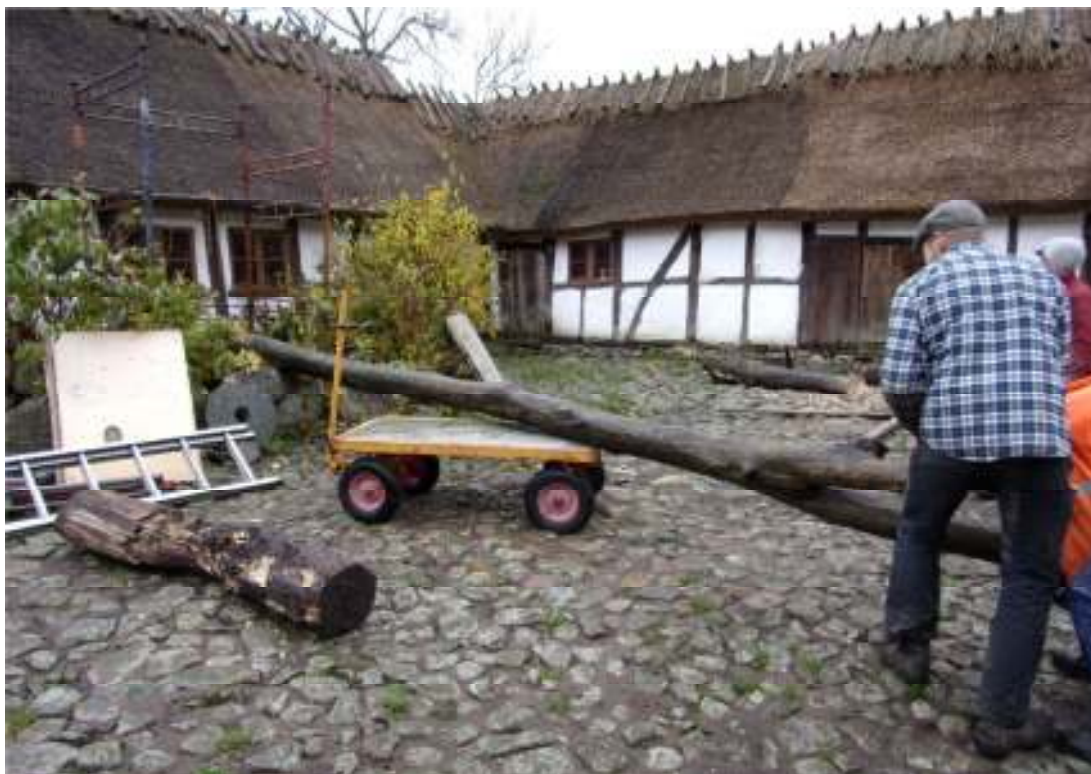
Fig. 6. Förberedelser inför uppresning av brönnljongens stolpe. Notera den upptagna trästumpen från den tidigare stolpen.