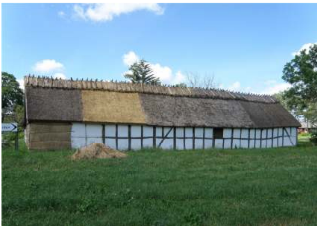
Fig. 3. Östra längans östra takfall, efter arbetet.