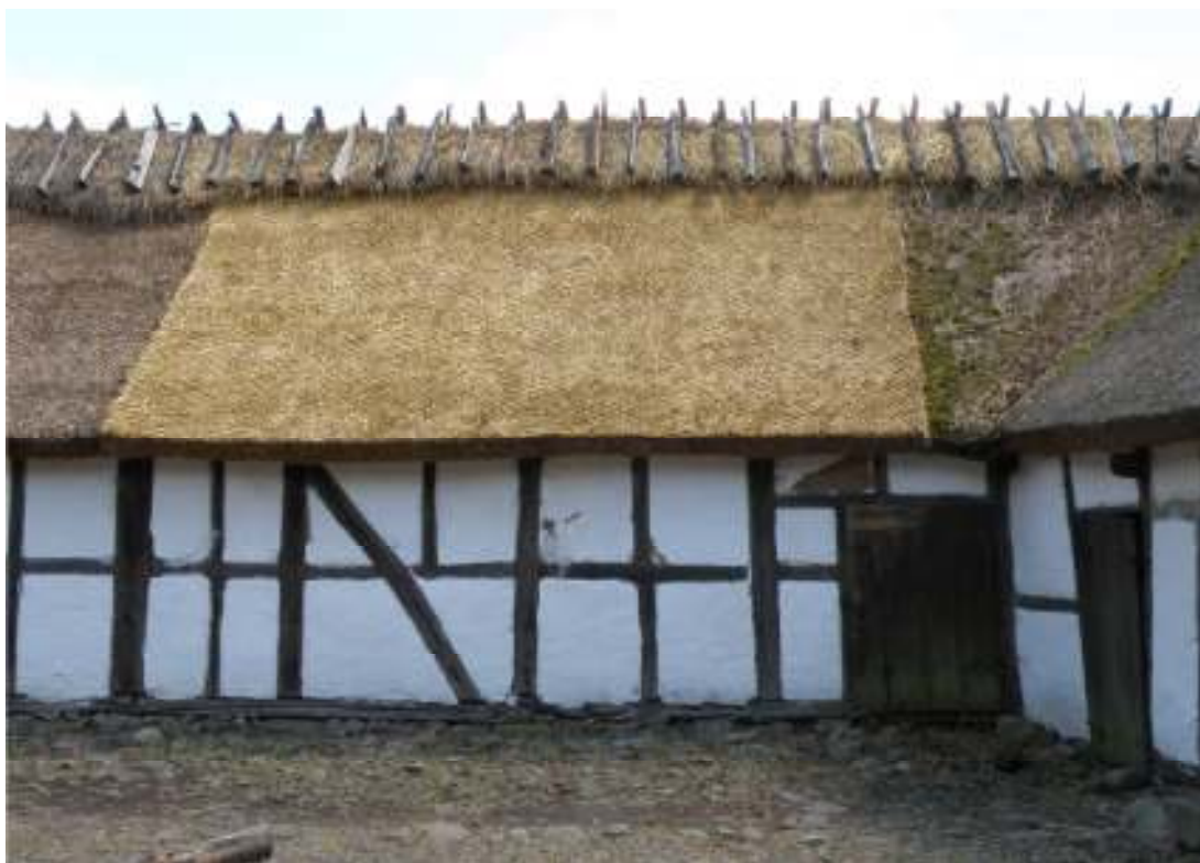
Fig. 2. Östra längans västra takfall, efter arbetet.