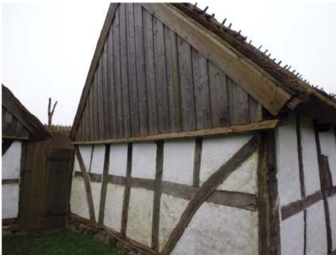
Fig. 5. Västra längans södra gavel, bytt vattbräda.