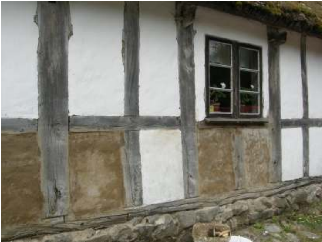
Fasaden vittad en gång.