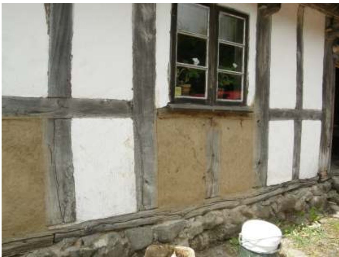
Under årets arbeten, två av facken med ny utfyllning innan vittning.