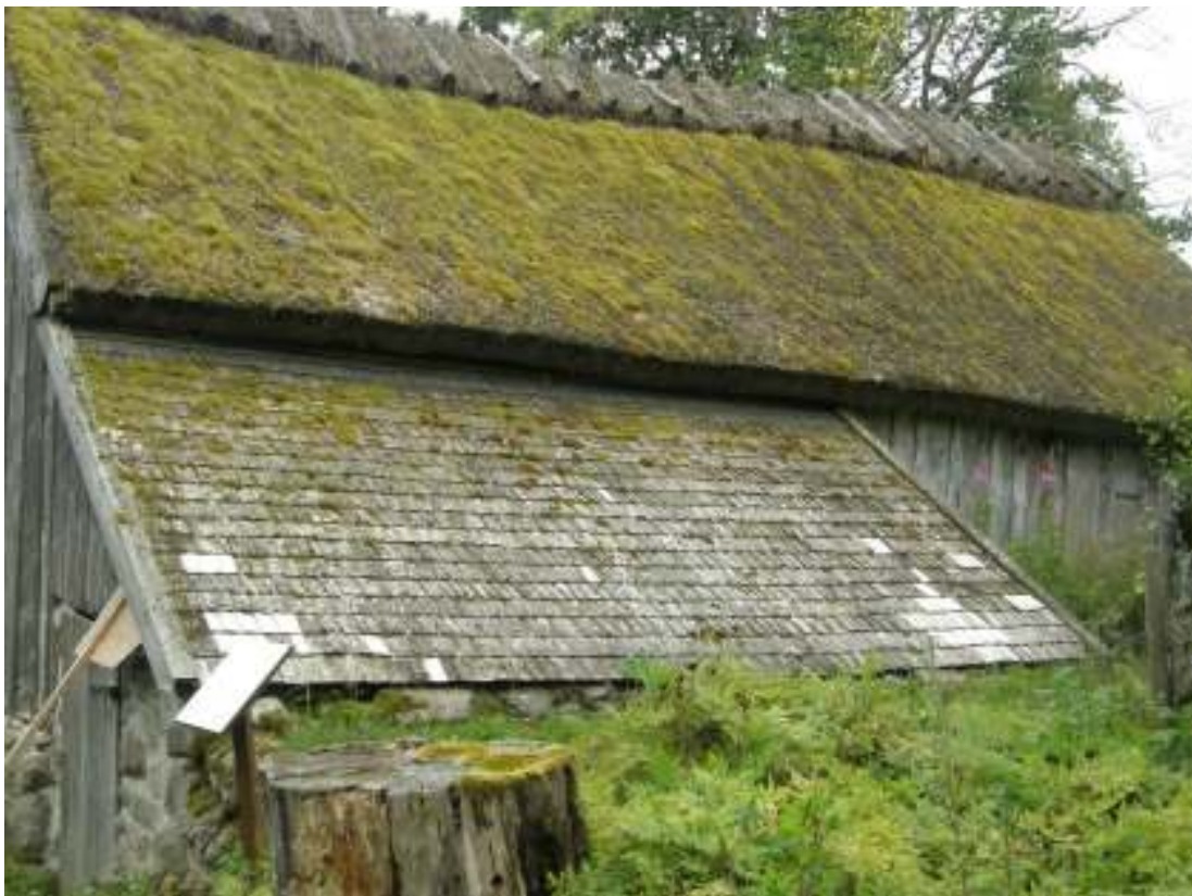
Sticketaket med lagningarna.