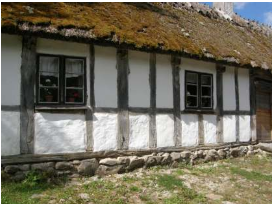
Fasaden vittad 4 gånger. Notera skillnaden i ytan mellan övre halvan i skuggan och undre halvan av väggen.