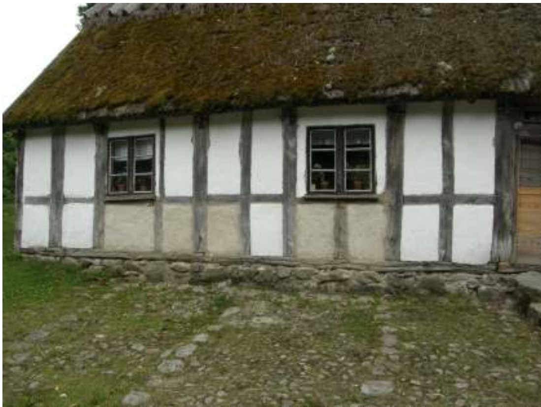
Alla fem restaurerade facken vittade 2 gånger