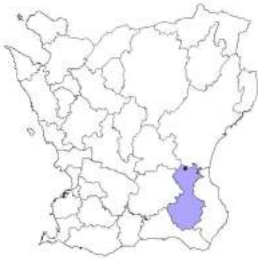
Tomelilla kommun. Agusastugan ungefärligt markerad.