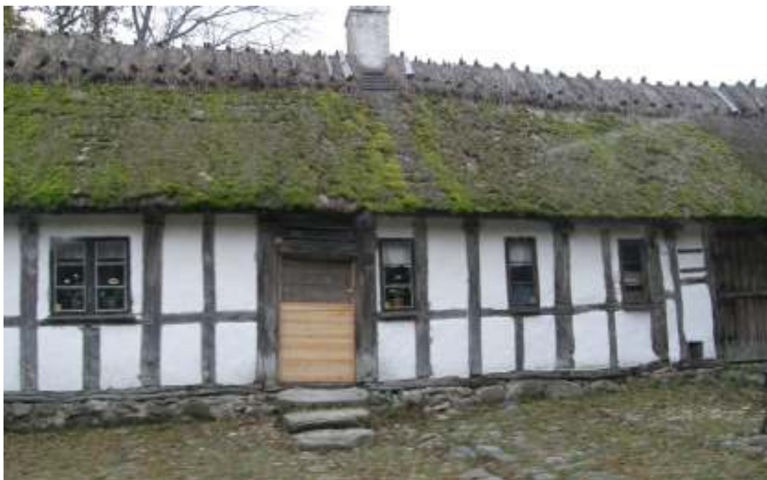
Östra fasaden innan årets åtgärder.