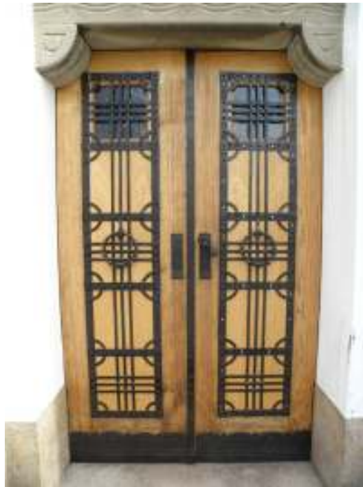
Västra torndörren skrapades ren, blektes med oxalsyra. Mittspeglarna av plywood byttes till nya skivor. Till höger syns dörren efter färdig renovering. Skrivhuvudena har inte målats ännu när bilden är tagen.