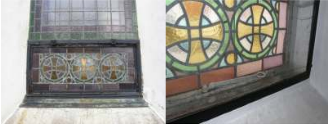
Fönster nr 1 vid norra korsarmens västra sida. Invändigt syns vädringshasp och låsbeslag. Ett innerfönster gör att man inte kommer åt att öppna ytterbågen från insidan längre.