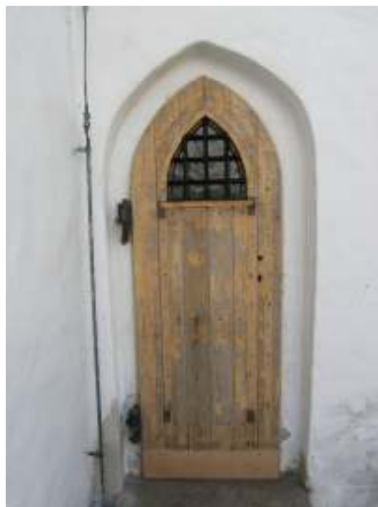
Norra torndörren före renovering (till vänster). Bilden till höger visar dörren efter infällning av ny bräda i nederkant där träet var murket.