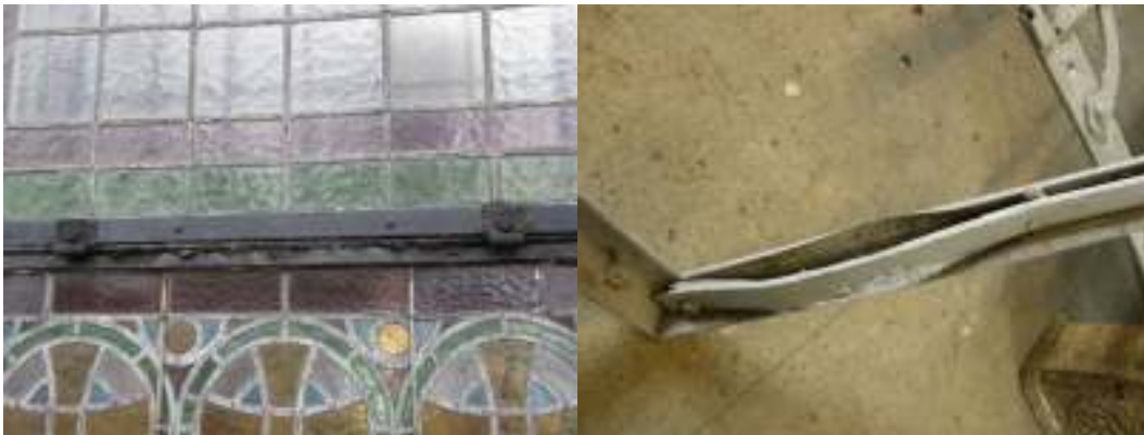
Fönster 1 var svårt angripen av korrosion. Till höger syns fönsterbågens konstruktion (efter blästring) med en L-formad profil och ett utanpåliggande fästskruvat järn som har hållit glaset på plats.