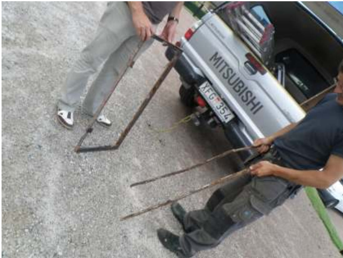
Fönsterbågen före blästring.