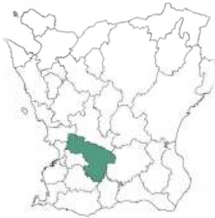
Vallkärra kyrka ligger i Lunds kommun.