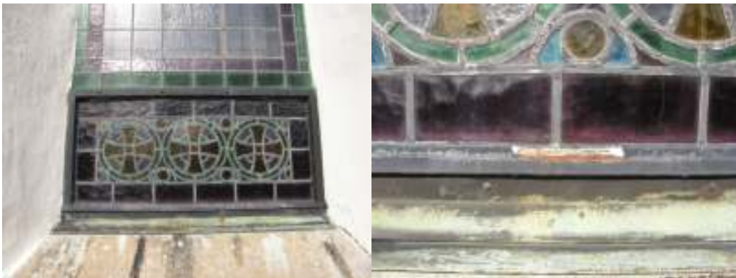
Den andra fönsteröppningen vid södra korsarmens västra sida. Det yttre järnet som håller fönsterglasets på plats har ersatts med en kittfals. Fönstret är inte längre öppningsbart och gångjärnet har plockats bort. Invändigt finns ursprungliga beslag kvar.