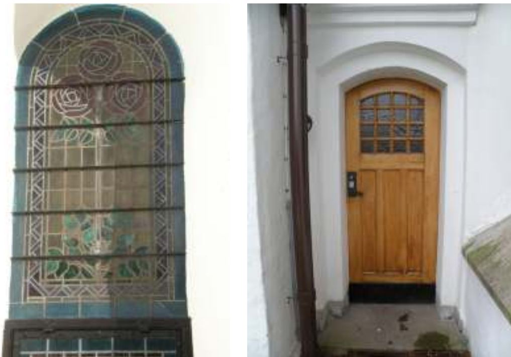
På grund av svårigheter att ta ned stormjärnen togs inte korfönstret ned för renovering som man tänkt utan detta renoverades på plats. Till höger syns torrdörren före renovering. Till höger syns norra dörren till sakristian efter slutförd renovering.