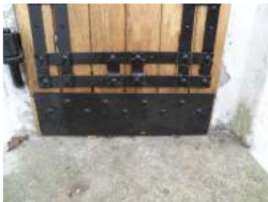
I den lilla fönsteröppningen lagades träramen kring fönstret på plats. Gallret togs inte bort utan renoverades likaledes på plats. Ovan syns dörrens nedre del efter återmontering av beslag.