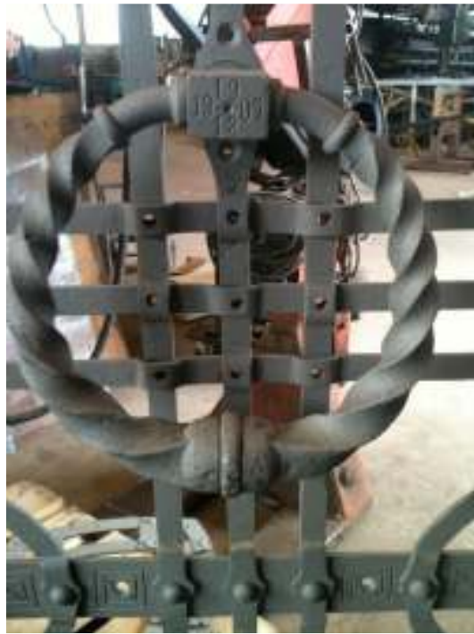
Västra porten före renovering. Beslagen togs ned, blåstrades och målades om. Till höger: Dekorativ bantagsring på västra porten märkt med datumet 19/12 1907. På baksidan av ringen fanns den diskreta märkningen Alfr. J. Rydahl Rydsgård.