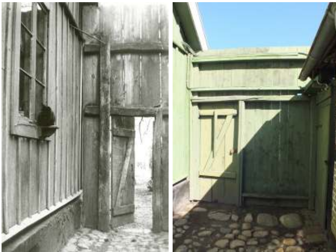
Planket mellan boningshus och brygghus på 1930-talet och t h som det såg ut år 2012. Notera färgsättningen på det svartvita fotografiet, allt var avfärgat i liknande kulörer, såväl panel som fönster.

gaveln som minne från den tiden. Hela planket, inklusive porten, ser ungefär likadant ut idag med överliggare och stolpar på insidan, men planket hade bredare dimensioner på brädorna och stolparna ser ut till att ha varit av ek. Alla delar har troligen bytts sedan dess och en extra överliggare har också tillkommit. När värmepumpen installerades för ett par år sedan ovanför dasset intill brygghuset förlängdes planket en bit så att värmepumpen inte skulle synas utifrån.