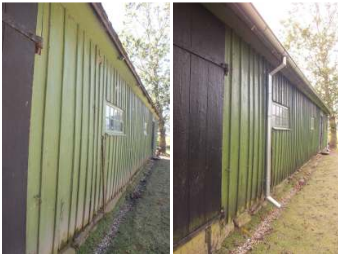
Stallets västra fasad där nya hängrännor och stuprör i galvad plåt satts upp.

Fodren avfärgades enligt befintlig färg med linoljefärg i kulören zinkvitt från Ottossons färgmakeri. Alla fönster, inklusive verandans fönster, kompletterades med nytt linoljekitt där det behövdes varefter de och gårdssidans dörrar avfärgades med samma färg och kulör som sist, med linoljefärgen Bladgrönt från Allbäck linoljeprodukter AB. Den bladgröna kulören har NCS-kod 7010-G30Y.