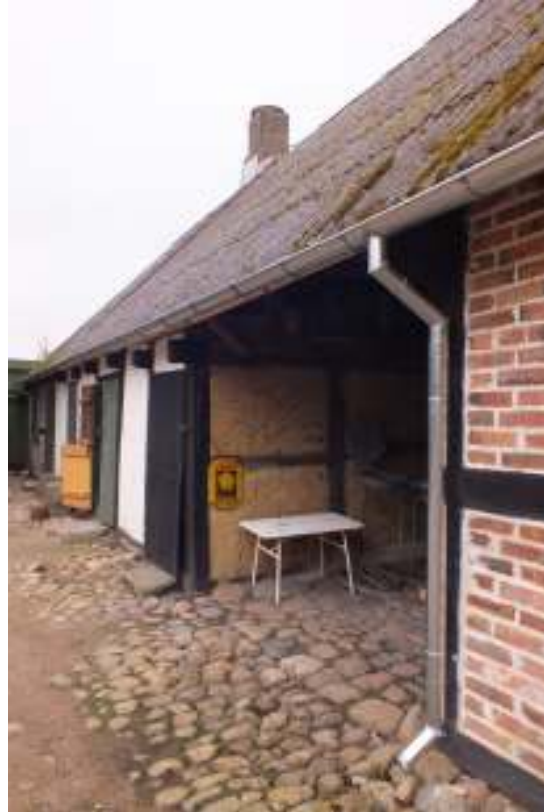
Brygghus- och loglängans avvattning byttes och förlängdes med ny hängränna och nya stuprör längs hela sidan.