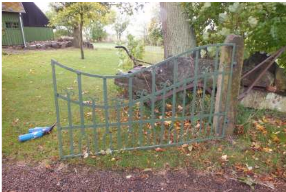
Den ena grinden sedan den satts på plats och målats.

sluten. Trädgården utanför boningshuset kunde vara omgärdad av stengärde, häckar och träd men inte ha grindar.