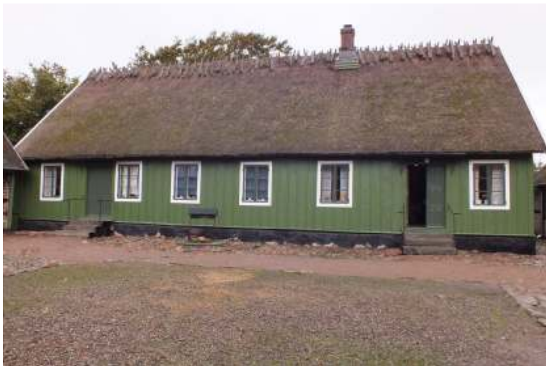
Boningshuset efter att hela fasaden, vad gäller panel, fönster, dörrar och foder, målats i oktober 2012.

Boningshusets fasad avfärgades år 2006 och samtidigt byttes en del av den äldre locklistpanelen som är av hyvlade bräder i varierade dimensioner. Även dörrar, fönster och foder avfärgades år 2006 och samtidigt lagades fönstren med nytt kitt och tre fönster fick nya foder. Dörrarna till de båda gårdsentréerna och samtliga fönster på gårdssidan nyttillverkades likt de gamla i slutet av 1980-talet. Panel och fönster var före renoveringen avfärgade i grönt medan foder och vindskivor var vita. Fasaden var målad med en akrylatfärg av fabrikatet Cuprisad . Färgspår och äldre foton visade att fönsterfoder en gång varit avfärgade i samma gröna färg som fasaden. En del äldre foton visade också att fönstren varit målade i en mörkare kulör. Enligt färgspår på gårdssidans dörrfoder har dessa förr varit både gröna och mörkt blågråa. Före renoveringen var finingångens foder grönt medan köksingångens var vitt.