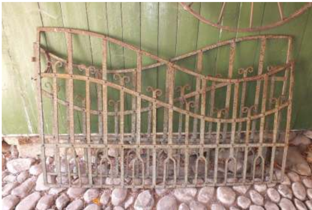
Grindarna som de såg ut före uppsättningen.

Över porten till logen sattes en fotränna i stället för hängränna. Takutsprånget är litet och porten går ända upp till lejden varför en hängränna inte fick plats. Porten som öppnas utåt hade inte gått att öppna om man satt upp en hängränna.