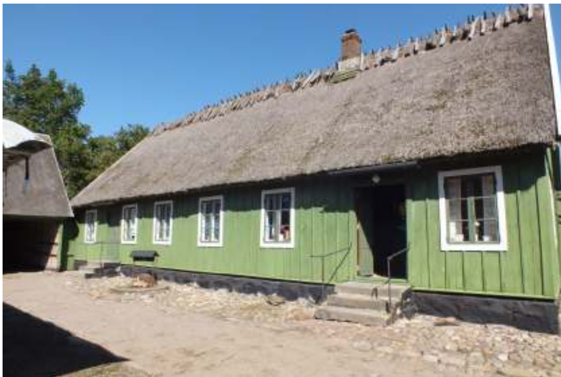
Boningshusets gårdssida före målning, augusti 2012. T b skymtar planket med porten som bytts i gattet.