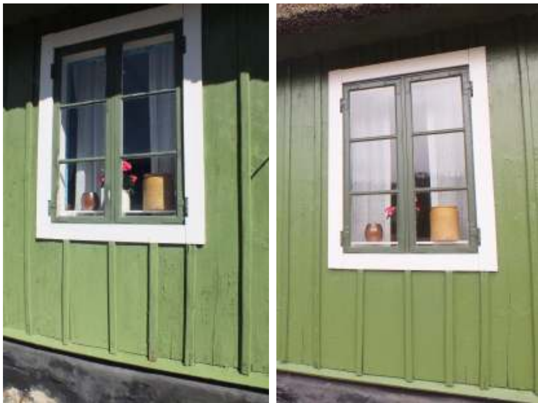
Boningshusets södra fasad, gårdssidan, före och efter målningen. På bilderna ses fönstret till köket. Panelen under fönstret byttes vid förra renoveringen.