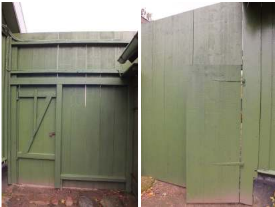
Planket efter renoveringen, t v sett från gården och t h från trädgården. Planket och portens brädor och narar är bytta i sin helhet.