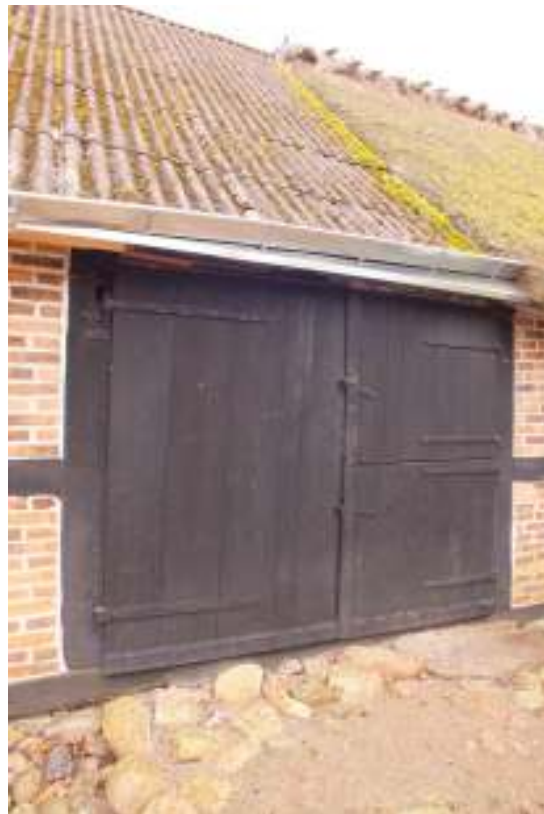
Läktena förstärktes för krokarna till hängrännor, t v. Över porten t h sattes fotränna i stället för hängränna.