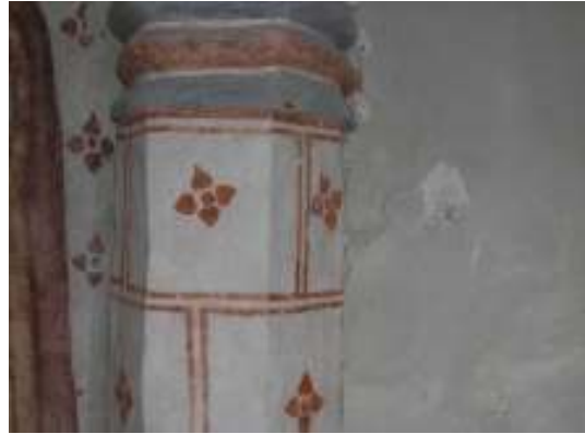
Bild t.v.: I koret på norra sidan fanns spår efter medeltida målningar. Färgspår och putslager har dokumenterats och analyserats av konservator för att sedan på varsamt sätt lagas i och bevaras på plats. Bild t.h.: Partier av kalkmålningar togs fram under 1950-talet men korets innersta väggar är i dag fortfarande helt vitmålade. Kanske kan målningar undersökas närmare i framtiden då ickeförstörande metoder finns att tillgå?