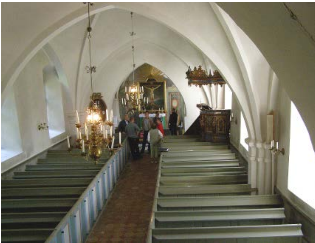
Bild: Hässlunda kyrkas långhus mot öster före restaureringens påbörjan. Kyrkorummets karaktär härrör huvudsakligen från de stora restaureringar som skedde dels på 1860-talet och dels på 1950-talet. Vid 1860-talets restaurering omgestaltades långhuset från att ha varit tvåskeppigt till att täckas av dagens vida, något slacka valv. Stora delar av kyrkorummets inredning härrör även den från 1800-talet, dock från dess första årtionden. 1950-talets restaurering präglar kyrkorummets färgsättning och genom de framtagna kalkmålningarna i koret.