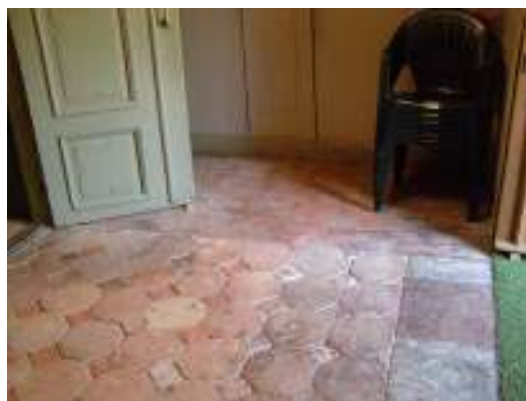
Bild nederst t.h: vapenhusets golv innan arbetenas påbörjan med tegelplattor av olika färg och format. Efter arbetena är golvet täckt av sexkantiga plattor med mellanliggande kvadratisk platta, alla från Horns tegelbruk.

Bild överst t.h: Rödmålat gjutet betonggolv under norra bänkkvarteret i långhuset. Golvet har bilats upp och ersatts av ett uppreglat plankgolv.