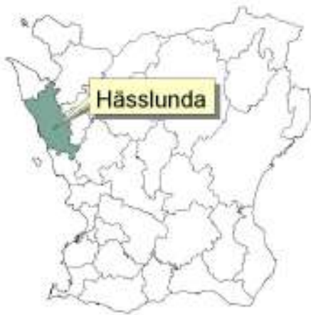
Skånekartan med Helsingborgs kommun och Hässlunda markerade.