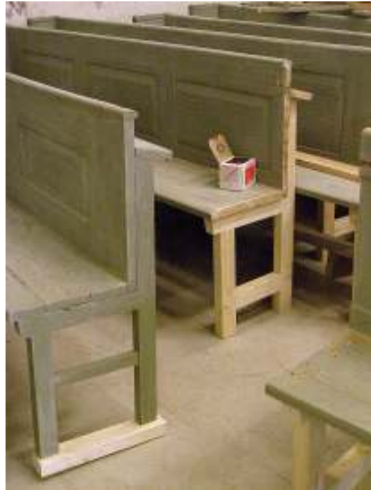
Bild t.v: Skada i en av bänkinredningens dörrar. Liknande skador fanns i fotbrädor, stödben och bänksitsar.