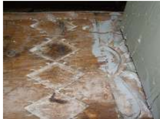
Bild t.v: Fragment av ett äldre tegelgolv påträffades på flera håll i långhuset i samband med golvarbetena. Fragmenten undersöktes av arkeolog och lämnades kvar under det nya golvet.