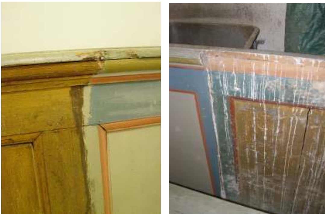
Bild t.v.: På baksidan av en av bänkinredningens skärmar återfanns en av de två ådringsmålningar som kyrkans inredning tidigare haft. Bild t.h.: På baksidan av en annan av skärmarna återfanns en ännu äldre färgsättning, troligen från 1800-talets första årtionden, med kraftigt rött listverk, ockragula speglar och blågrönt ramverk. Det är denna färgsättning som låg till grund för 1957 års färgsättning av bänkinredningen.

I samband med reparationsarbetena gjordes en dokumentation av bänkinredningen där bland annat äldre bemålning framkom på baksidan av de främre bänkskärmarna. Den äldsta bemålningen som man vid restaureringen 1957 utgick ifrån vid ommålningen av bänkarna har speglar i en mustig gul kulör (troligen ockra), listverk i kraftigt rött (troligen bränd terra) och ramverk i en blå-grön kulör. Den färgsättning som skapades 1957 är dock mycket blekare i kulörerna än förlagan med beigegråa speglar, rosa lister och dovblå ramverk. Däremot återkommer den kraftiga gula kulören från speglarna på överliggarens pärlstav. Spår av två olika ådringsmålningar påträffades också, den äldsta i en ljus ekimiterande nyans och den yngre i mörk mahogny. Däremot påträffades inga spår av gulduppläggning.