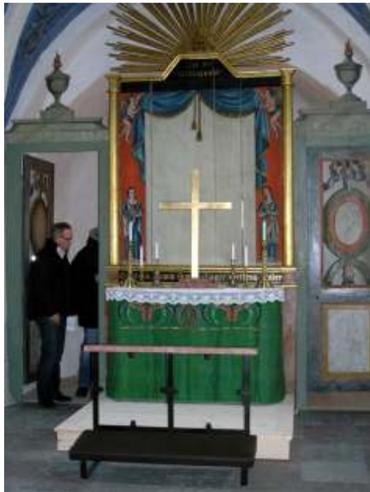
Bild t.v.: Korinteriör före renoveringen. Golvet är belagt med kraftigt vittrat kalkstensplattor och förhöjt, tegelbelagt golv innansför altarringen. Den gamla altarringen från år 1864 demonterades och kasserades dels p g a rötskador och orangrepp och dels på önskemål från församlingen om ett mer flexibelt kor med ett mindre knäfall. Altarmålningen togs ned för att spännas och rengöras. Bakom återfanns en mycket välbehållen målning som endast behövde ytrensas.

Bild t.h.: Koret efter renoveringen med den nygamla altartavla och det nytillverkade knäfallet. Träet i avsatsen framför altaret är på bilden obehandlat men ska målas in i en mörk grå färg, likt omgivande kalkstengolvet. Delar av korgolvets kalkstensplattor gick att återvända och lades längs med väggen. Resterande golyta kompletterades med nya patinerade plattor för att likna de befintliga och lades i ett liknande mönster. Det guldfärgade korset på altaret är ett provisorium i väntan på ett krucifix.