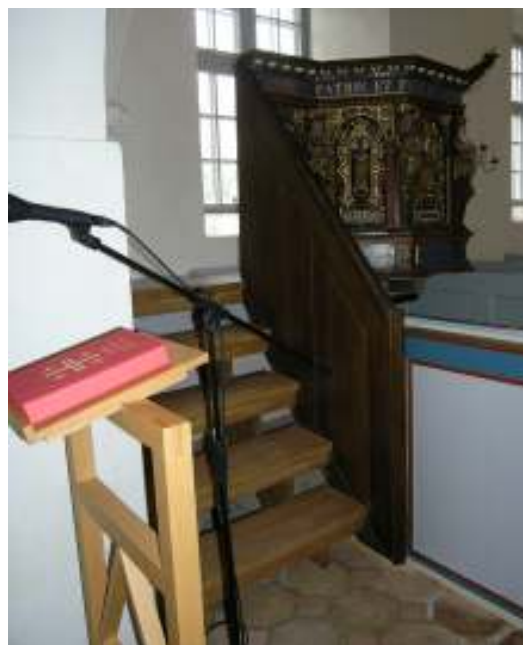
Bild t.v. Nytt textilskåp placerat i södra läktarunderbyggnaden. Bild t.h. Ny trappa till predikstolen.