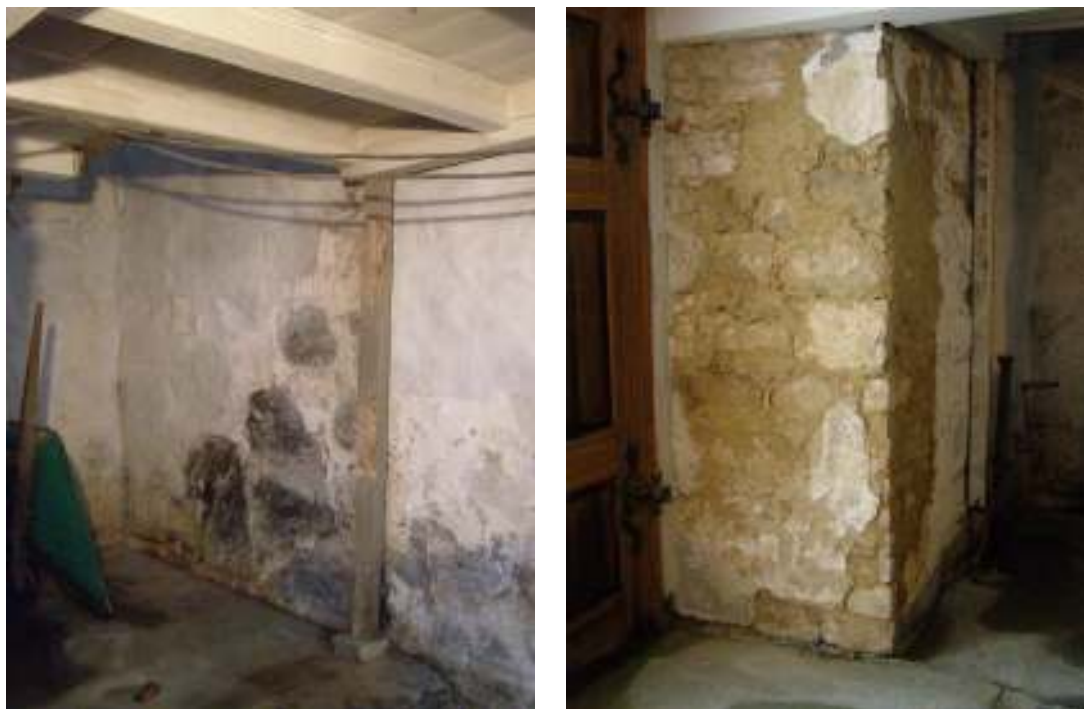
Bild t.v: Tornets norra mur efter friläggande i samband med hussvampssanering.