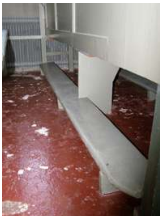
Bild överst t.v: Under långhusets bänkkvarter har uppreglade trägolv lagts. Inget organiskt material vilar mot den underliggande sanden.

Bild överst t.h: Rödmålat gjutet betonggolv under norra bänkkvarteret i långhuset. Golvet har bilats upp och ersatts av ett uppreglat plankgolv.