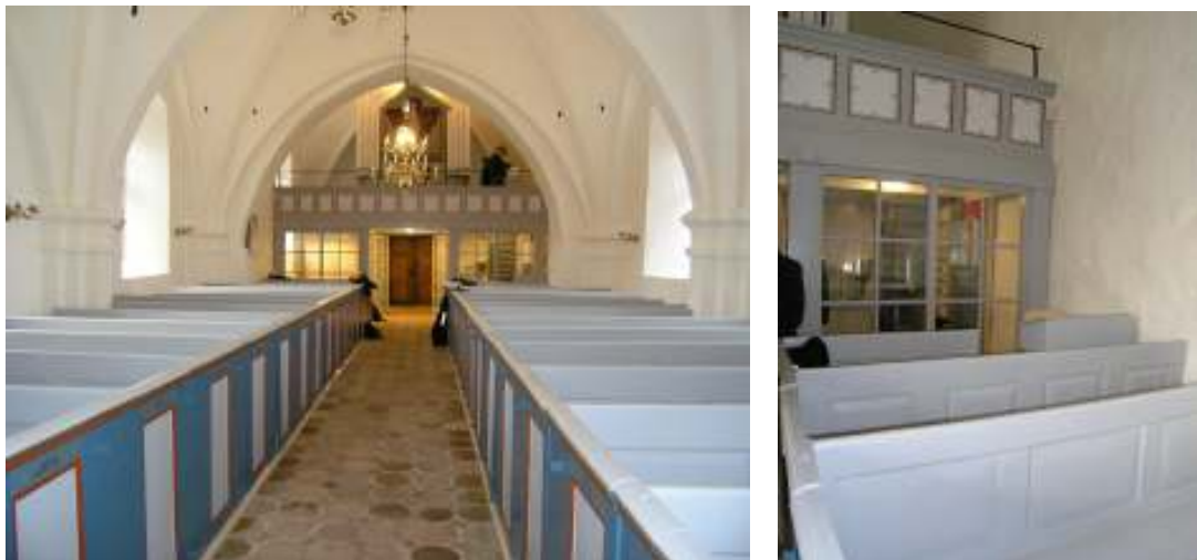
Bild t.v: Vy mot orgelläktaren i väst efter renovering. Två glasade rum har byggts in under läktaren. Nytt tegelgolv har lagts i mittgången och bänkkvarteren har målats om i en färgsättning likt den befintliga.

I samband med renoveringsarbetet har värmepump installerats i övre våningen i det sk apparatrummet (fd bårhuset).