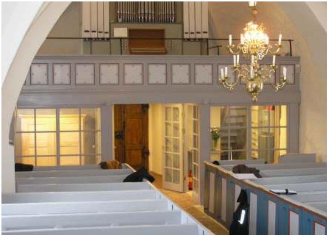
Kyrkorummets västra del efter renoveringsarbetena med de två mindre, inglasade utrymmen under läktaren.

I tornet upptäcktes under arbetenas gång ett inaktivt angrepp av äkta hus-svamp i brädväggen längs tornrummets norra sida och den därinnanför liggande trappan upp till orgelläktaren. Brädväggen och trappan togs bort och virket brändes. Intelligande putsytor högs ner och behandlades med Boracol innan de återigen putsades med kalkbruk. Det frilagda murverket dokumenterades i fotografi och text, se rubrik Iakttagelser under arbetena .