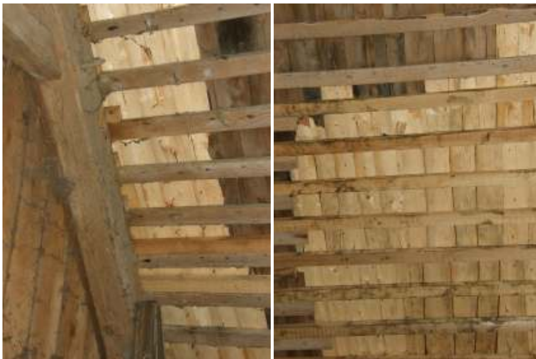
Det lagade sticketaket vid södra gaveln