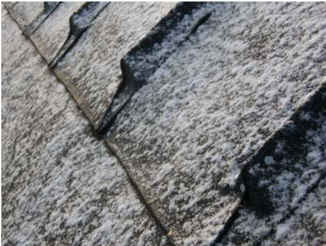
Taket är klart, trekantslister med snö