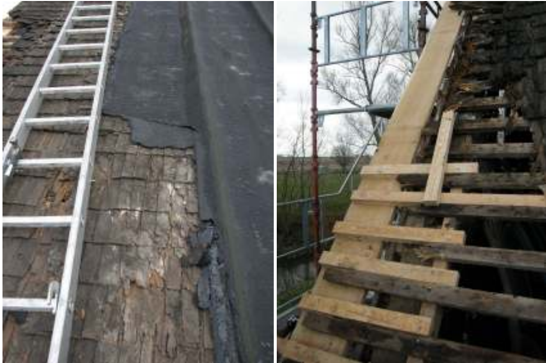
Det skadade sticketaket frilagt