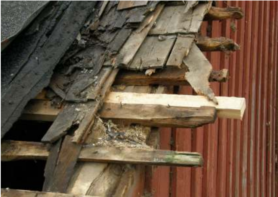
Skador vid södra gaveln

verktyg för omhuggning av stenarna. Kvarnen ligger vid Saxån och har en väl bevarad kvarndamm. Gårdsmiljön består, förutom kvarnbyggnaden och dammen, av ett äldre bostadshus, en sentida uthuslänga samt en stallbyggnad från 1930- eller 1940-talet.