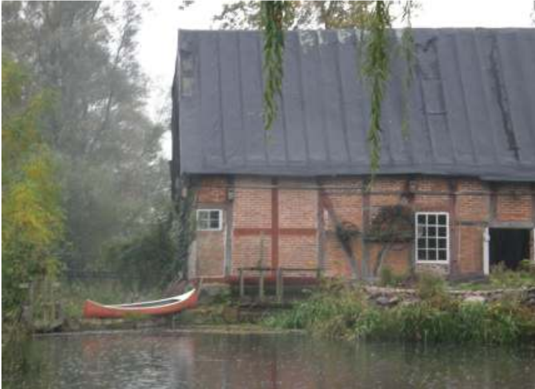
Kvarnbyggnaden sedd från öster innan takreparationen