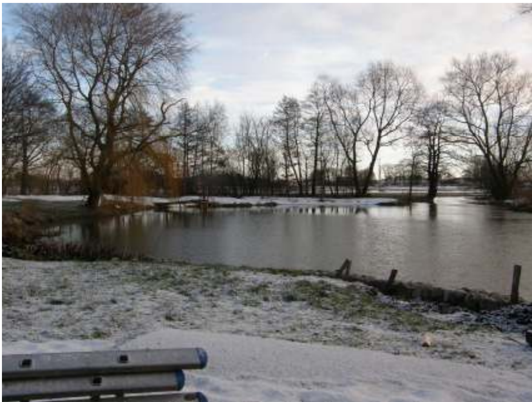
Kvarndammen en bitande kall januaridag