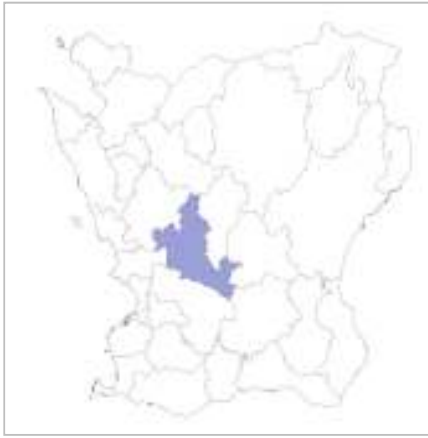
Reslöv ligger i Eslövs kommun