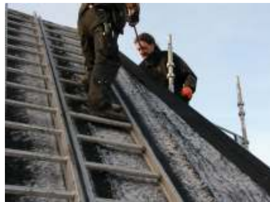
Västra takfallet, utseende som innan renoveringen Remsor över trekantslist