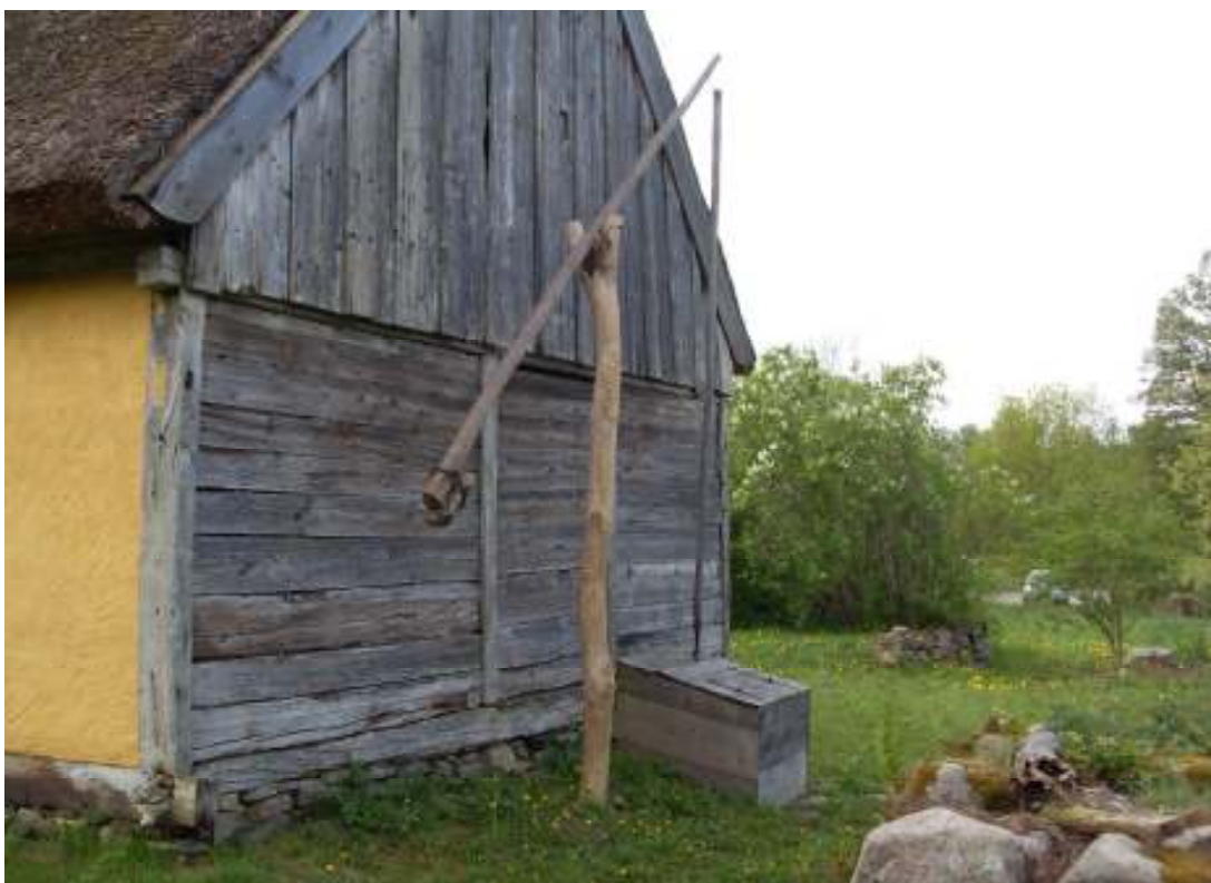
Brunnsvängeln, efter arbetet.