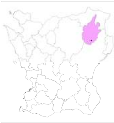
Östra Göinge kommun, gårdarna Ballingstorp och Per-Ols ungefärligt markerade.