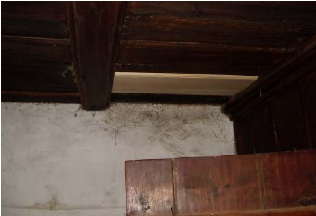
Förstugans innertak, bytt takpanel.