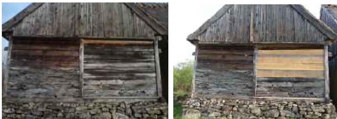
Ballingstorp. Södra stallgaveln före och efter arbetet. Notera det avfasade fotträet.