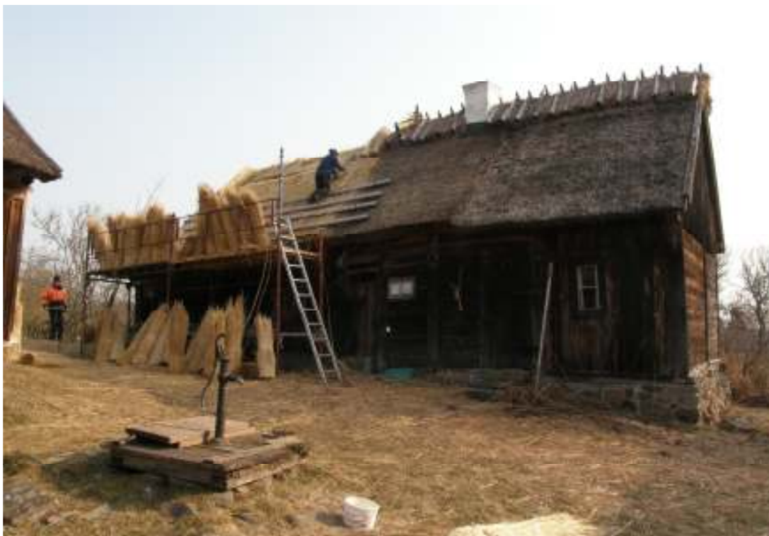
Brygghuset, västra takfallet, under arbetet.