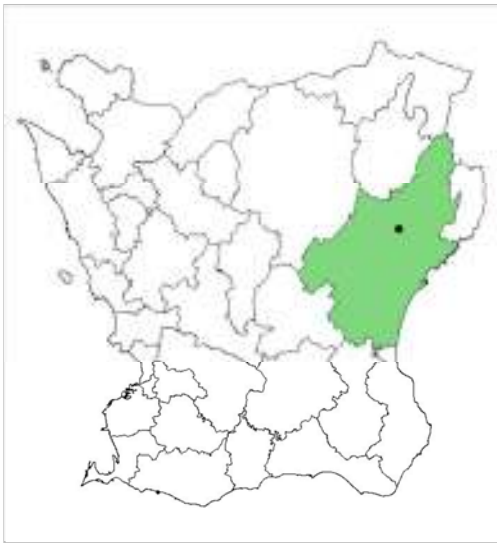
Karta över Skåne län med Kristianstad kommun grönmarkerad och Nosaby ungefärligt markerat med svart prick.