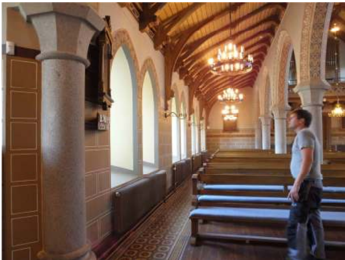
Den övre bilden visar södra delen av långhuset efter färdigställd rekonstruktion, den nedre bilden visar den norra delen.