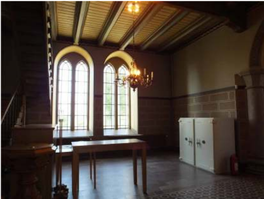
Den övre bilden visar väggytan under trappen i norra sidoskeppet med saltutfällningar, försök har gjorts att retuschera ytan men sannolikt är det bättre att acceptera utfällningarna. Den nedre bilden visar södra korsarmen efter färdigställd rekonstruktion.