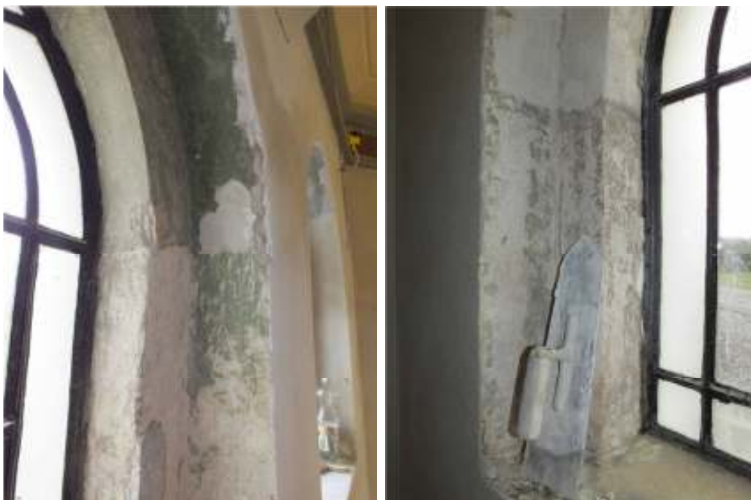
Färgspår i fönsternischerna i sakristian. Två gröna kulörer och en brun återfanns i olika omfattning. Färgsättningen har inte återskapats utan omkalkning har skett enligt arbetshandling.

Väggarna i sakristian var innan projektets start målade i en vit, täckande färg och en träpanel täckte den nedre delen av väggarna till cirka en meters höjd. Träpanelen var modern och har enligt församlingen tillkommit under 1990-talet. I utrymmet har man haft stor fuktvandring i väggarna vilket påverkat panelen negativt, även om den monterats på läkt med flera centimeters luftning mot ytterväggen. När medverkande antikvarie besökte platsen första gången hade den till största delen redan monterats ner och församlingen fick länsstyrelsens tillstånd att inte återmontera den. Hösten 2013 revs lös puts respektive sentida ytskikt i sakristian. Det visade sig att sakristian redan tidigare varit omputsad till hög bröstningshöjd, cirka två meters höjd. Vissa partier av väggarna var tidigare lagade på ett flertal ställen. Det kunde iakttas att gesimsen mot koret delvis är gjuten med mycket grov cement. Dekorationsmåleriet är på dessa ställen klumpigt kompletterat.