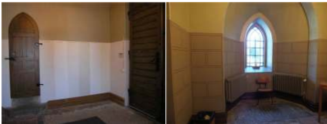
Bilden till vänster visar provmålning med olika färgtyper i vapenhuset som gjordes 2012. Bilden till höger visar den norra väggen i vapenhuset efter att målningsrekonstruktionen färdigställts.

År 2011 revs putsen på vapenhusets väggar, från bröstningslinje vid cirka två meters höjd och nedåt. Den rivna putsen har i huvudsak varit kalkputs i olika kvaliteter. De ytor som varit i behov av större lagningar i detta skede visade sig ha varit lagade redan tidigare. Den nu rivna ytan motsvarar den yta som varit bemålad med kvaderimitation samt fönsternisch. Väggarna har putsats om med kalkbruk fin från Målarkalk.