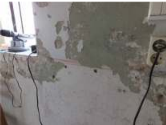
Bilderna visar väggytorna när puts-skikten delvis rivits. Vänstra raden ovanifrån och ner: den södra korsarmen, södra delen av långhuset, sakristians vägg åt väster samt del av underliggande ytskikt i sakristian. Högst upp till höger har lös puts knackats bort och underliggande kulörer framkommit i södra korsarmens fönsternischer. Nedre bilden till höger visar en av sakristians väggar efter rivning av ytskikt.