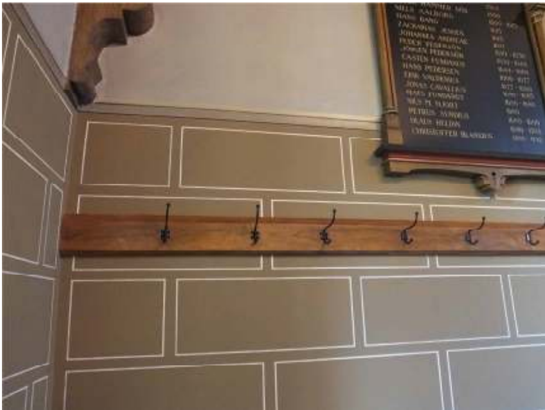
Utblick över kyrkorummet västerut från koret efter färdigställd rekonstruktion. Nedre bilden visar klädhängare där ådringsmålningen förnyats.