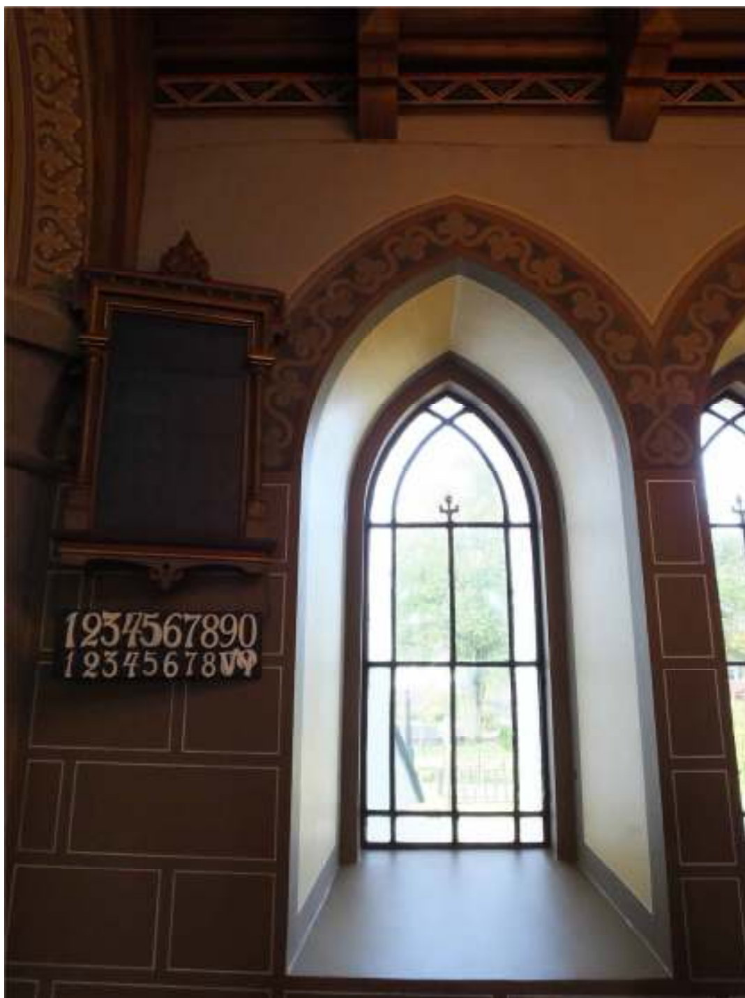
Rekonstruerat målningsparti i nordost. Här syns även ett av de målade fönsterglasen.