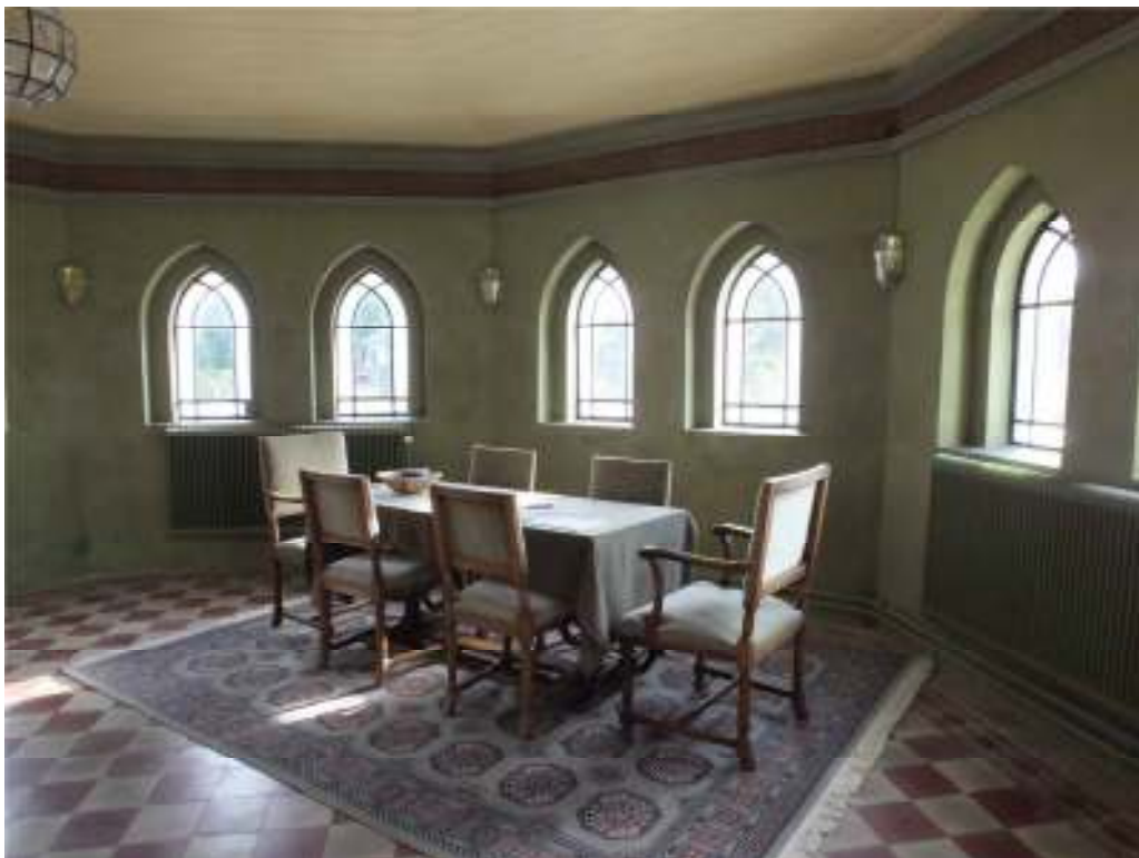
Den övre bilden visar en utblick över kyrkorummet från väster mot koret. Den nedre bilden visar sakristian efter färdigställd rekonstruktion.