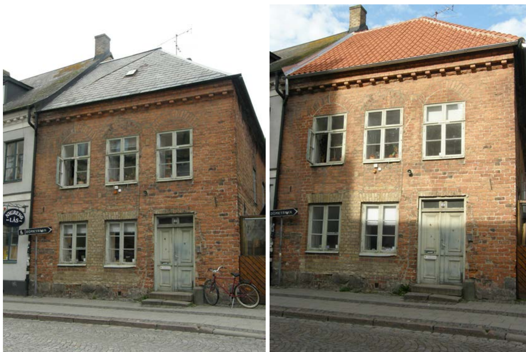
Fru Görvels hus, den östra fasaden mot Stora Södergatan, t.v. före renoveringen i augusti 2008 och t.h. ett år senare.