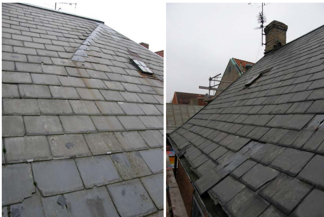
T.v: Skiffertaket vid gradsparren på den östra valmade gaveln. T.h. ses nedfallna skifferplattor på det norra takfallet.