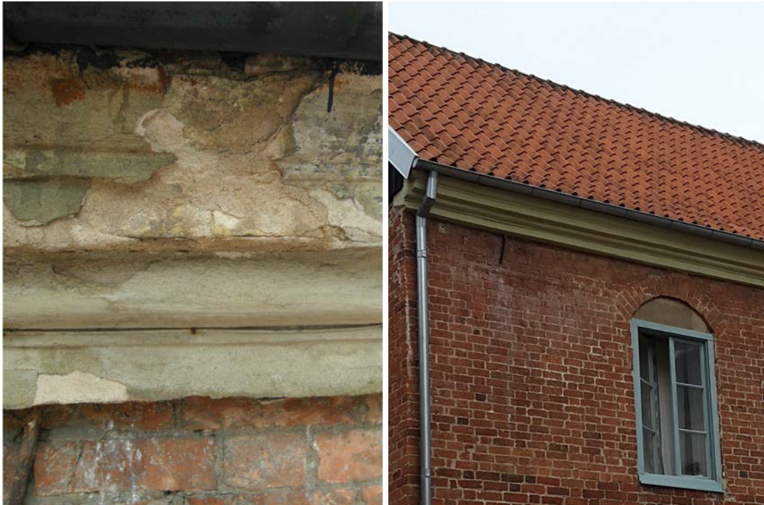
Gesimsen (t.v. före och t.h. efter) lagades med hydrauliskt kalkbruk och avfärgades med grågrön kalkfärg.

Det fanns några takfönster i gjutjärn, två på vardera takfall åt norr och söder samt ett på östra gaveln. Fönstren togs bort, dels på grund av att de inte behövdes då vinden inte används till något och dels ville man minska risken för läckage.