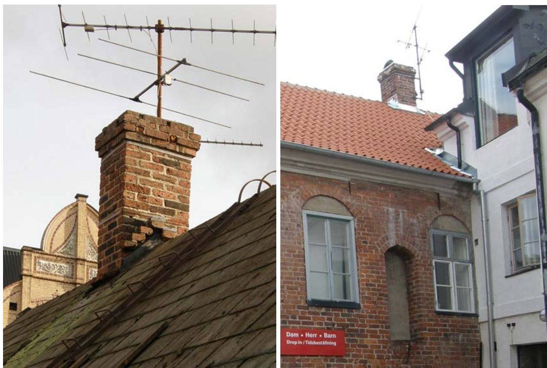
Skorstenarnas nedre utkragning togs bort, lagades i med bruk och skoningen utfördes med galvad plåt som frästes in i teglet.

Byggnadens två skorstenar är murade i tegel med utkragning både upptill vid kronan och nertill över nock. De nedre utkragningarna sågades bort på grund av att plåtningen inte kunde utföras med de dimensioner som krävs. Med tegeltaket byggs dessutom taket på, jämfört med det tidigare taket, vilket gjorde det omöjligt att utföra plåtarbetena på skorstenarna. Lagningen utfördes med bruk varefter infräsning för plåten gjordes. Skorstenarna försågs med bågformade skydd i galvad plåt.