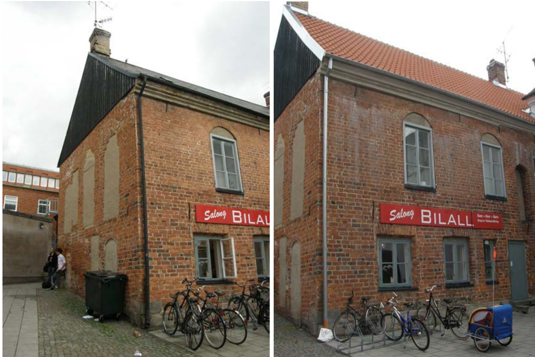
Den västra gaveln och södra sidan vetter mot gården, t.v. före takomläggningen och t.h. efter. Takgesimsen putsades om på den södra sidan.

Den nuvarande takstolen har troligtvis tillkommit under 1800-talet varefter taket mot det i söder angränsande husets gavel har rests. På ett foto från 1924 som är publicerat i boken Gamla Lund i Per bagges bilder är taket valmat och belagt med tegel. På ett annat foto från 1929 i samma bok har taket fått skiffer. På båda bilderna är huset putsat. En rest av den forna putsfasaden kan ses på gårdssidan där gesimsen fortfarande är putsad. På tegelfasaden kan man än idag uppe vid taknocken skönja puts- och färgrester. Av resterna att döma har fasaden varit avfärgad i gult. Det finns flera förändringar i murverket och stora igensättningar som är överputsade, framförallt på den västra gaveln.