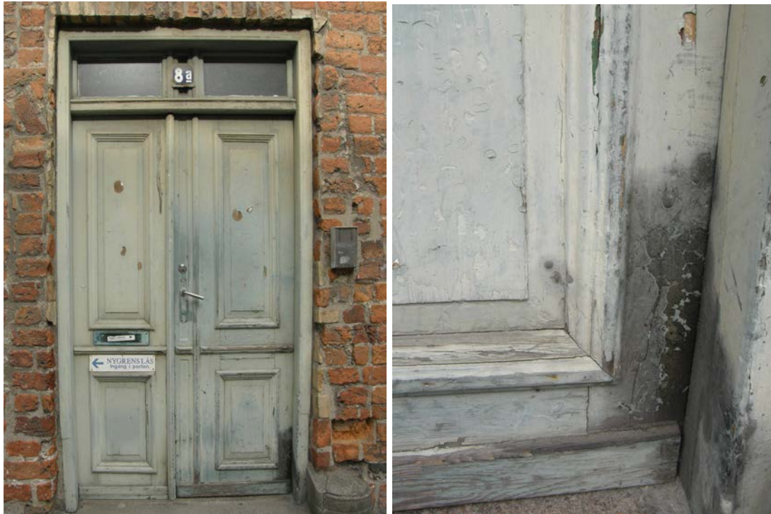
Dörr och fönster på den östra fasaden avfärgades med oljebaserad färg i en snarlik kulör. Färgpigmenten på de grönmålade snickerierna hade kritats och blekts väldigt mycket, den nya färgen blev något mörkare. Bilderna är tagna före målning.