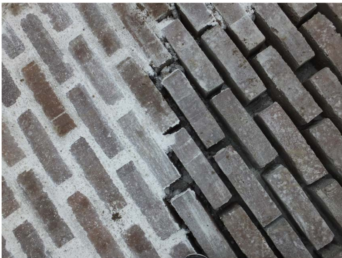
Den yttersta metern av dammen där stenarna är murade med ett cementbruk.