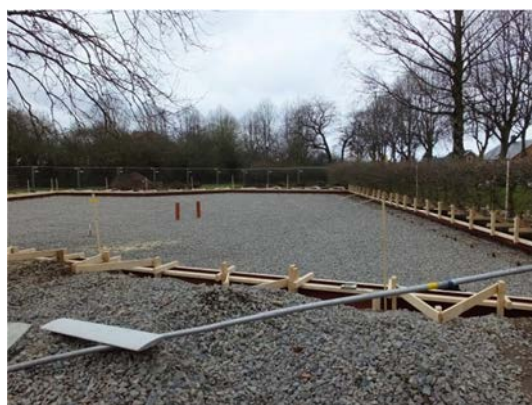
Ramen för betongfundamentet är klar