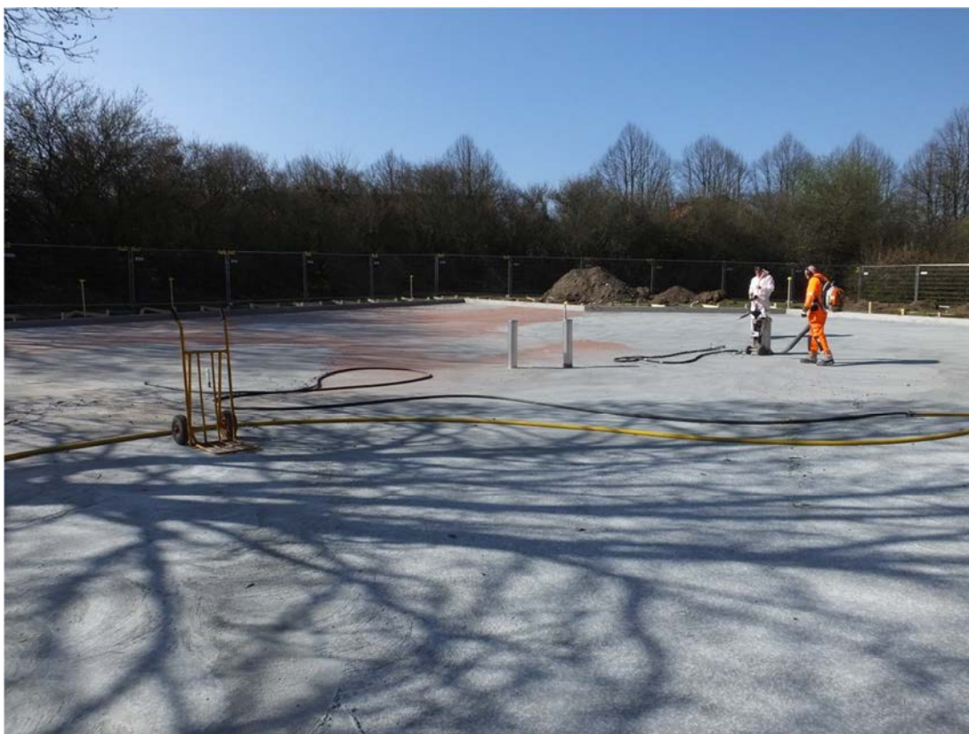
Betongskiktet har lagts på.