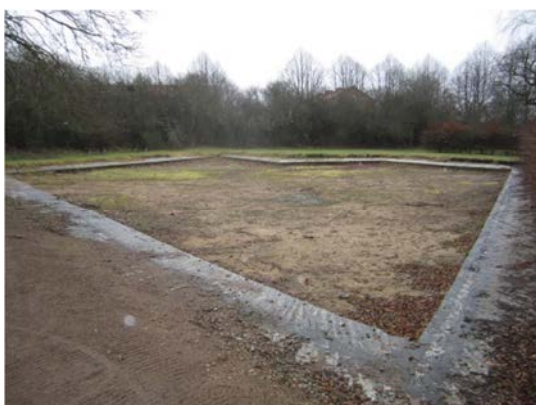
Dammen innan demontering.

Åtgärderna på dammen har i huvudsak utförts i enlighet med Länsstyrelsens tillståndsbeslut. Eftersom det finns begränsat med dokumentation från rivningen av dammen och eftersom den genomgick en ombyggnation under tidigt 1990-tal är det osäkert vad som har varit original från 1960-talet och vad som varit från 1990-talet. Arbetet har genomförts med avsikt att återställa dammens utseende så långt möjligt. Återställandet av dammen har resulterat i en tät och funktionell vattenspegel, vilken är en viktig del av Sankt Petris kyrkoanläggning.