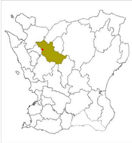
Klippans kommun, Klippan med Sankt Petri kyrka ungefärligt markerat.