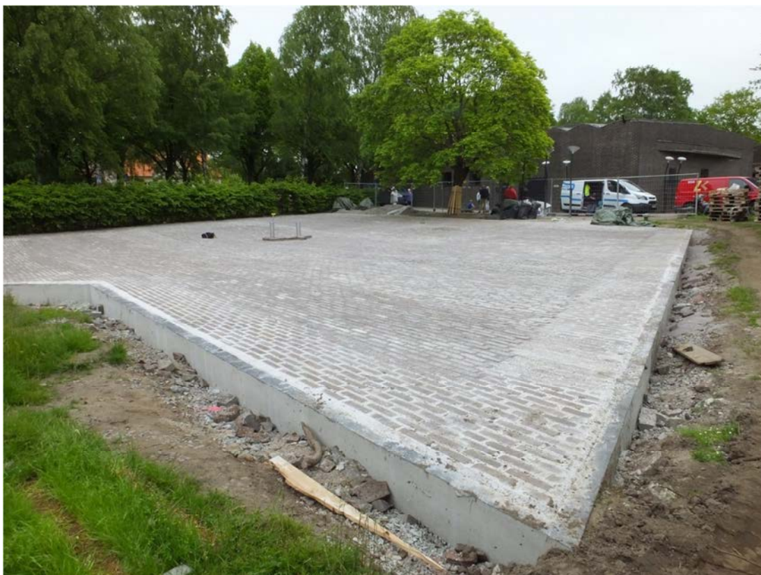
Ansyn innan vattnet satts igång och innan marken runt om färdigställts.