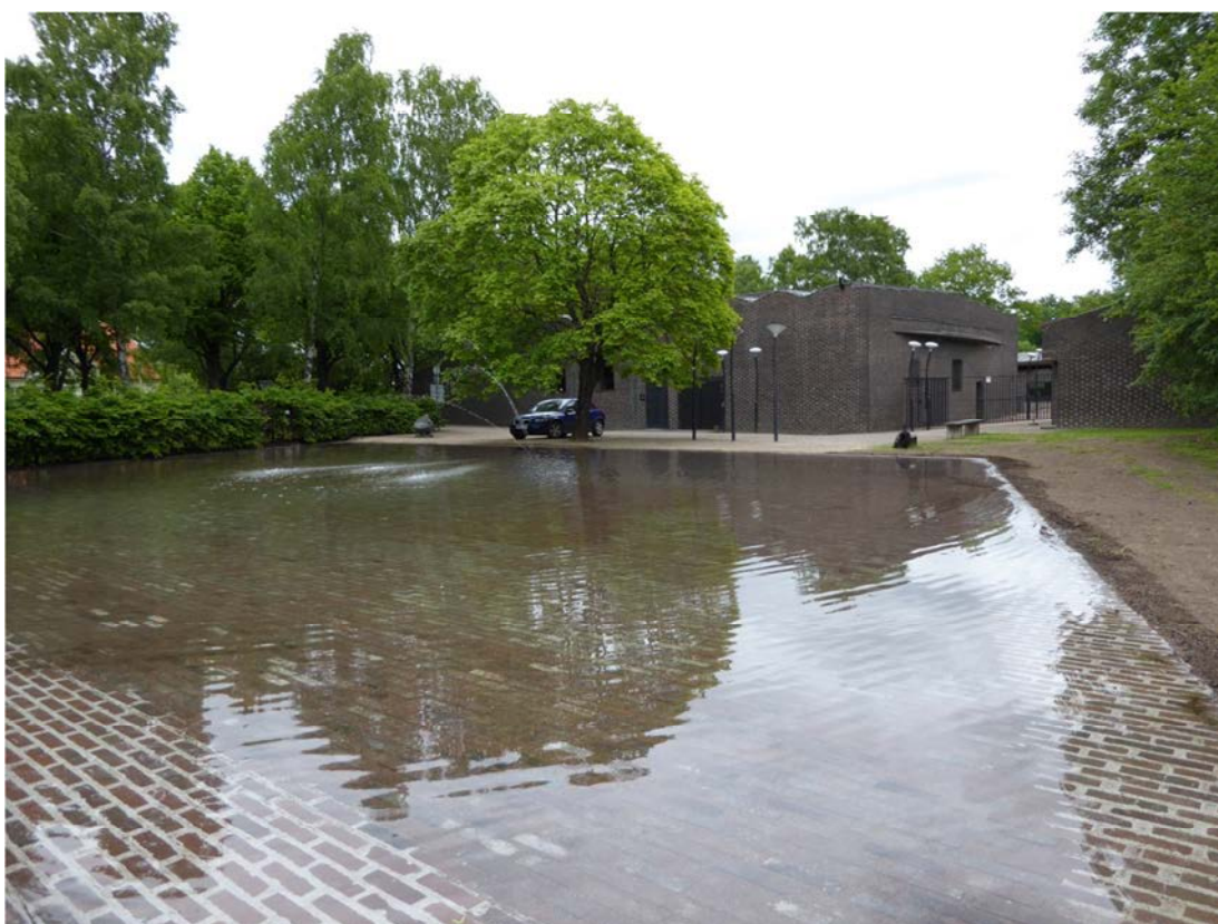
Det färdiga resultatet. Små justeringar av ex. vattennivå och marken runt om återstår.