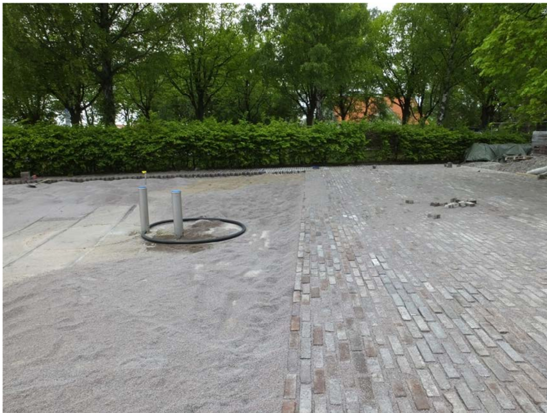
Teglet har börjat placeras i stensjålet.