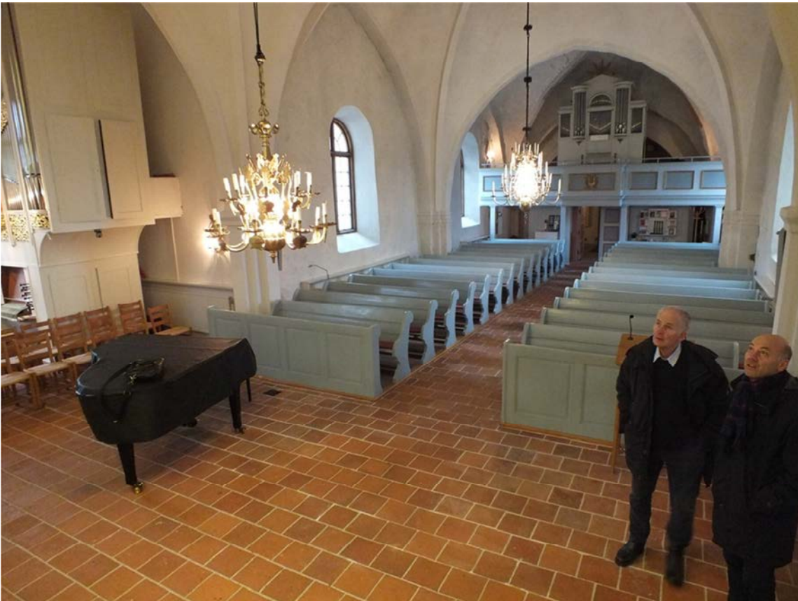
De övre bilderna visar det omlagda golvet i sakristian före respektive efter åtgärd.