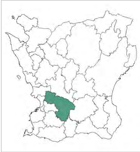
Lunds kommun, markerad i grönt.