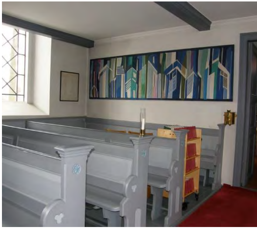
Södra sidan före omgestaltningen.