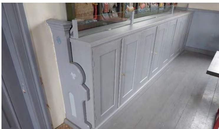
Norra sidan efter ett skåp tillkommit under altartavlan.