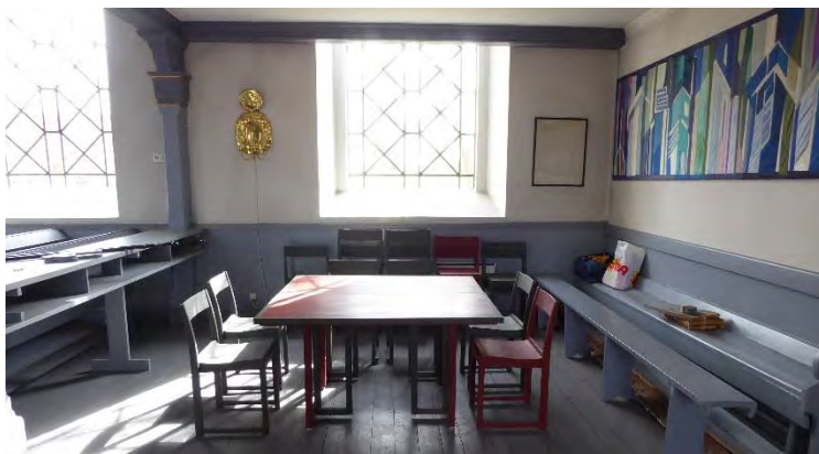
Ny inredning placerades både på norra och södra sidan. Stolarna fanns i kyrkan sedan tidigare. Borden gjordes vikningsbara för att kunna anpassas. För valet av kulörer på bord och stolar togs inspiration från altartavlan.