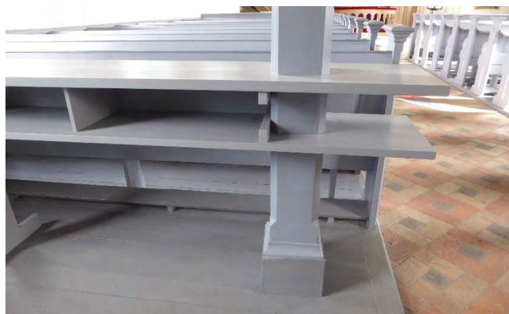
Norra sidan efter att ståbordet/hyllsystemet kommit på plats. Orgelläktarens pelare byggdes in i de nya hyllorna.