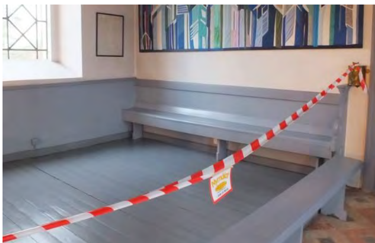
Efter att södra sidan målats. Det fanns tidigare lösa bänkar i liknande stil som bänkinredningen. Dessa togs tillvara på.