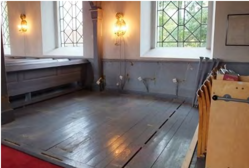
Södra sidan efter bänkborttagningen. Håligheter lagades och dosor till bänkvärmare togs bort.