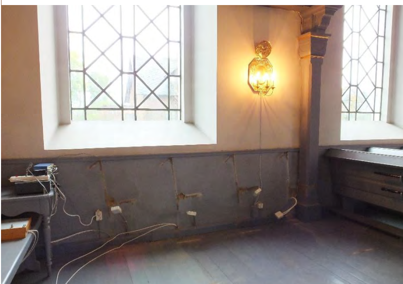
Norra sidan efter bänkborttagningen. Väggarna hade mindre skador efter de vägghängda dosorna.