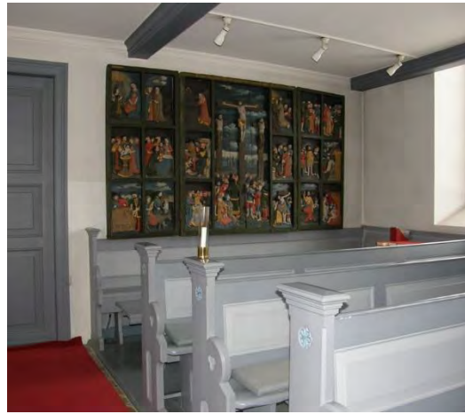
Norra sidan före omgestaltningen.