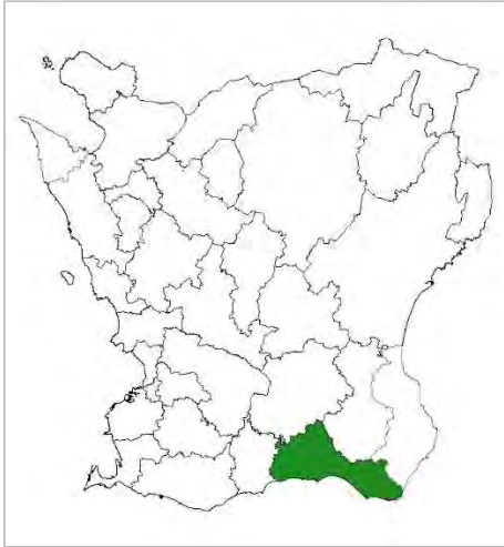
Kommunkarta över Skåne, Ystad kommun är markerad i grönt.