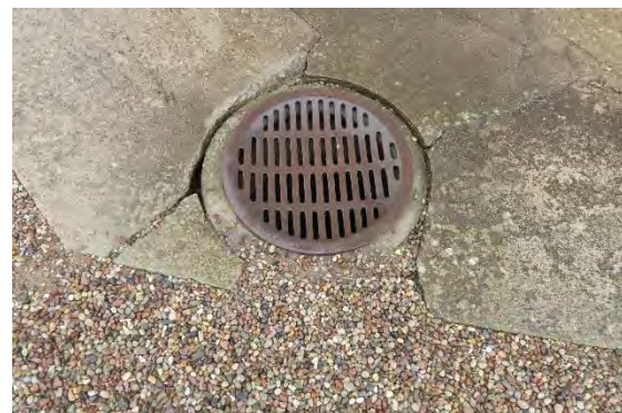
Bild t.v. Gamla stengången som gick utmed kyrkan. Bild t.h. brunnens placering innan flytt.