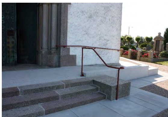
Bild t.v. Det nya rampområdet anläggs på sydvästra sidan om kyrkan. T.h. De mörkare delarna är stenar som återanvänts från den gamla trappan. De ljusare är den nya stenen som kommer mörkna något med tiden.