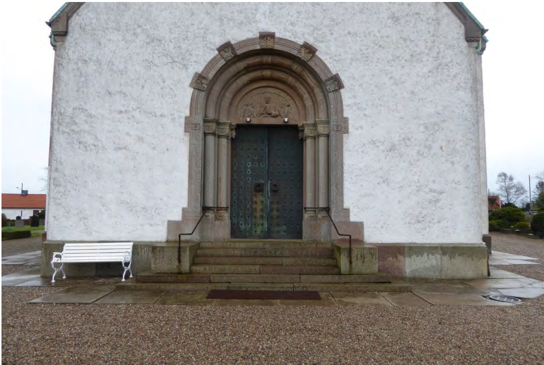
Kyrkans huvudgång, placerad på västra sidan, innan rampanläggningen. Delar av trappan återvändas i den nya. Eftersom det nya handräcket gjorde utefter det tidigare kunde gamla hål återanvändas.