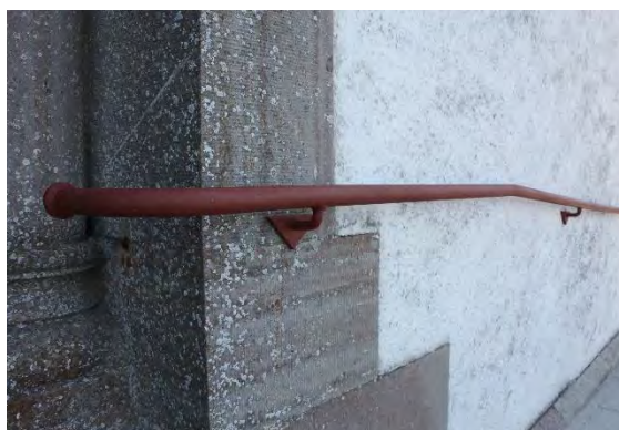
Bild t.v. Delar av de gamla stenplattorna ersattes med nya då de gamla inte kunde justeras på ett bra sätt. Plattorna har gjorts i samma dimension som de gamla. Bild t.h. Närmare bild på ett av de nya räcken som gjorts med inspiration från de gamla.