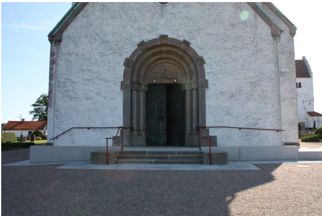
Kyrkans nya ramp med handräcken. Handräcke hade ämnat inte hunnit målas vid besökstillfället, men ska färgsättas i en kulör likt föregående.