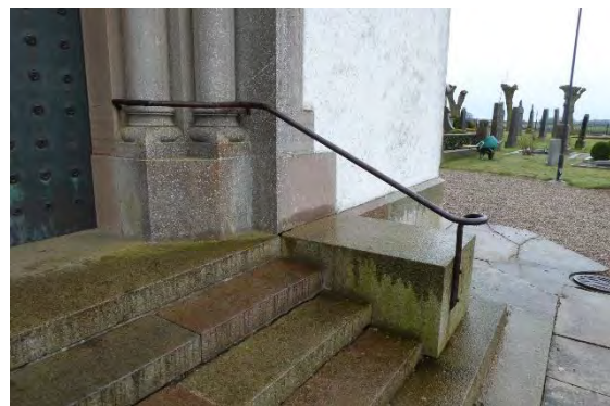
Bild t.v. Kyrkoingången sett från sydväst. Bild t.h. Trappans gamla handrücke.