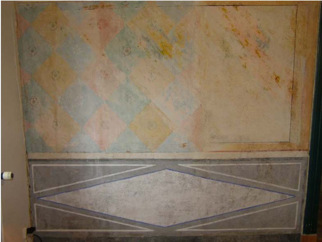
Bilderna visar det färdiga resultatet sedan lagning, infästning och retuschering har gjorts.