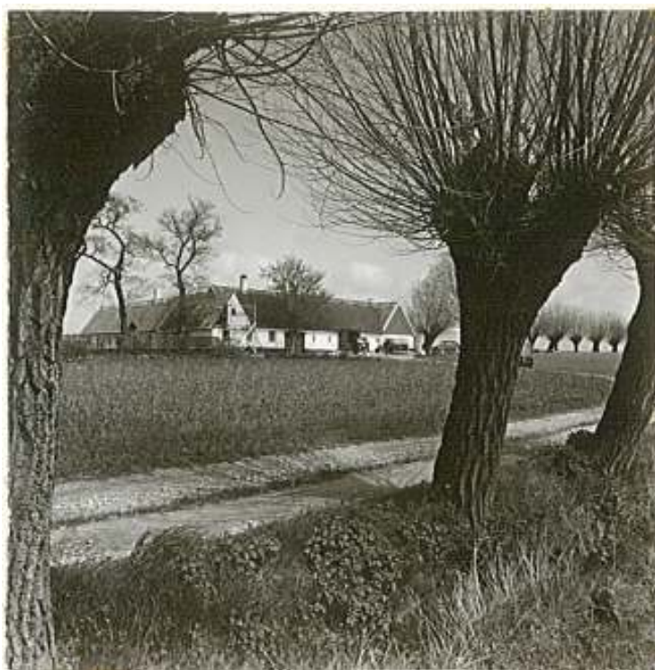
Axatorp gård fotograferad 1962.