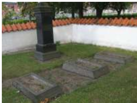
Bilderna visar liggande gjutna gravvårdar med oval form respektive liggande granitvårdar.

Graniten som sedan slutet av 1800-talet varit det dominerande materialet för gravstenar på de svenska kyrkogårdarna har också flest representanter på Kävlinge gamla kyrkogård. Den äldsta typen av dessa granitvårdar var rest, stod på en hög avfasad sockel och hade uppåt avsmalnande liv med polerad framsida och krysshämrad baksida samt avslutades av ett vinklat krön. En ökad variation avseende motiv, krönens utformning samt grövre ytbehandling av baksidor och socklar uppträder snart tillsammans med en ökning av svart granit på bekostnad av den tidigare vanliga grå. Med utveckling av metoder att polera och slipa stensmaterialet kom vidare fler motiv som kors, eklöv, kransar, stjärnor blommor och gurlanger. På Kävlinge gamla kyrkogård finns flera olika varianter av granitvårdar från 1800-talets senare del. Nordväst om kyrkan står ett par exempel på vårdar med varierande ytbehandling och öster om finns representanter för vårdar med rik dekor i form av bland annat krans, stjärnor och kors. Av de resta granitvårdarna är typen med avsmalnande liv, vinklat krön och polerad framsida med någon form av dekor vanligast.