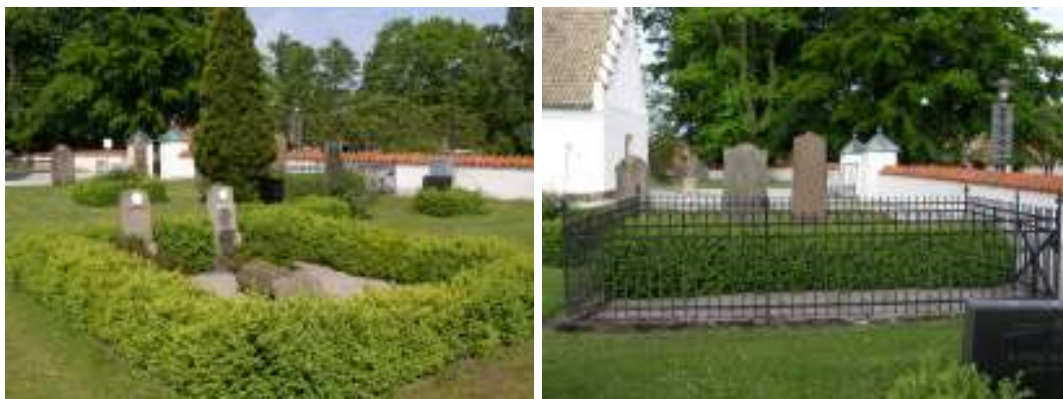
Bilderna visar en gravplats omgärdad av buxbomshäck och med plantering av pion respektive gravplats omgärdad av ett enkelt gjutjärnsstaket och planteringsyta avgränsad genom en häck av buxbom.

Utöver de två ovan nämnda gravplatserna med idegran respektive gjutjärnsstaket kombinerat med buxbom utmärker sig en gravplats avseende växtligheten. Denna omges av en klippt häck av buxbom och framför två av de tre gravvårdarna har pioner planterats.