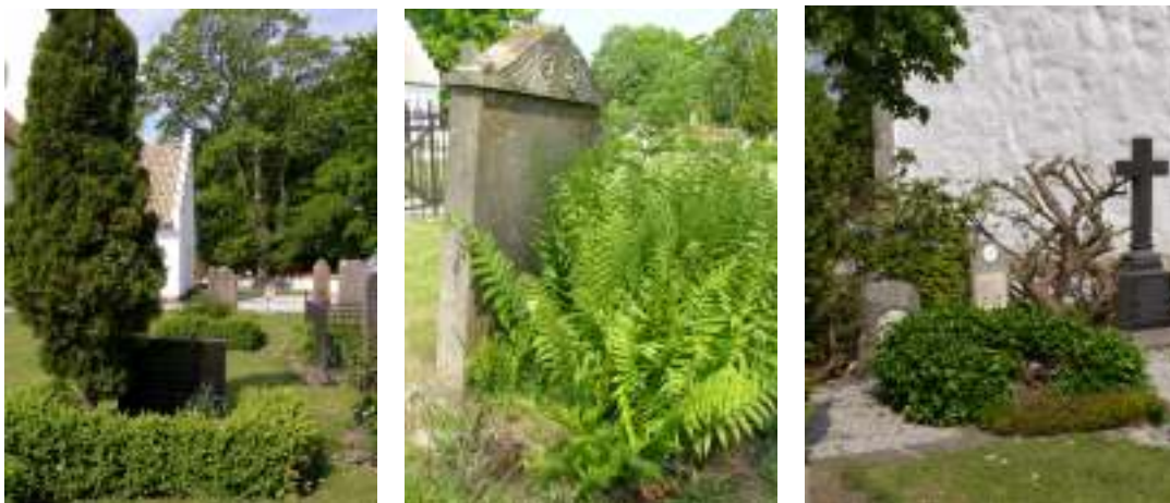
Bilderna visar exempel på växtlighet i anslutning till gravplatserna, tuja, buxbom, bräken, ljung och idegran.

grindpartiet och ungefär mittför kyrkan i söder finns ytterligare en lind. På situationsplanen från 1919 är en trädkrans som sträcker sig kring hela kyrkogården uttridat. Luckor där träd bör ha avlägsnats finns i sydväst, nordväst och nordost. Av fotografier från slutet av 1910-talet framgår att kyrkogården var en lummig plats med högre trädkrans, låga buxbomshäckar, vildvuxna städsegröna växter och gräs.