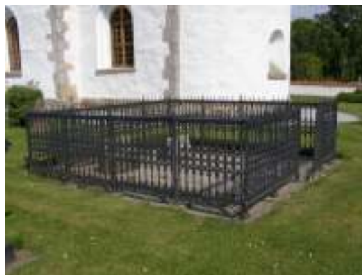
Bilderna visar ett exempel på den enklare typ av gjutjärnsstaket som förekommer på kyrkogården respektive den mer rikt gestaltade omgärdning som finns kring en av gravplatserna.

På kyrkogården finns 8 buxbomsomgärdade gravplatser och merparten av dessa saknar gravvård. Av de 3 gravplatser där gravvården/gravvårdarna står kvar finns två på den västra delen av kyrkogården och den tredje i öster. Ytmaterialet på samtliga är singel. Inom omgärdningar där gravvården har tagits bort har även eventuellt ytmateriale avlägsnats och ersatts med bar mark. Två av de 10 buxbomsomgärdade gravplatserna återfinns väster om kyrkan och resterande i den östra delen av kyrkogården.