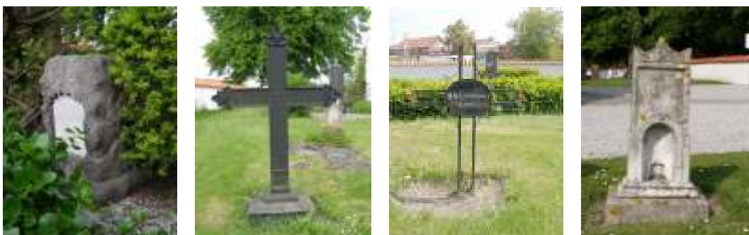
Gjuten gravvård med bladmotiv i relief, gjutjärns- och smidesvård respektive vård i marmor.

På kyrkogården finns 5 vårdar i järn med formen av kors. Tre av dessa ingår i en familjegrav och står placerade på rad sydost om kyrkan. De två yttre är exakta kopior av varandra och står ovan på fundament medan det mellersta saknar synlig sockel. Samtliga är gjutjärnsvårdar med armar som avslutas med trepassformer. Med placering öster om kyrkan står två smideskors över smeden Per Lundgren respektive skomakare H. Larsson. Korsen är tillverkade av firsidiga relativt kläna järn, inskriptionerna finns på ovala plattor fästa i korsens mitt.