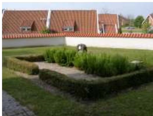
Bilderna visar den stenomgärdade gravplatsen söder om kyrkan respektive en av de buxbomsomgärdade gravplatserna på den västra delen av kyrkogården.

En stenomgärdad gravplats finns söder om kyrkan. Omgärdningen utgörs av en låg ram i grå granit. Gravplatsen direkt väster om har en yttre ram av plattor i röd kalksten. Dessa kan möjligen vara ersättning för en tidigare omgärdning av exempelvis buxbom. Vid två gravvårdar på den östra delen av kyrkogården återstår mindre buxbomsplanteringar som kan vara rester efter tidigare omgärdningar. Dessa planteringar omger en planteringsyta i anslutning till vården och troligen har gravplatsen tidigare varit täckt av singel samt omgärdats av en låg häck av buxbom.