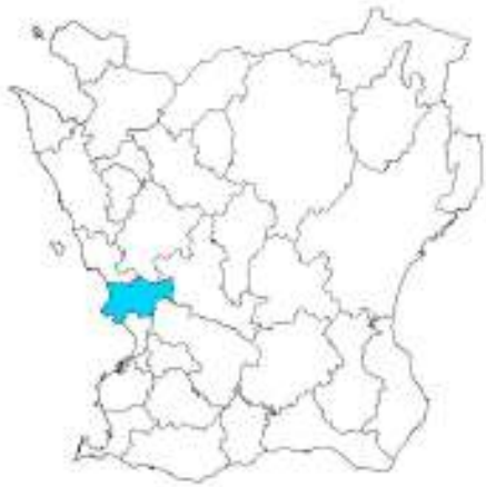
Skånekartan med Kävlinge kommun markerad.