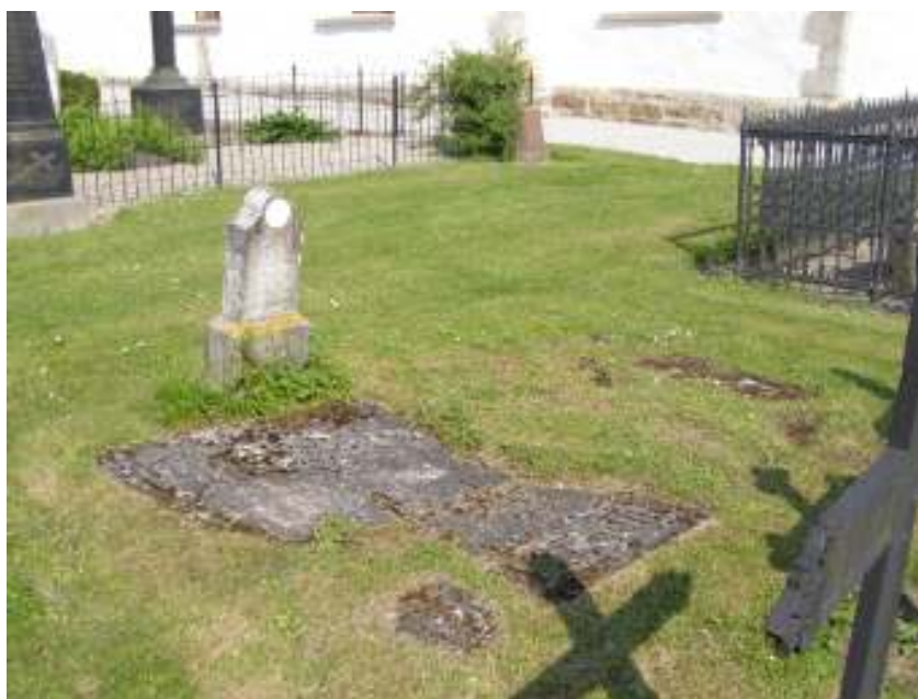
Liggande gravhällar i kalksten på kyrkogårdens södra sida. Närmast i bild framträder den södra av de båda och ovan skymtar mossbevuxna delar av den norra vård.

Kyrkogården rymmer 8 kalkstensvårdar och två av dessa utgörs av liggande gravhällar medan övriga är resta. De två liggande gravhällarna i kalksten är placerade sydost om kyrkan och den norra av de två är så gott som helt övervuxen av gräs och mossa. Största delen av den södra är synlig men inskription liksom övriga motiv har så gott som helt nöts bort. De delar av vårdens mönster som går att urskilja, till exempel antydning till två centralt placerade medaljonger, stämmer överens med en gravsten som finns avbildad i skriften Sveriges kyrkor . Avritningen har enligt bildtexten gjorts 1920 och gravvården dateras till slutet av 1700-talet.