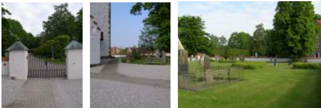
Bilderna visar grindpartiet i norr följt av gången som löper runt kyrkan samt en vy över den östra delen av kyrkogården.

dernt formspråk med raka linjer. Dessa har troligtvis tillkommit vid mitten av 1970-talet. Ett ritningsförslag utfört av Torsten Leon – Nilsson daterat 1975 finns bland arkivhandlingarna.