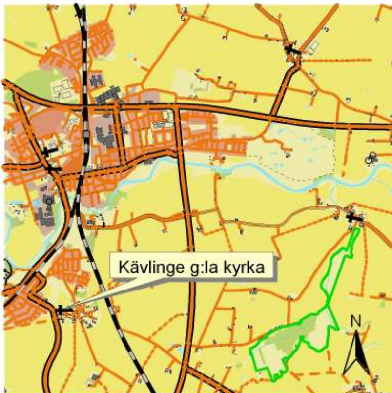
Fastighetskartan, blad 2C7g, med Kävlinge gamla kyrka och kyrkogård markerad.