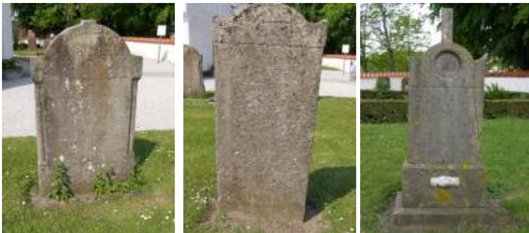
Tre exempel på resta kalkstensvårdar, de två första av den tunna breda typen med rätvinkliga yttre hörn respektive spetsigt avslutade hörn. Den sista bilden visar en av de lägre vårdarna som i detta fall pryds av två händer i ett handslag.

Tre av de resta kalkstensvårdarna står norr om kyrkan, 1 väster om grusgången och 2 öster om. Vårdarna är tunna och relativt breda med rakt liv. Vårdarnas avslutning upptill skiljer sig åt, gemensamt är att det mellersta partiet är rundat medan de yttre hörnen antingen är rätvinkliga eller går upp i en spets. Hur krönet på vårderna nordväst om kyrkan sett ut går inte att avgöra då endast brottytor återstår.