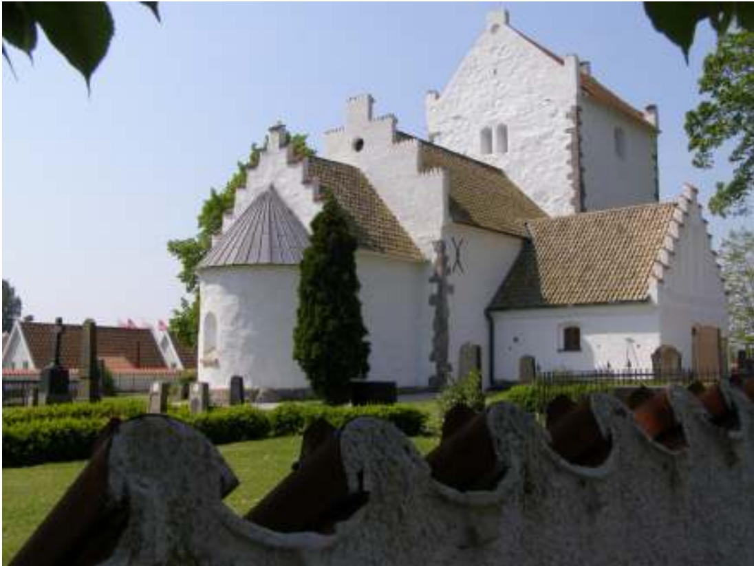
Gamla kyrkan i Kävlingsåsa sedd från nordost.