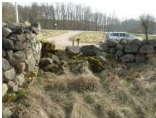
Skada nr 2.