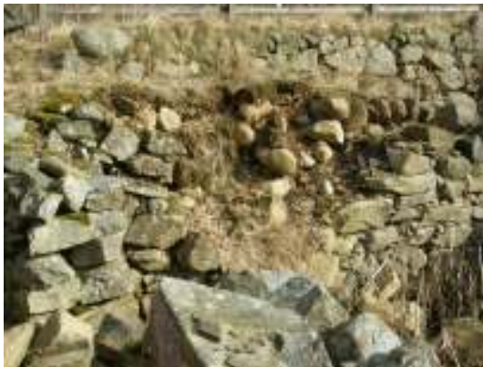
Skada nr 5.

Med anledning av områdets stora autenticitet bör inga gummi- eller fiberdukar läggas som skydd bakom omlavade murar. Däremot, t ex vid skada nr 5, kan ett par lager sammanpressad torv läggas i nivellerat läge på den smala landremsan mellan övre platåns yttermur till övre, yttre stenraden (vid skadan). Därmed försvåras infiltrering av regnvatten (se principskiss på sidan 17).