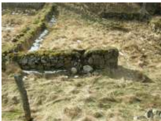
Skada nr 3.