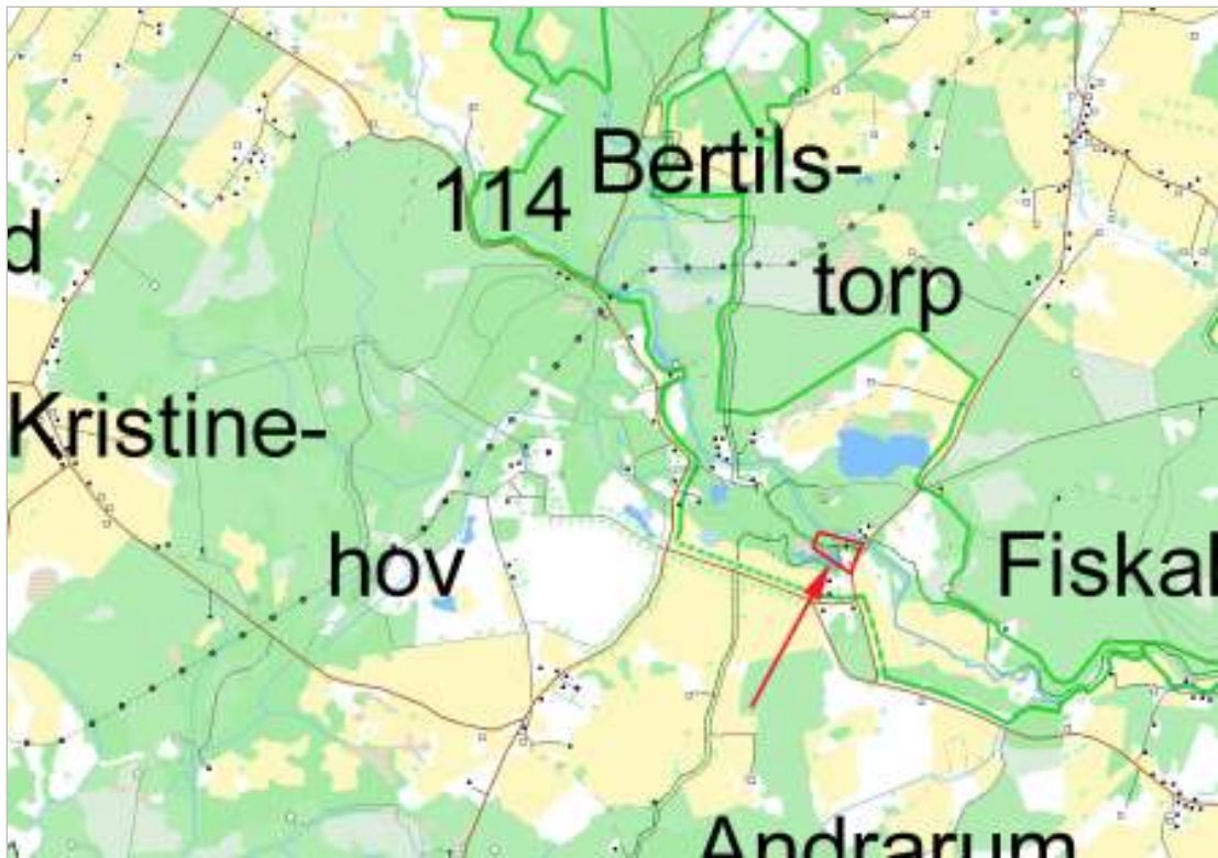
Del av Andrarum socken, Pannebusområdet markerat.