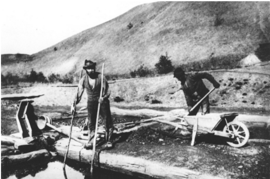
Arbetare vid alunbruket, ca 1910.

som infördes i slutet av 1700-talet var dubbelt så breda. Blypannorna stod på gjutjärnsplattor som i sin tur stod uppallade över eldstaden på järnbalkar. Blypannorna var igång dygnet runt och sköttes av pannesvennerna. En dubbelpanna förbrukade 12 lass ved om dygnet vilket kom att tära hårt på traktens skogar. Hettan och luten slet även på pannorna som inte varade i mer än 4 till 6 månader då de fick stöpas om. Den giftiga röken gick i de äldsta tiderna ut i gluggar i väggen.