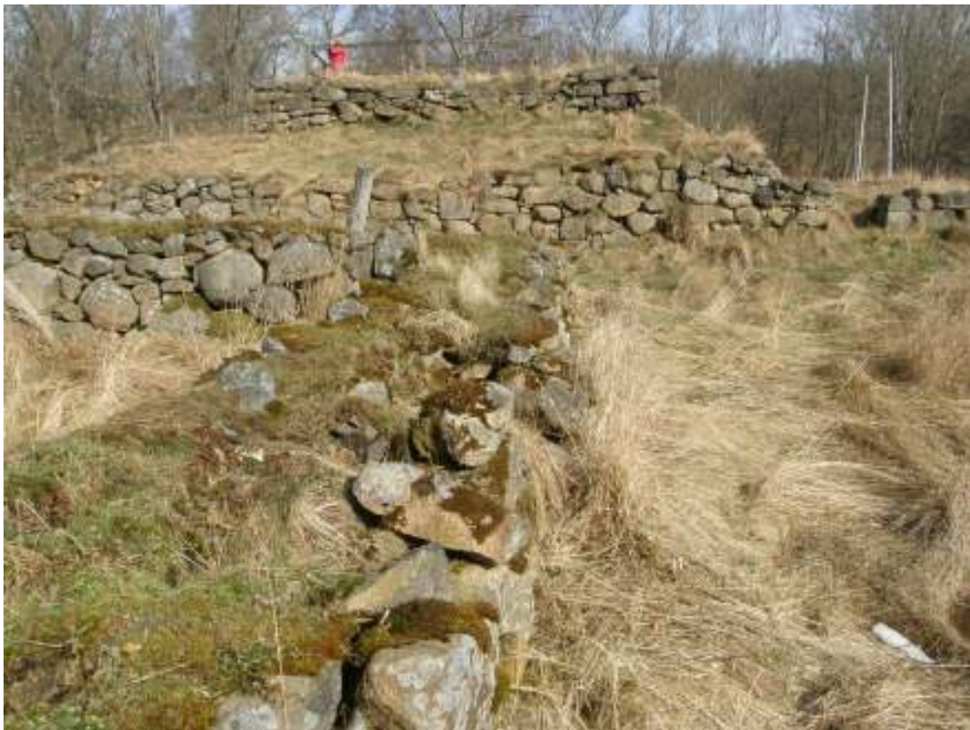
Vy mot norr över Pannebusets inre ruiner.