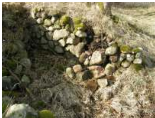
Skada nr 4.