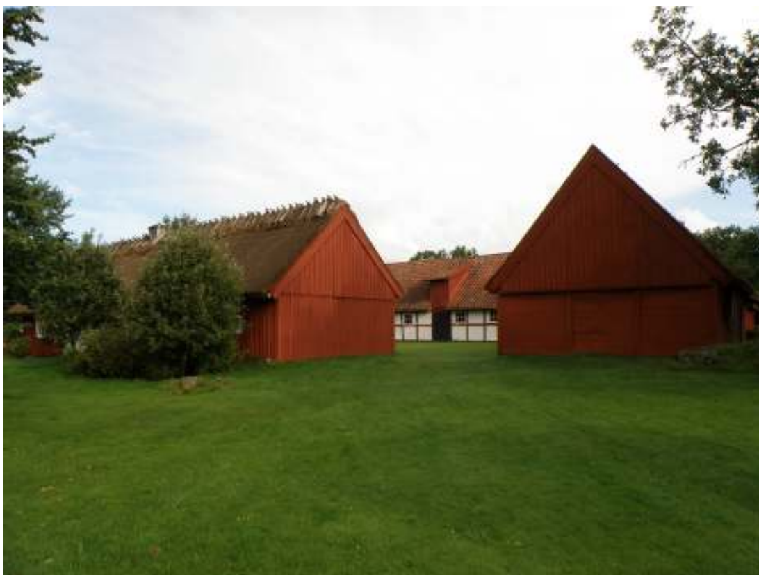
Bild 3: Ingeborrarpsgården år 2008, loglängan ligger till höger i bild.