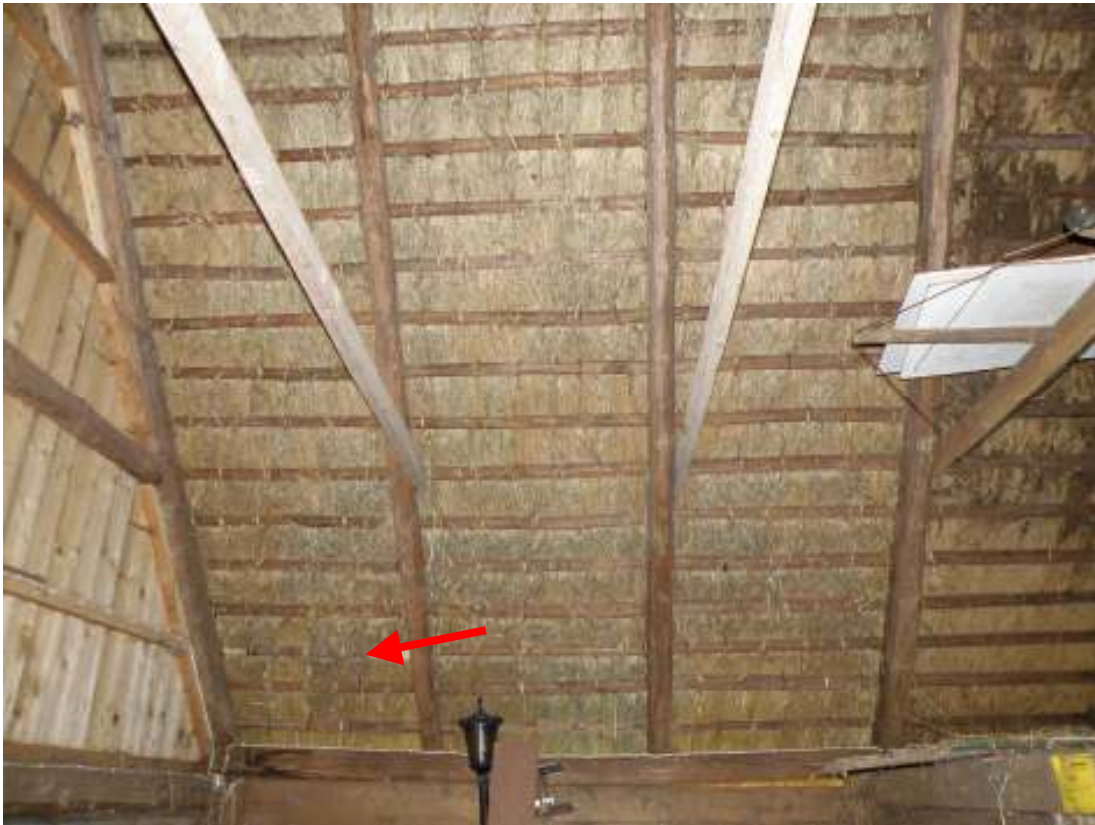
Bild 13: Nordvästra takfallet efter omläggning, till höger skymtar den äldre vassen. Pilen markerar den enda bytta läkten.