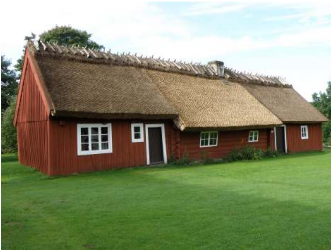
Bild 4: Mangårdsbyggnaden vars tak har lagts om från vass till halm i omgångar mellan åren 2005-2007.