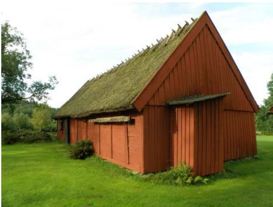
Bild 5: Loglängan från sydost, foto innan genomförda arbeten 2008.

torvtak återfanns på ursprunglig plats invid bakugnen i samband med restaureeringen.