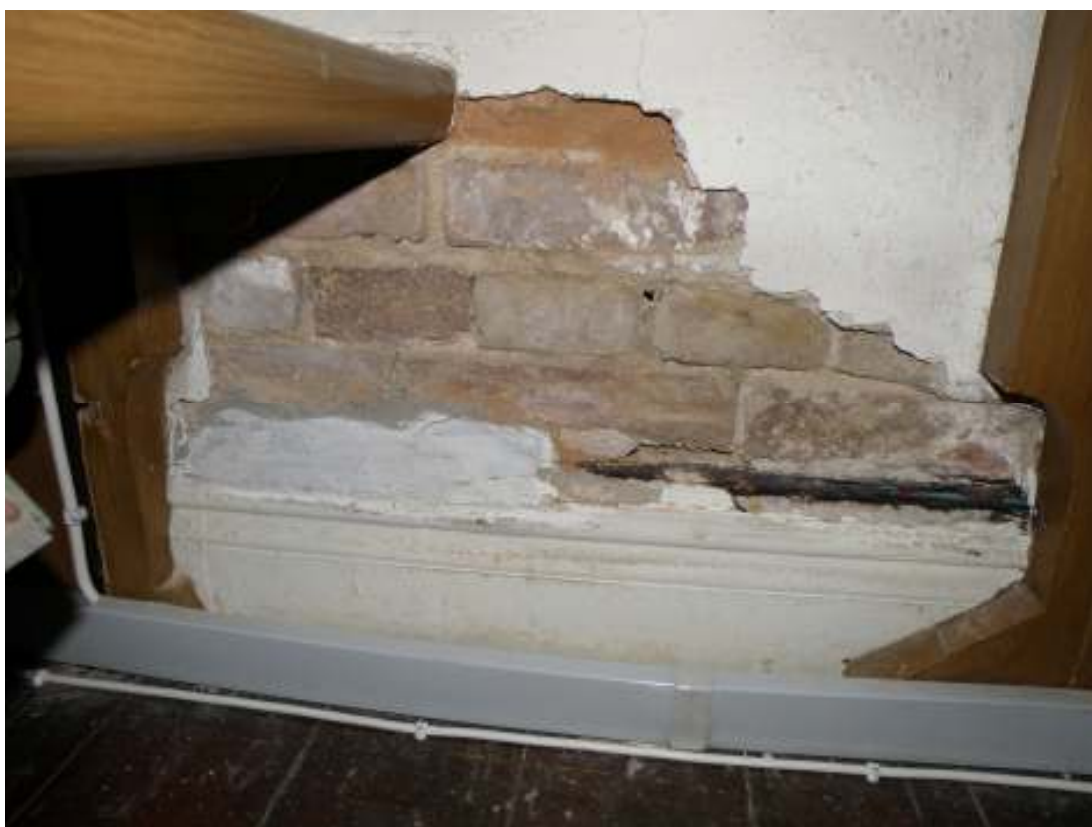
Skada i invändig puts som kan bli föremål för framtida åtgärder, fotografiet tagit i nordvästra delen av långhuset.