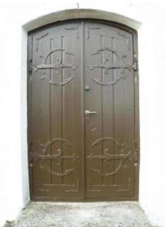
Östra porten före och efter målning.