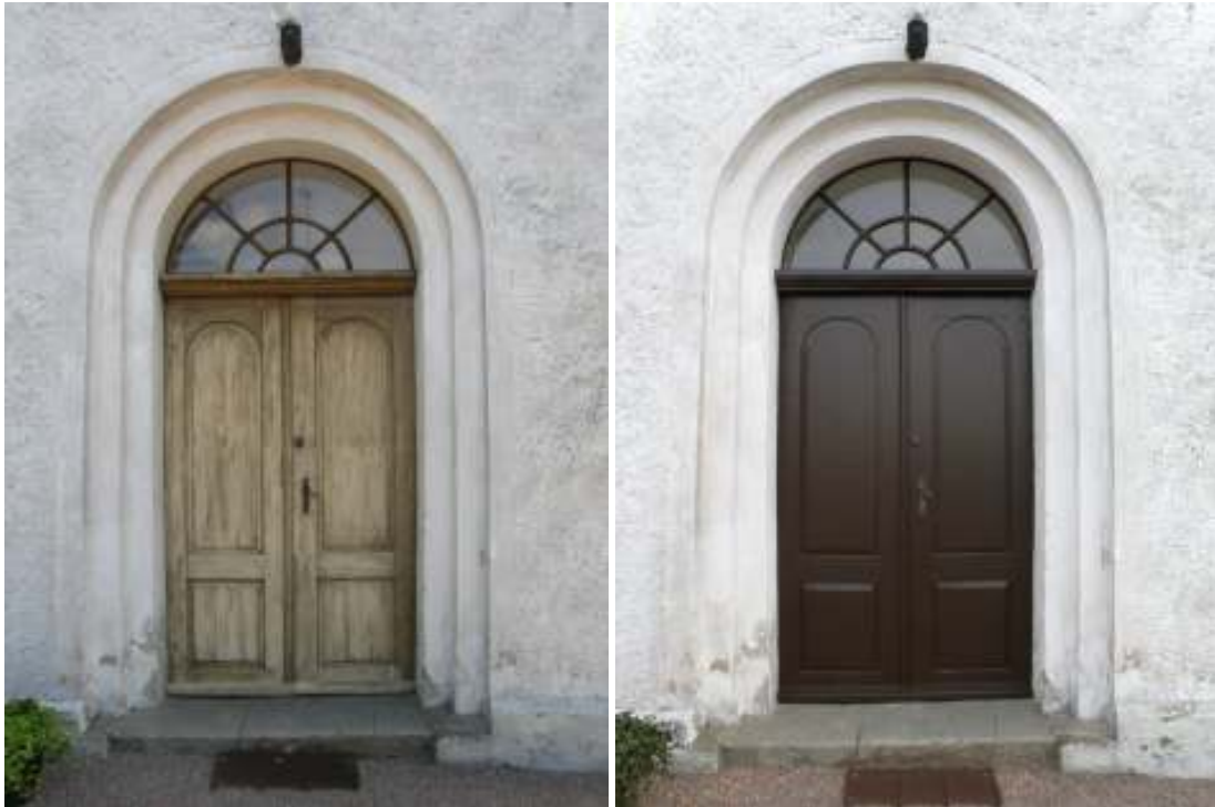
Västra porten före och efter målning