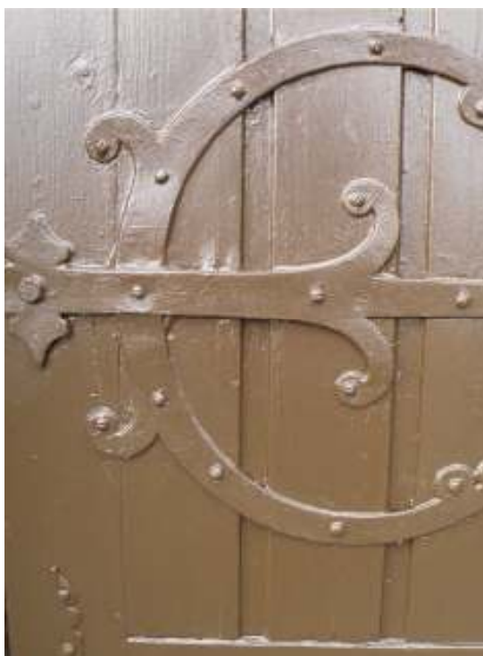
Östra porten, beslag före och efter målning.