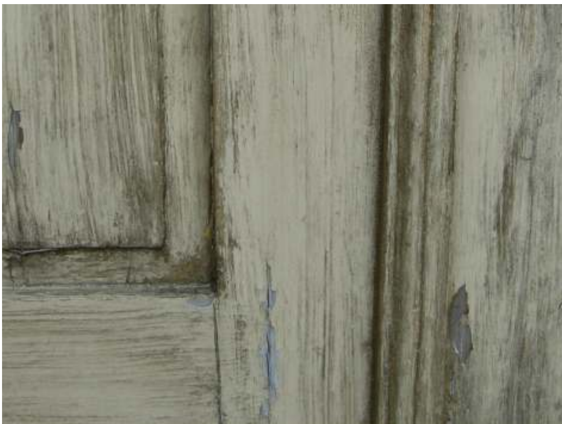
Västra porten före målning, underliggande färglager syns där färgen slagat.