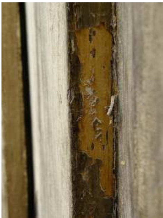
Västporten, underliggande lasering