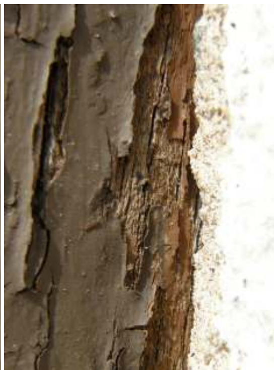
Rödbrun färg under befintlig brun på ostporten.