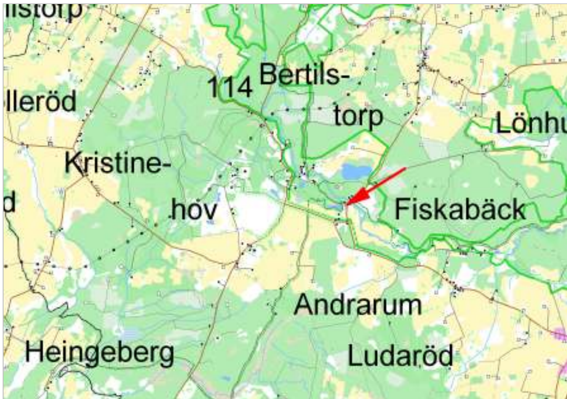
Del av Andrarum socken, pannebusområdet markerat.