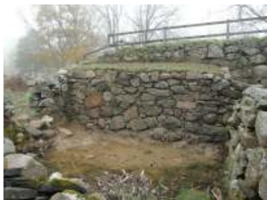
Skada nr 5, efter arbetet.