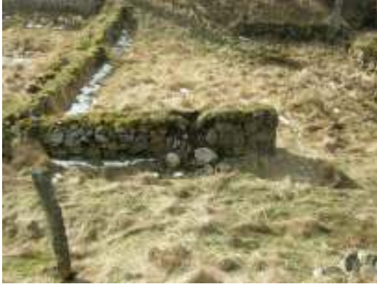
Skada nr 3, före arbetet.