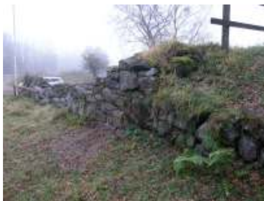
Skada nr 1, efter arbetet.