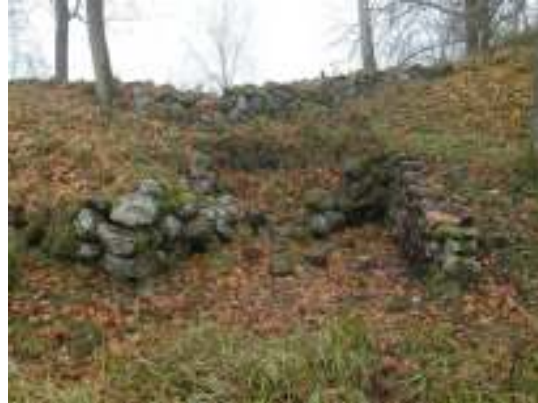
Skada nr 4, efter arbetet.