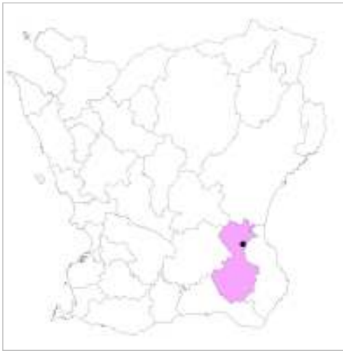
Tomelilla kommun, alunbruket ungefärligt markerat.