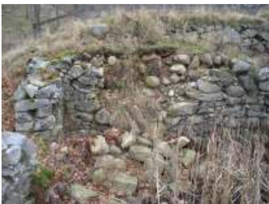
Skada nr 5, före arbetet.