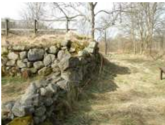
Skada nr 1, före arbetet.

Vid ett parti, markerat med X i ritningen ovan, hade skadebilden ökat efter besiktningen våren 2008. Då utrymme fanns inom givna ekonomiska ramar att åtgärda skadan beslöts att så skulle ske.