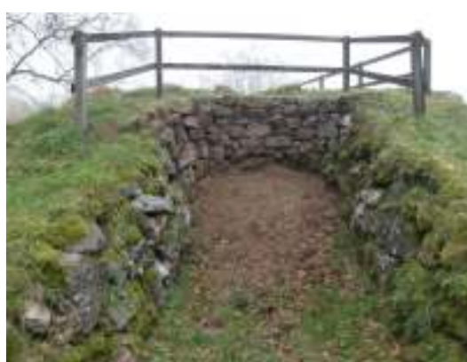
Skada nr 6, efter arbetet.