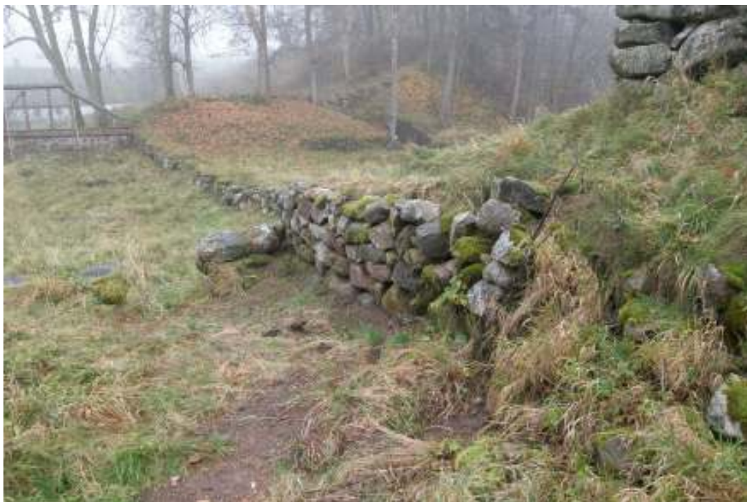
Åtgärdad mur som kalvat efter skadebesiktningen våren 2008.