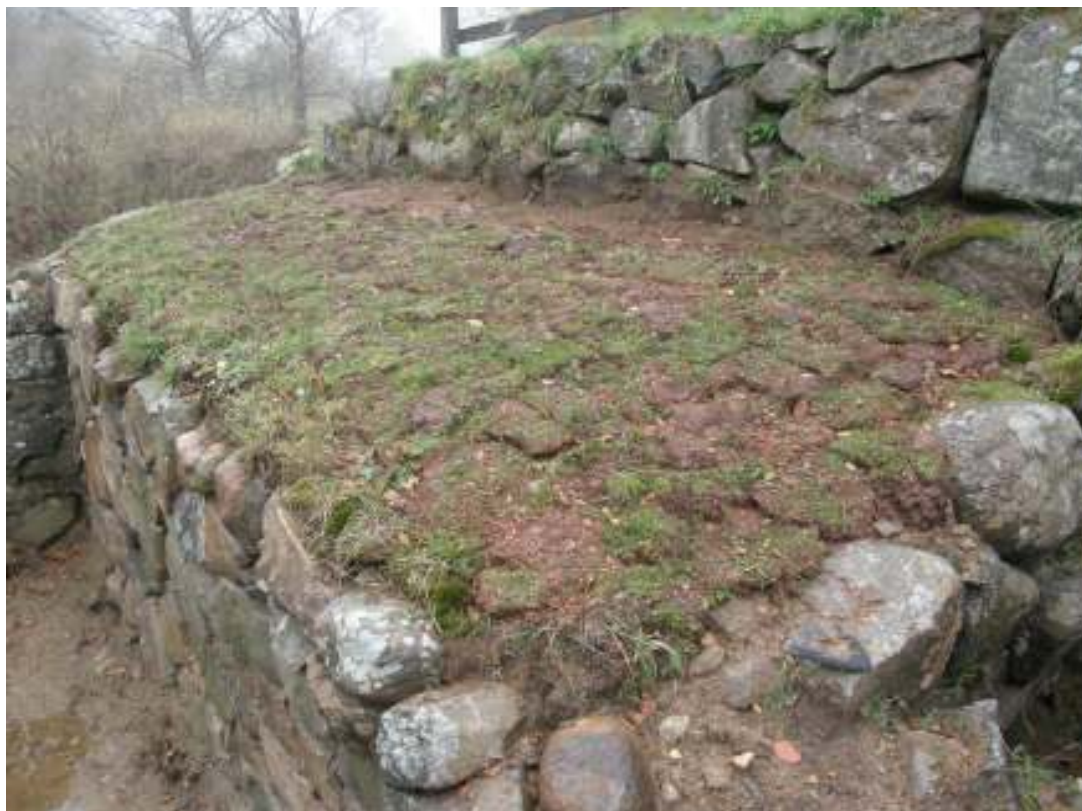
Skada nr 5, toppackningen, efter arbetet. Grästorven togs lokalt, bl a efter avsvälningen av lakkaren.