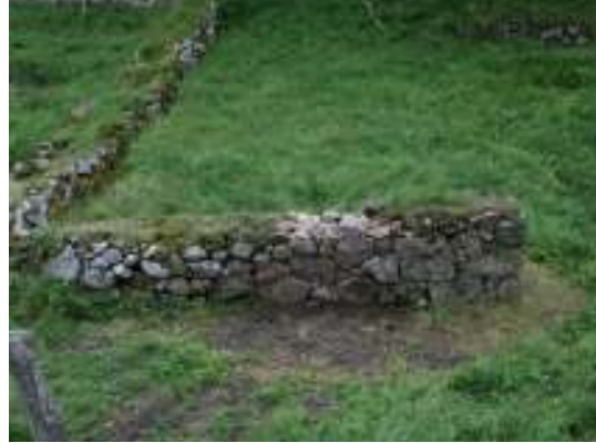
Skada nr 3, efter arbetet.