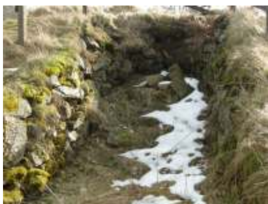
Skada nr 6, före arbetet.