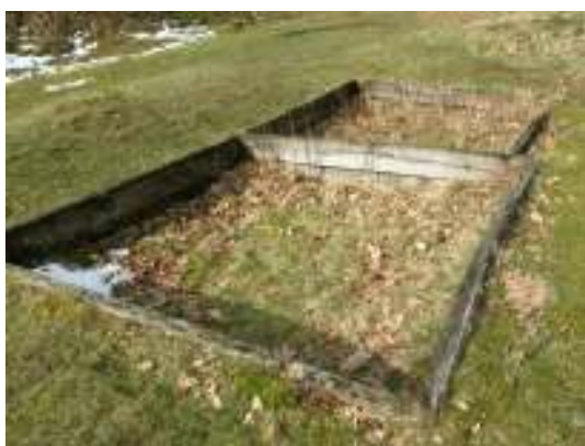
Lakkaren innan urgrävning.

De aktuella lakkaren, vilka är ursprungliga på platsen och framtagna under (gissningsvis) 1970 – 80-talet, befanns vid skadeinventeringen våren 2008 vara igenväxta. Dessutom var vissa delar av den sentida träsargen rötskadad. Karen urgrävdes/avsvålades för hand ner till nivån strax ovanför befintlig lerpäckning. Dessvärre föreföll leran sedan tidigare vara punkterad, varför förhoppningarna om att vattenspeglar naturligt ska bildas bör anses som små. Längs sargens norra långsida ersattes en planka mot nyttillverkad av samma mått och utförande som befintliga. Härvidlag gjordes avkall på materialvalet eftersom det under arbetet stod klart att träsargen var sekundär (se vidare under Avvikelser från arbetshandlingarna).