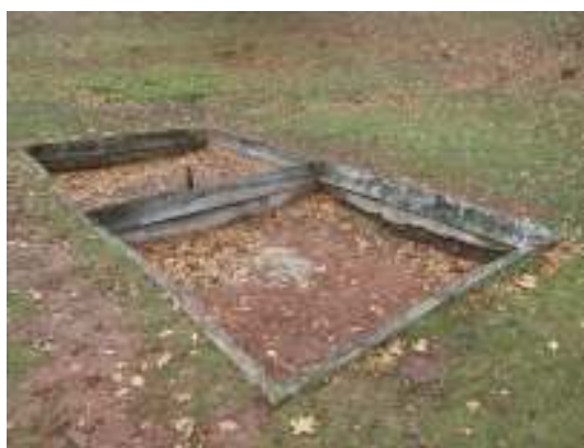
Efter urgrävning och trälagning.