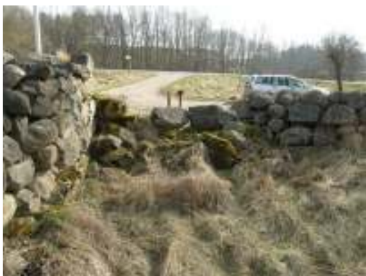
Skada nr 2, före arbetet.