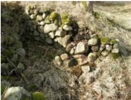
Skada nr 4, före arbetet.