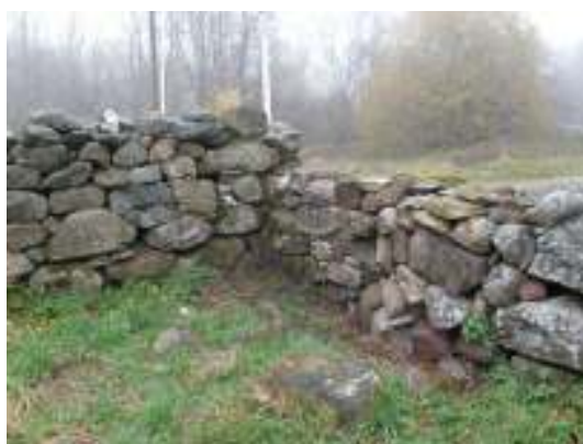
Skada nr 2, efter arbetet.