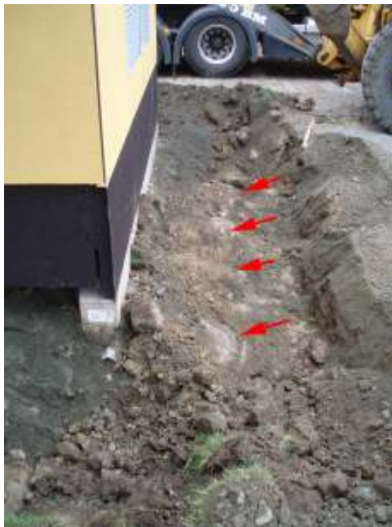
Fig. 5. De röda pilarna markerar stenar som sannolikt hör till Kristianstads fästnings utanverk (jfr fig. 3 och 4).

Undersökningen utfördes i form av schaktningsövervakning. Till övervägande del har markingreppen berört i modern tid omrörda massor (se rödtonat område i fig. 3.), något som i första hand kan kopplas samman med byggnadsaktiviteterna på 1970- och 80-talen. I den nordöstra delen av undersökningsområdet schaktades för ny brunn (se 1 i fig. 3.). Schaktet var ca 7 m i diameter och hade ett djup av ca 2,7 m under befintlig marknivå. Överst fanns moderna bärlager med en tjocklek som uppgick till ca 0,8 m, sedan följde ca 0,5 m med gråbrun sandinblandad lera med inslag av tegel. Under följde sedan blålera som fortsatte ner till schaktets botten. Inget av antikvariskt intresse påträffades.