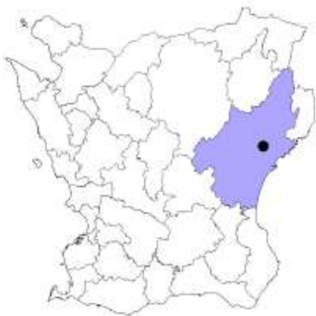
Fig. 1. Kristianstad i Kristianstad kommun i Skåne.