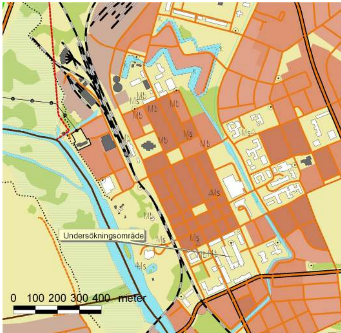
Fig. 2. Undersökningsområdet i den södra delen av Kristianstads historiska stadsområde. Utdrag ur fastighetskartan, bladet 3D 2j.