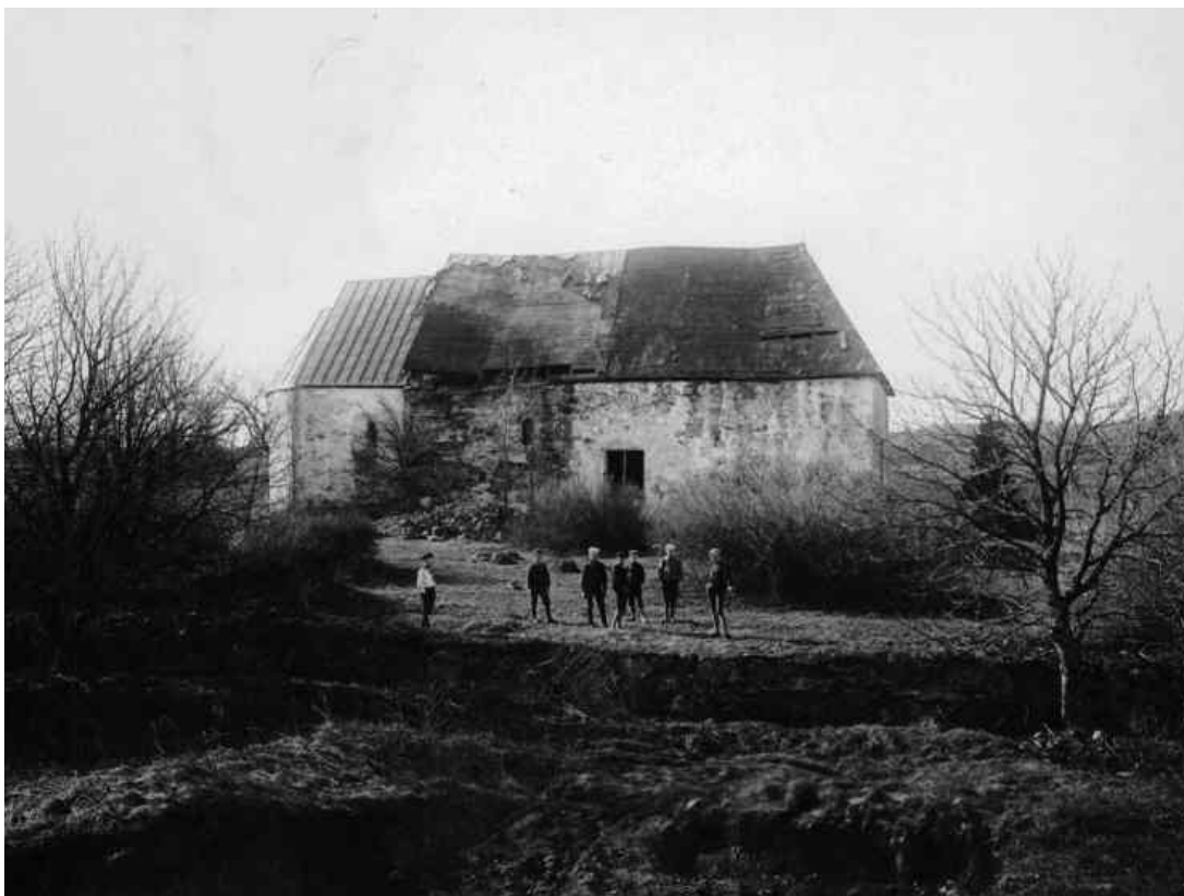
Ignaberga gamla kyrka sedd från norr, datum okänt, troligtvis taget under tidigt 1920-tal innan restaureringen kom till stånd. Långhusets nordöstra vägg har rasat och taket börjar ge med sig.