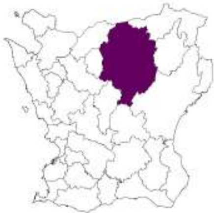
Skånekartan med Hälsleholms kommun markerad.