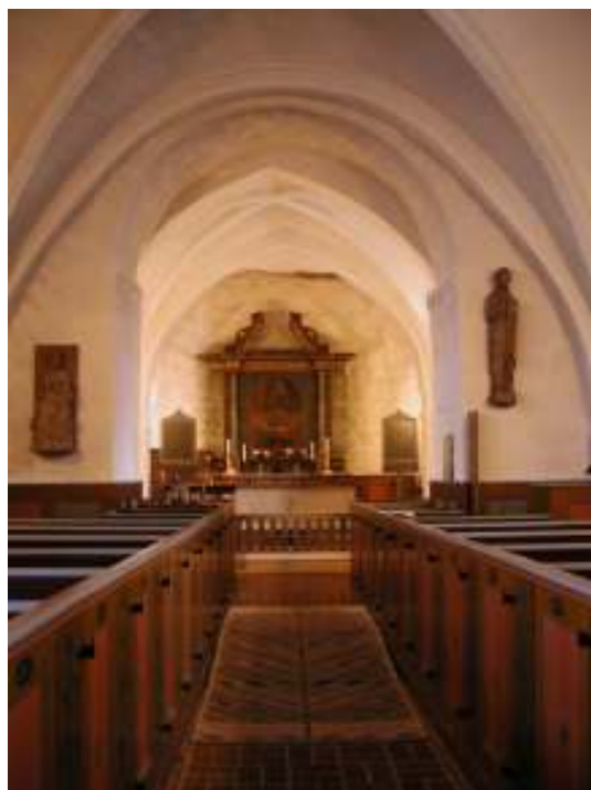
T.v. Koret innan restaureringen på 1920-talet. Äldre fotografi ur skriften Ignaberga gamla kyrka , 1965. Notera den slutna bänkinredningen samt stolparnas placering för upphängning av psalmnummertavlorna. T.h. Vy mot koret i öster innan åtgärder. Den slutna bänkinredningen sträcker sig genom triumfbågen in i koret. Notera även de medeltida skulpturernas placering på vardera sida om triumfbågen innan flytt samt psalmnummertavlornas placering på stolpar framför de främsta bänkraderna i koret.

Bänkinredningen är huvudsakligen av ek. Fronterna är dock i fur med tre infällda speglar i ett ramverk. Fronternas speglar är målade i en blå betsfärg. Fastsatt i bänkinredningens fronter finns stolpar i trä varpå psalmnummertavlorna är placerade.