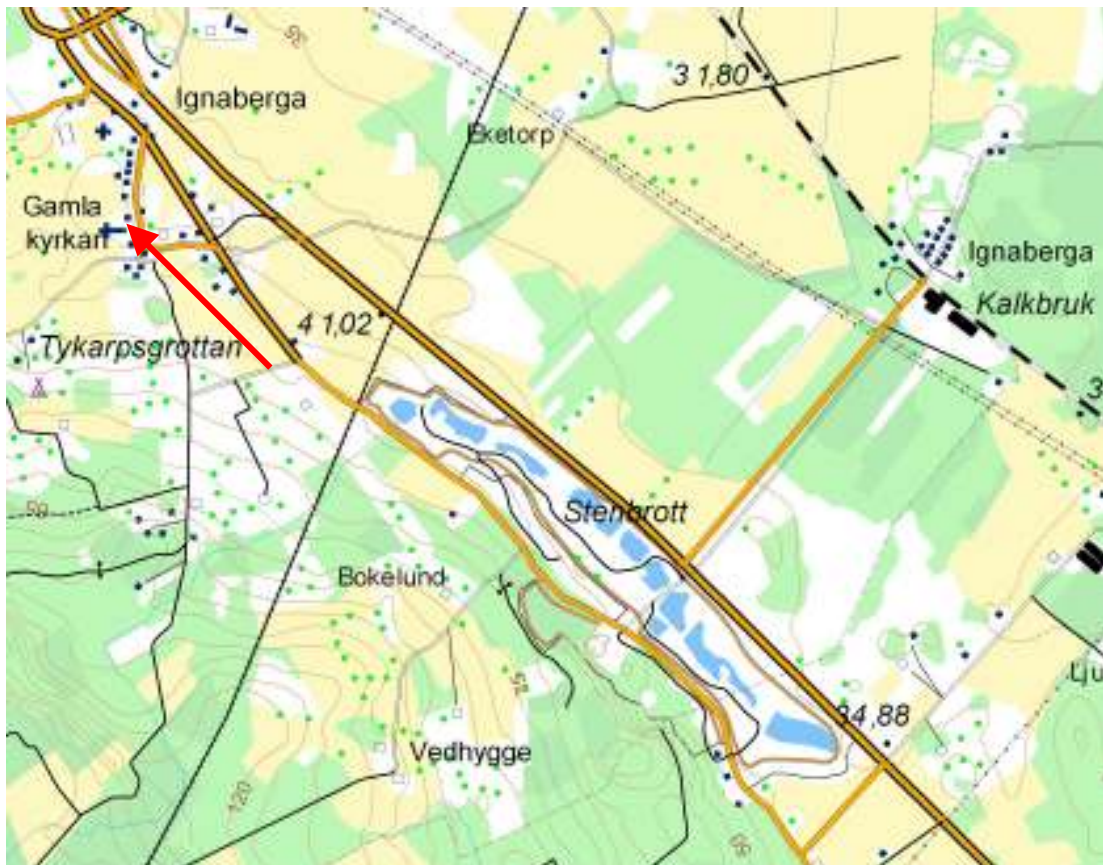
Ignaberga med den gamla kyrkan markerad. Notera den nya kyrkans läge i förhållande till den gamla.