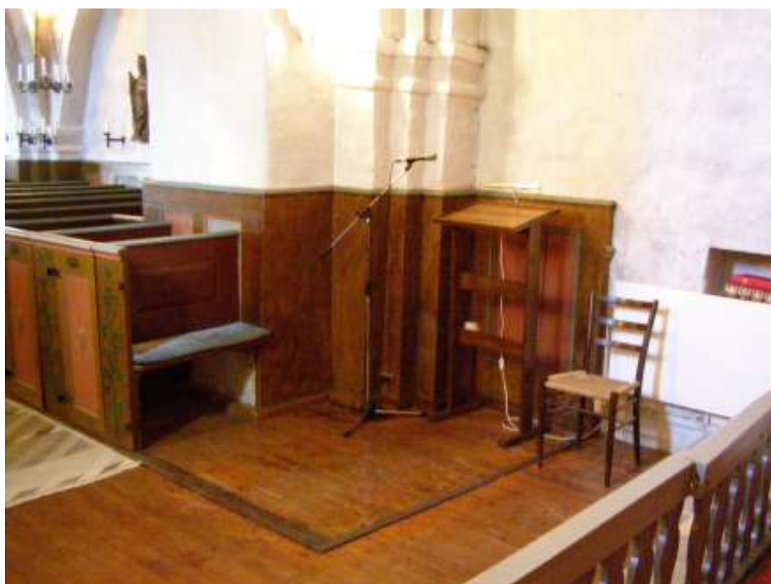
Överst: Bänkinredningen under demontering. Notera märkena efter den demonterade bänkinredningen på väggens bröstpanel samt de äldre bänkradiatorerna. Nedan: Norra bänkkvarter efter avslutad åtgärd.