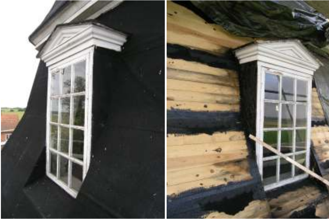
Detalj av fönster före och efter friläggande av befintlig ytpapp.