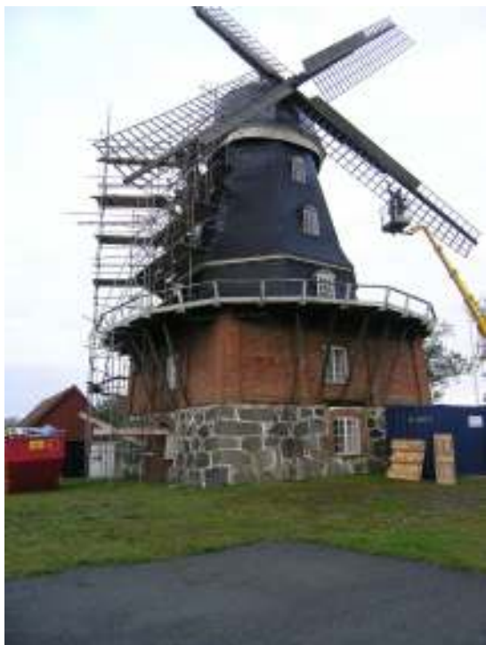
Vingarna på Krageholms mölla tjäras.