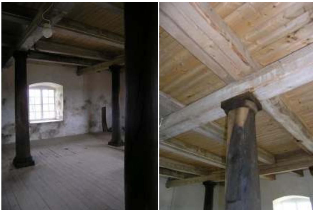
Krageholms mölla har en förböjd stenlot, där det undre planet är murat i natursten medan plan två har murar av tegel. Stenlotens andra våning användes ursprungligen som magasin. Idag är den uppskattad för sina karaktärspräglade träkonstruktörer och används då och då för större sällskap.

Några månader efter restaureringen år 1967 drabbades området av en svår storm, vilken tog både vingar och hätta med sig. För att rädda det som trots allt fanns kvar försågs möllan med ett platt tak.