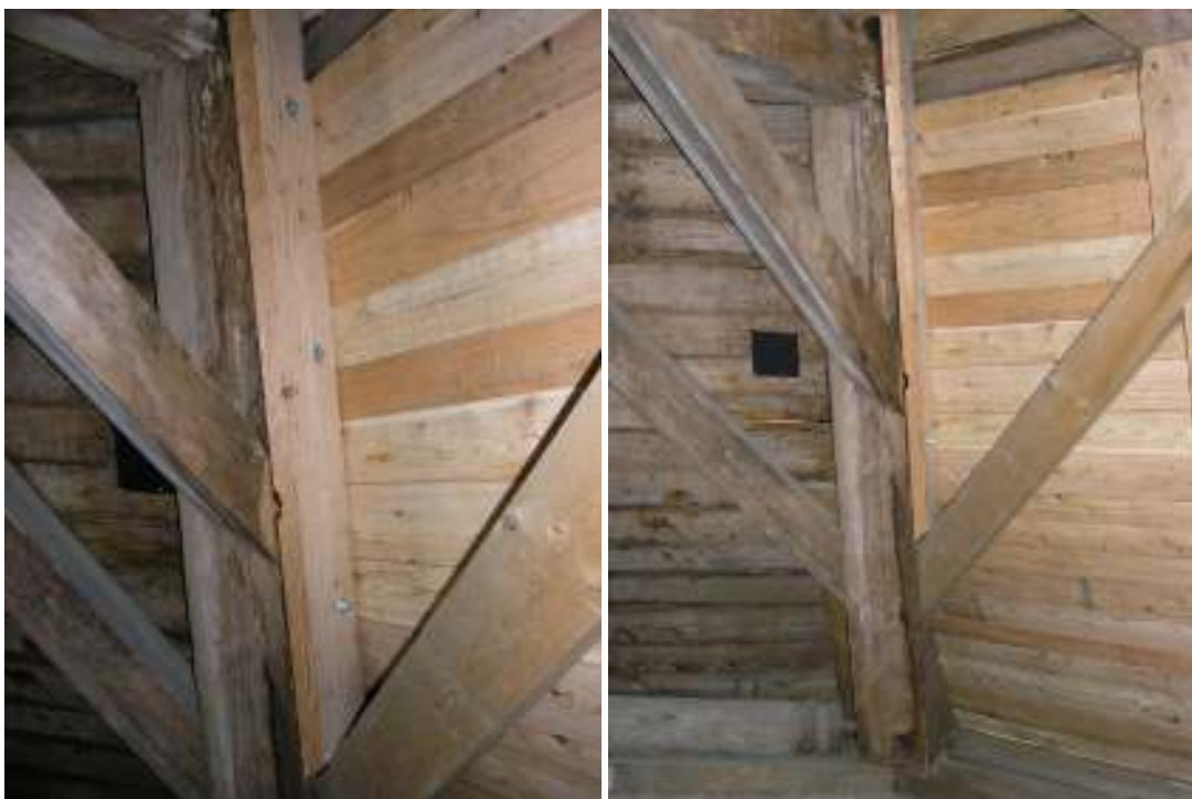
Ny underbrädning med råspont i varierande bredd samt nya kryss och på vissa ställen förstärkningar av ståndarna. Det sistnämnda har gjorts för att göra stommen stabil och samtidigt kunna behålla så mycket av originalmaterialet som möjligt.