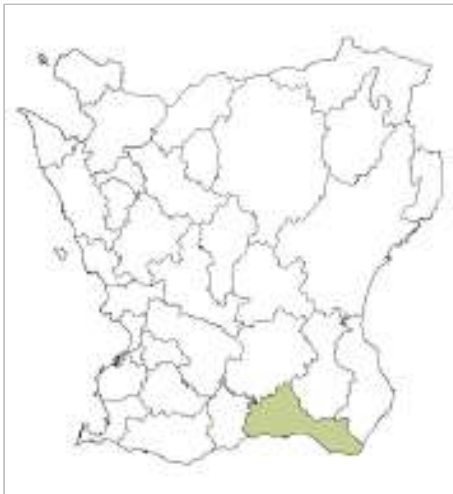
Krageholms mölla ligger i Ystad kommun