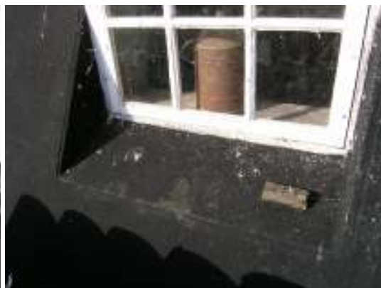
Takpappens anslutning till fönster fordrar god avvattning.