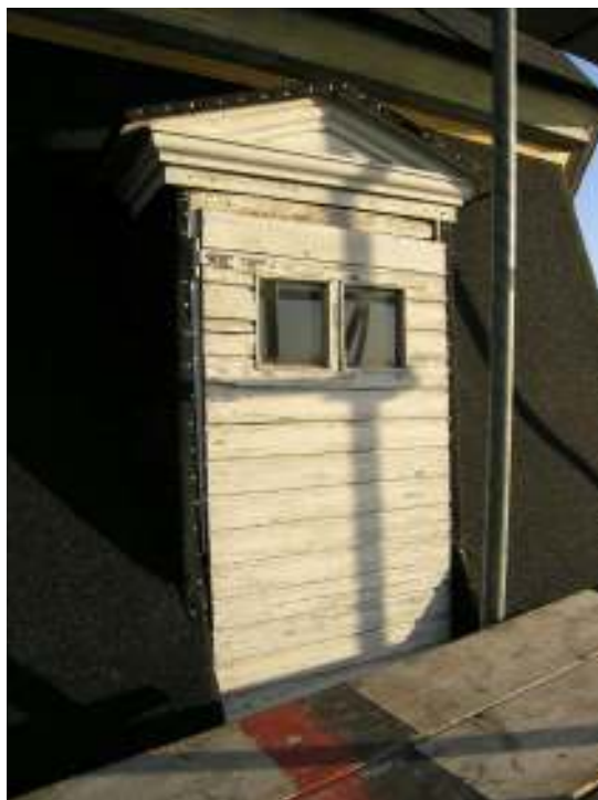
Dörr på bölet med ny takpapp omkring.