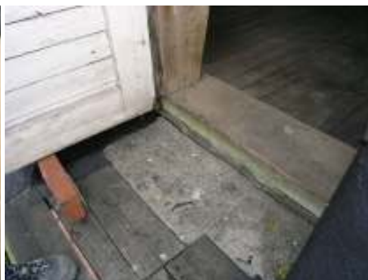
Gjuten sula med bristfällig avvattning, vid skarv mellan bölet och omgången. Problemet bör åtgärdas i samband med nästa restaurering.