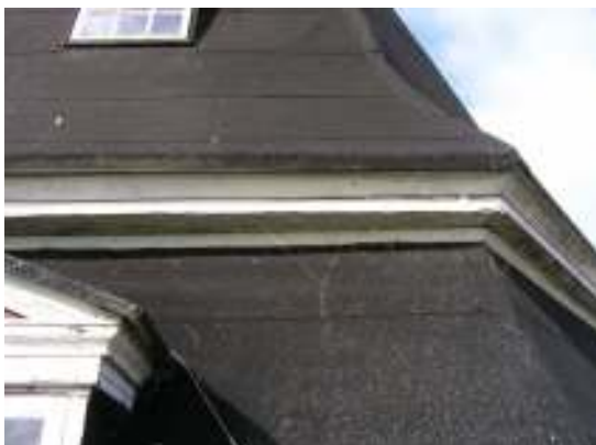
Gesims i behov översyn och ommålning.