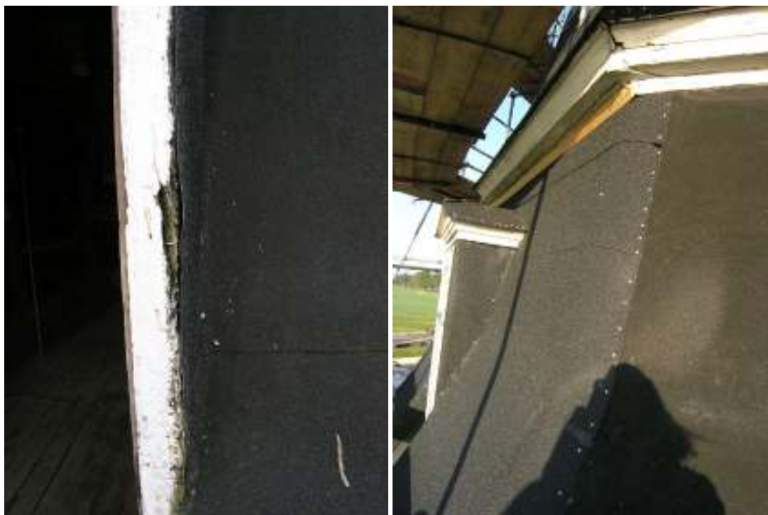
Detalj av utsatt dörrkarm vid bölet.