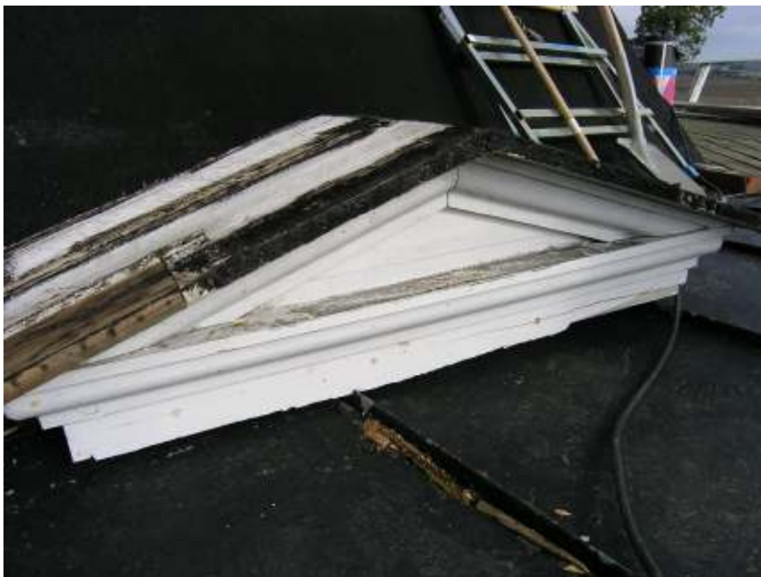
Nedplockad fronton som utgör överstycke till en av bölets dörrar.