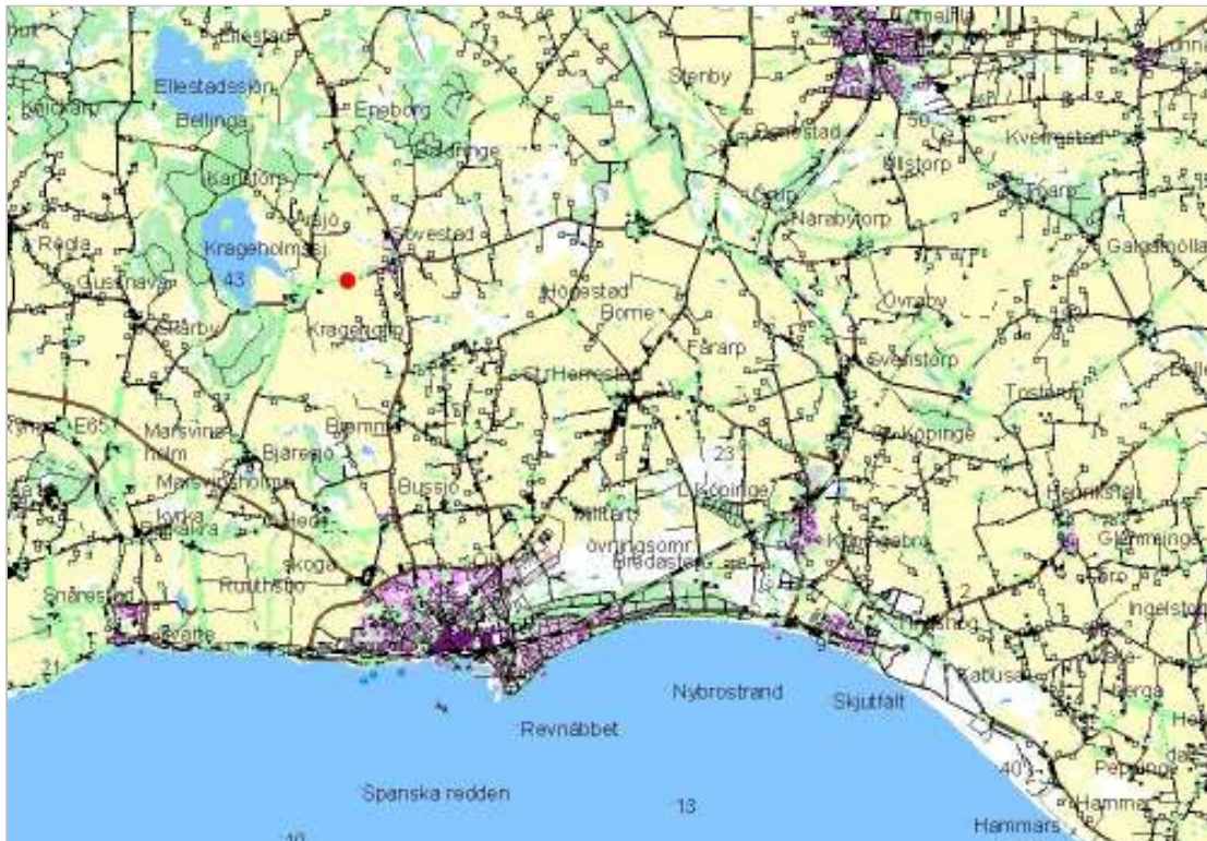
Krageholms mölla ligger omkring 8 km nordnordväst om Ystad. Krageholms mölla markerad med punkt på kartan.