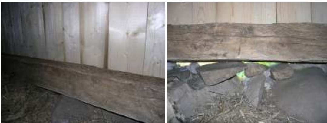
Ursprungligt remstycke kunde bevaras och ny panel anslutas till det.