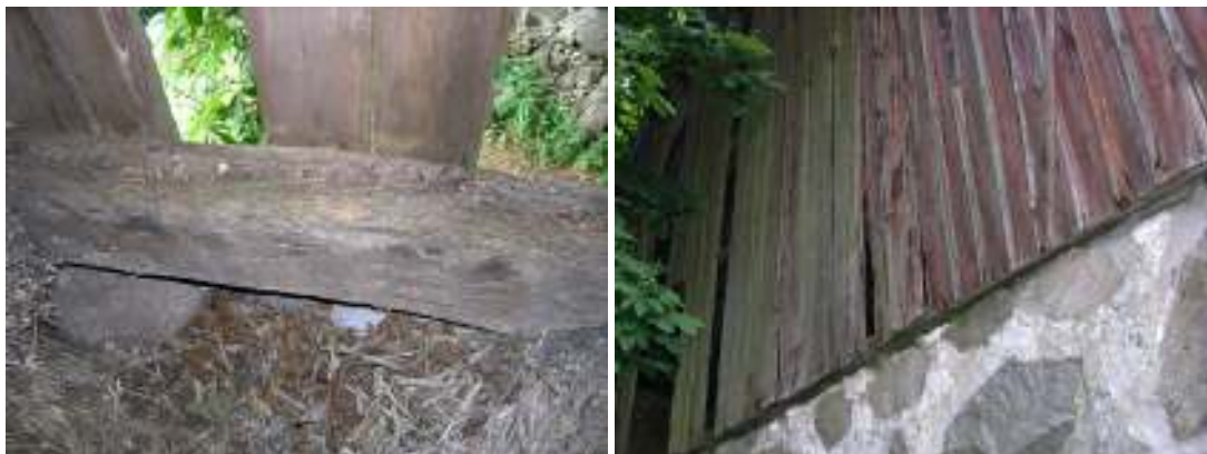
Anfritt remstycke med gles panel på grund av skador. Samma panel sedd utifrån.

Anledningen till att den sentida porten bör bevaras, är att den tillkom när gården ännu utgjorde ett aktivt lantbruk. Därför representerar porten ett kulturhistoriskt lager och bör bevaras för att kunna berätta gårdens historia.