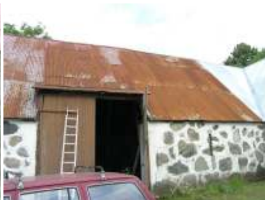
Sentida och förhöjd port mot öster, in mot gården.