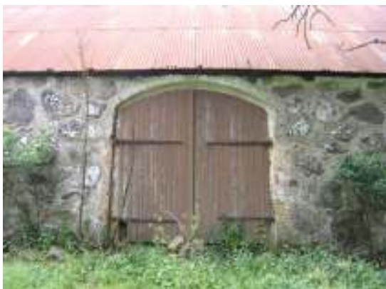
Ursprunglig portöppning mot väster.