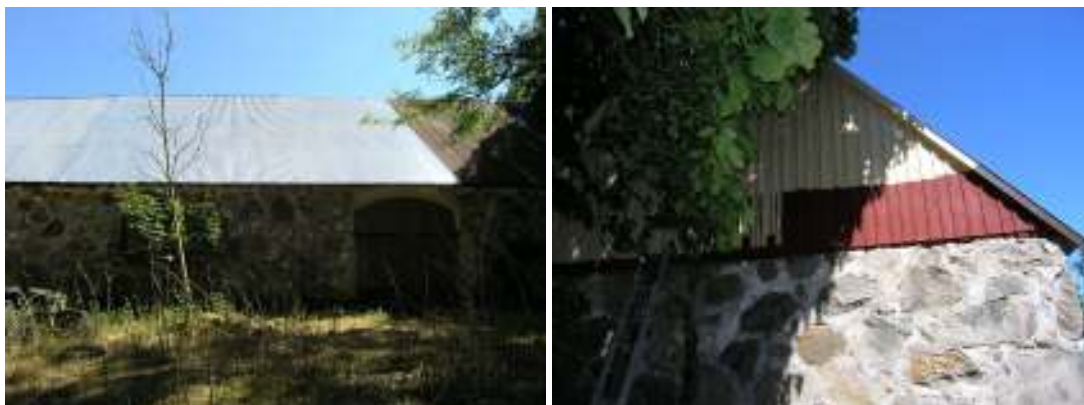
Västra längans nylagda plåttak.