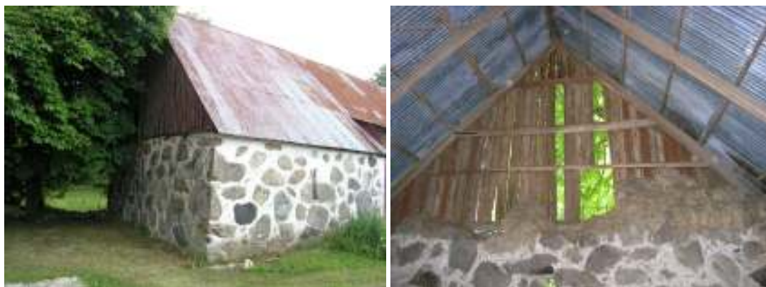
Den västra längans södra gavel innan gavelröstets panel åtgärdades.