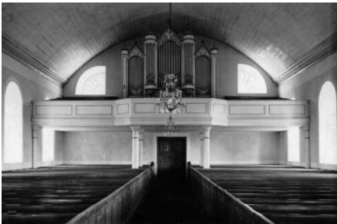
Bild 1: Äldre odaterat fotografi i ATA där orgelfasaden framstår som enfärgad, troligen vit, med förgylld dekor.