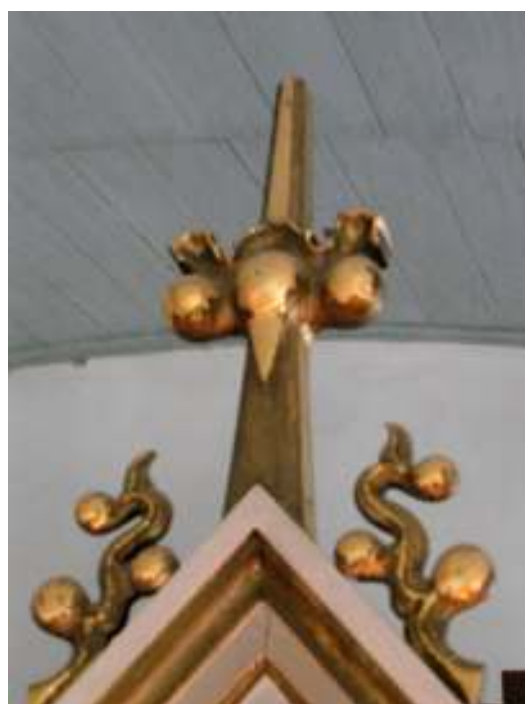
Bild 2: Sprickbildning i träet med påföljande färgflagning innan arbetenas början. Bild 3: Oxiderad slagmetallförgyllning i orgelns krönparti före arbetenas början.