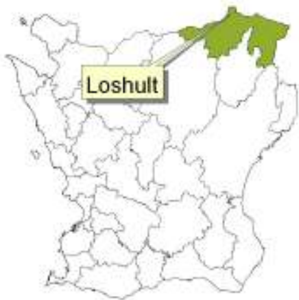
Skånekartan med Osby kommun och Loshult markerade.