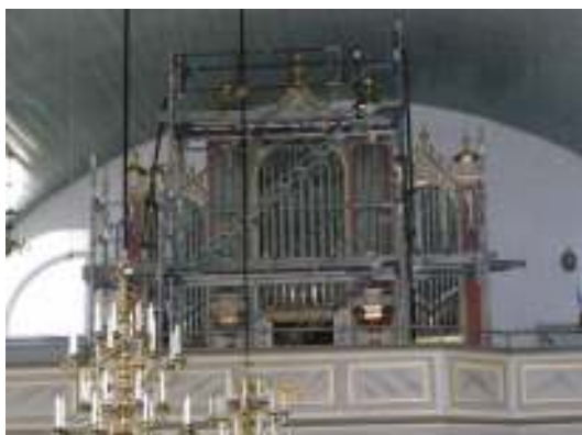
Bild 4: Orgelfasaden efter avslutat arbete. Bild 5: Färgen har troligen inte drivits ut i tillräcklig omfattning därav de strimmiga resultatet.