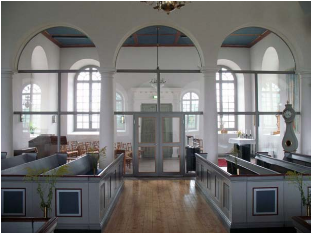
I Hemmesjö nya kyrka har korsarmen delats av från övriga kyrkorummet genom en glasvägg.

Nästa föredragshållare Länsantikvarien i Kronobergs län, Heidi Vassi gav några exempel på hur man har löst problematiken med stora kyrkorum och små församlingar i Kronobergs län. En vanlig lösning är att skärma av korsarmarna eller inreda utrymmen under läktaren. I Markaryds kyrka har utrymmen tillskapats på vardera norra och södra sidan under läktaren. Tolgs kyrka är ett annat exempel där läktarunderbyggnaden har avskärmats från kyrkorummet med en glasvägg. I Hemmesjö nya kyrka har korsarmarna delats av så att ett mindre kyrkorum har skapats, bättre anpassat efter dagens verksamhetsbehov.