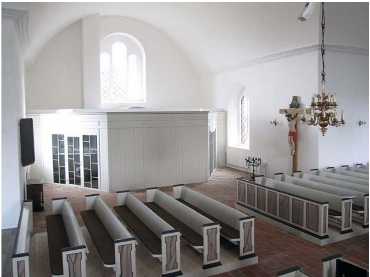
Inbyggnad i en av korsarmarna i Torrlösa kyrka. Bild: Wikerstål arkitekter AB.

Arkitektkåren representerades under dag 2 av Erik Wikerstål från Wikerstål arkitekter AB som visade två exempel på arkitektkontorets arbete med om- och tillbyggnader i kyrkomiljö. I Torrlösa kyrka har nya inbyggnader tillskapats i korsarmarna. För Vikens kyrka planeras en tillbyggnad till långhuset i form av en ny entrébyggnad.