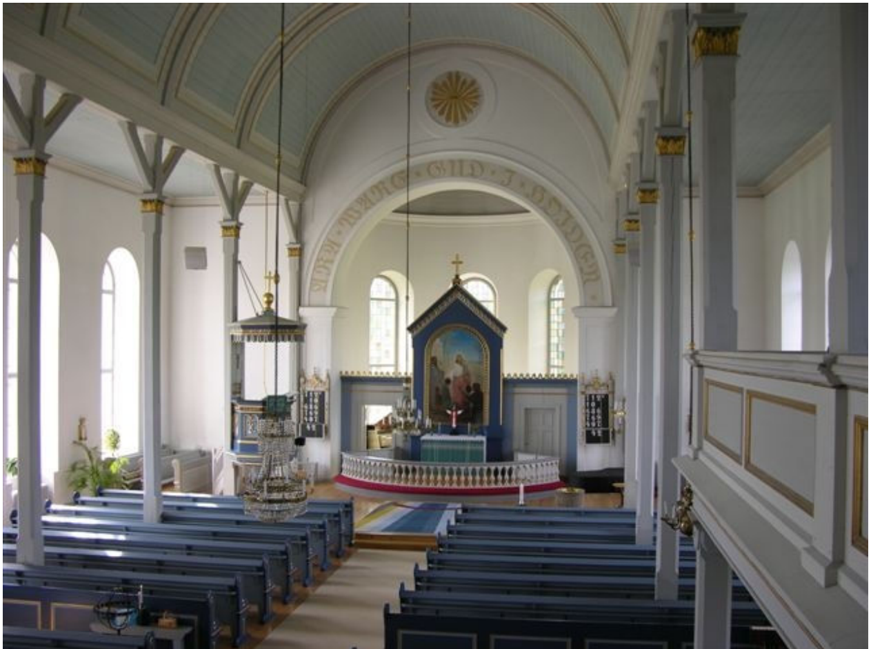
Interiörbild av Vederslövs nya kyrka.

Vederslövs kyrka byggdes 1878-1889 som ersättning för de gamla kyrkorna i Vederslöv och Dänningelanda. Kyrkan uppfördes i en blandstil med dominerande nygotiska drag. Idag kvarstår Vederslövs kyrka som en av länets mest oförändrade sena 1800-talskyrkor med höga kulturhistoriska värden även om interiör färgsättning är senare än kyrkans tillkomsttid. Den medeltida kyrkan i Vederslöv finns ännu kvar och är en populär bröllopskyrka.