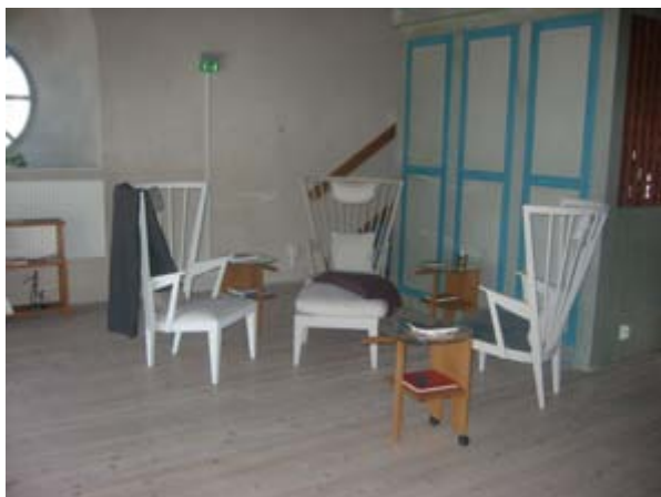
Några bilder från Lima kyrka. Till vänster syns det nya samlingsutrymmet under läktaren och till höger utrymmet uppe på läktaren bakom orgeln.